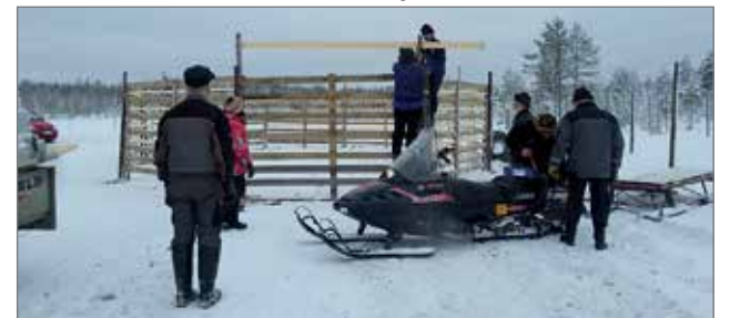
Nuorittan porokisat ajetaan 20. helmikuuta. Talkootyöt ovat edenneet suunnitelmien mukaan.