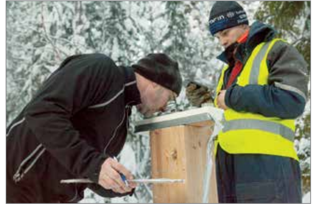
Viimevuoden Tehtävärasti 4:llä pyrittiin tunnistamaan nestettä hajun perusteella.

Pentikäisen alustuksen aiheena on Suomalainen yrittäjyys - Tulevaisuus. Yrittäjätalaisuudessa luodaan myös katsaus pudasjärveläiseen elinkeinoelämään, josta tarkemmin kertoo kehittämisjohtaja Jorma Pietiläinen.