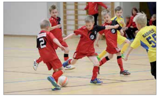
Sunnuntaina 22.11. Tuomas Sammeltuon sali veti reilusti toista sataa ihmistä viettämään päivää junnufutsalin parissa. 07-08- juniorit nauttivat kotikentän tunnelmasta!

Kurenpojat taistelee sarjan kärkisijoista seuraavan kerran Pudasjärvellä lauantaina 13.2. Tuomas Sammeltuon salilla pelataan päivän mit-