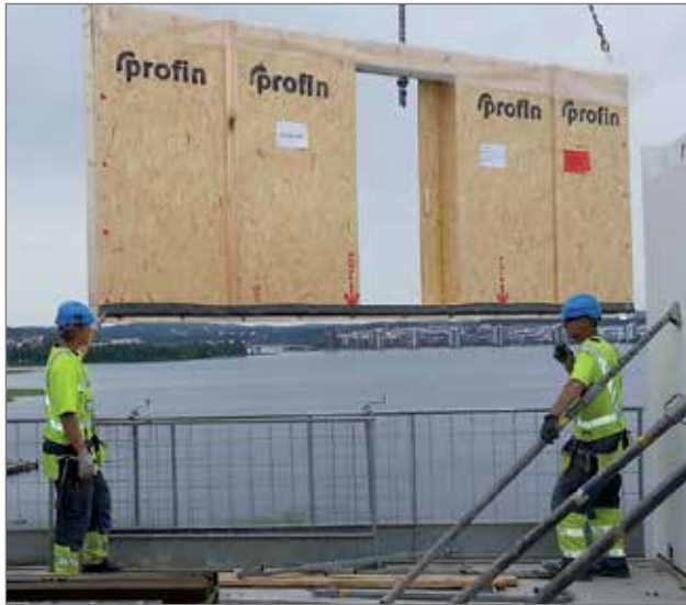
Profin Oy toimittaa Espoon kaupunkikeskukseen Tapiolaan Profin 5 in 1 lasiliukuseinä-järjestelmän.

Profin Oy on avannut markkinat myös Ruotsissa ja Norjassa, jossa sillä on useita vastaavia hankkeita neuvotteluissa.