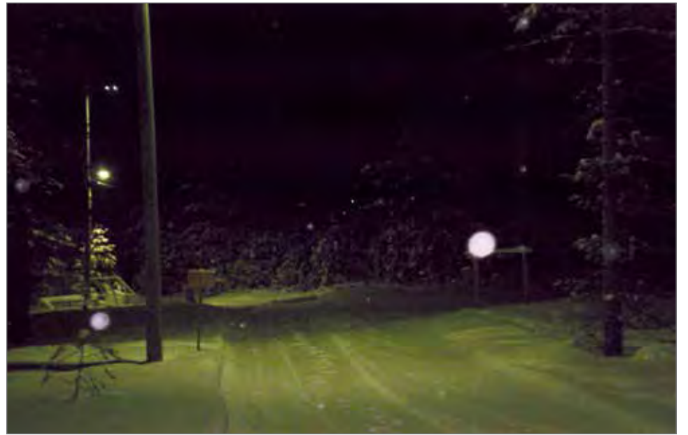
Hiihtäjien käytössä on 3,5 kilometrin perinteisen- ja luisteluhiihdon ladut. Valaistus on päällä kello 21 saakka.