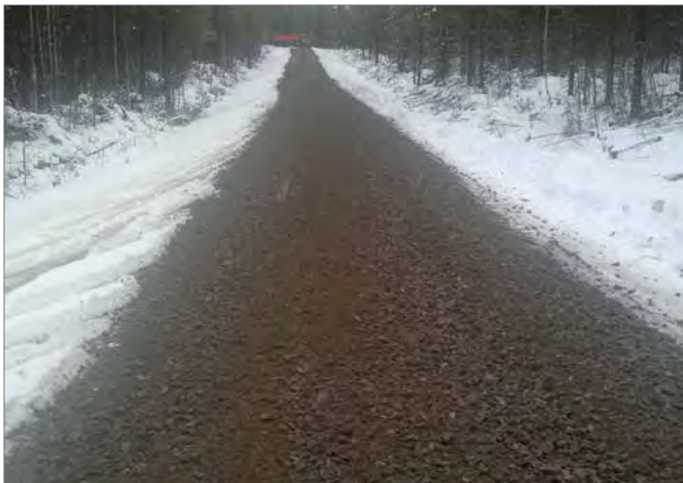
Yksitystien perusparannusta Koillismaalla.