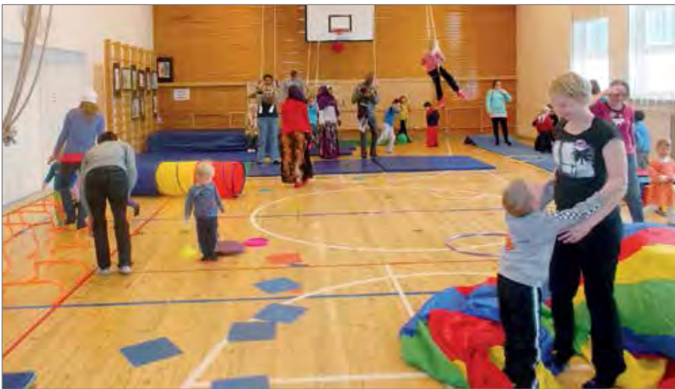
Perheliikuntamaa -tapahtumassa on mukana suomistarttilaisia ja muita nuoria.

Viime vuoden urheilutapahtumaksi valittiin Kalevan Rastiviesti. Vuoden sykkädyttävien urheiluhetki Pohjois-Pohjanmaalla 2013 oli yleisön äänestämänä Oulun Kärppien 17 ottelun voitto-putki SM-liigassa. PK