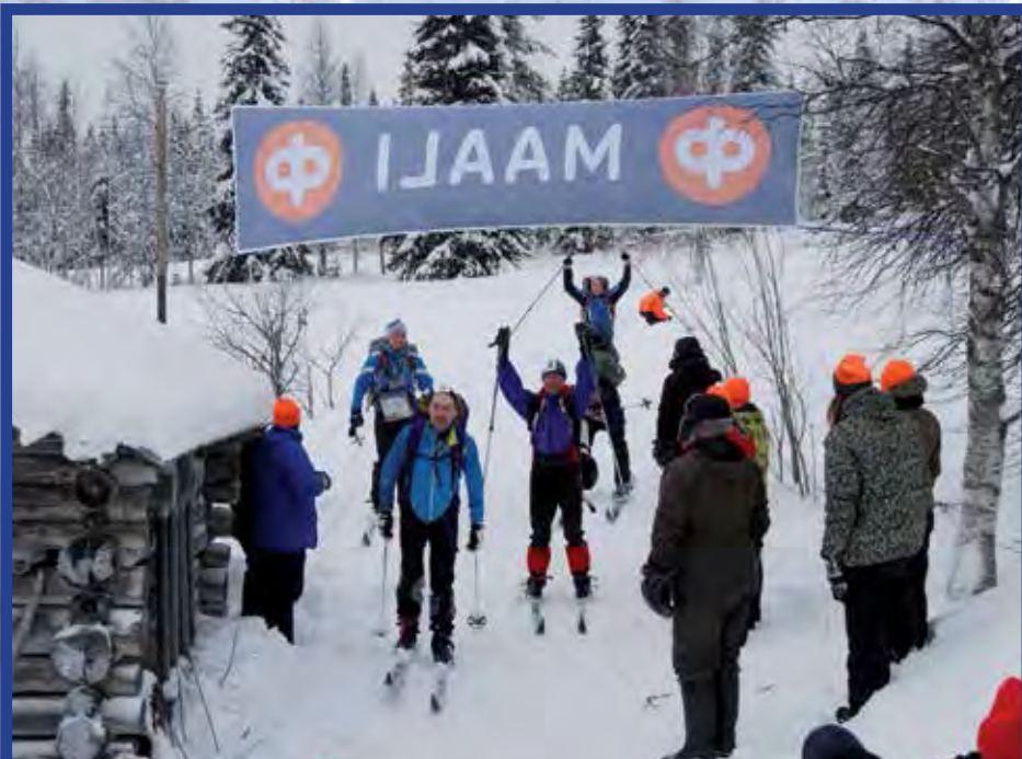
Kiinteistö-Neliön joukkue riemuitsee maalissa viime vuonna, kuva Antti Lehto.

Hyvää menestystä ja noavia joukkueita on paljon. Aiemmin menestyneistä mainittakoon muun muassa Kiinteistöneliö, Shelby Oy, Sivakkapartio, Laskuvarjojääkärikilta 1 ja 2., Nahjukset, Metsäläiset, Suomen Sotilas, Sawon Sissit, Mörskän Miehet ja Kova Oksa. Nahjusten kunniaksi voi todeta, että he ovat vuosien saatossa menestyneet rastehtävissä erityisen hyvin. Yksilökilpailun voitto on koko kilpailujen historian ajan jaettu kuuden eri miehen kesken, joista nyt vain yksi ei osallistu kilpailuun. Kuusi kilpailijaa osallistuu tänä vuonna tapahtumaan 15:sta kertaa, joten heille on järjestäjältä luvassa palkinnoksi ja muistoksi kisastandaari. Lukuisille osallistujille Umpihankihiihto-tapahtuma sinällään ja liikkuminen lumisessa luonnossa on hieno ja mieleenpainuva muisto, jonka he haluavat kokea uudestaan, vuosi toisensa jälkeen.