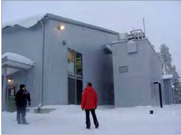
Pudasjärveltä tehtiin Posion jäähalliin tutustumismatka. Vasemmalla on hallin sisäänkäynti, keskellä kylmälaite- ja ilmanvaihtokontit. Oikealla näkyy hieman jäähallin konehuonetta.