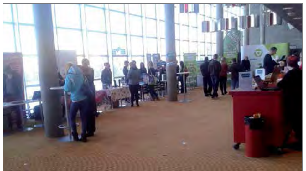
Kaupunginteatterin aulassa oli monenlaisia infopisteitä nuorille.

Tarkoituksena oli lisätä Karhupajan nuorille in-