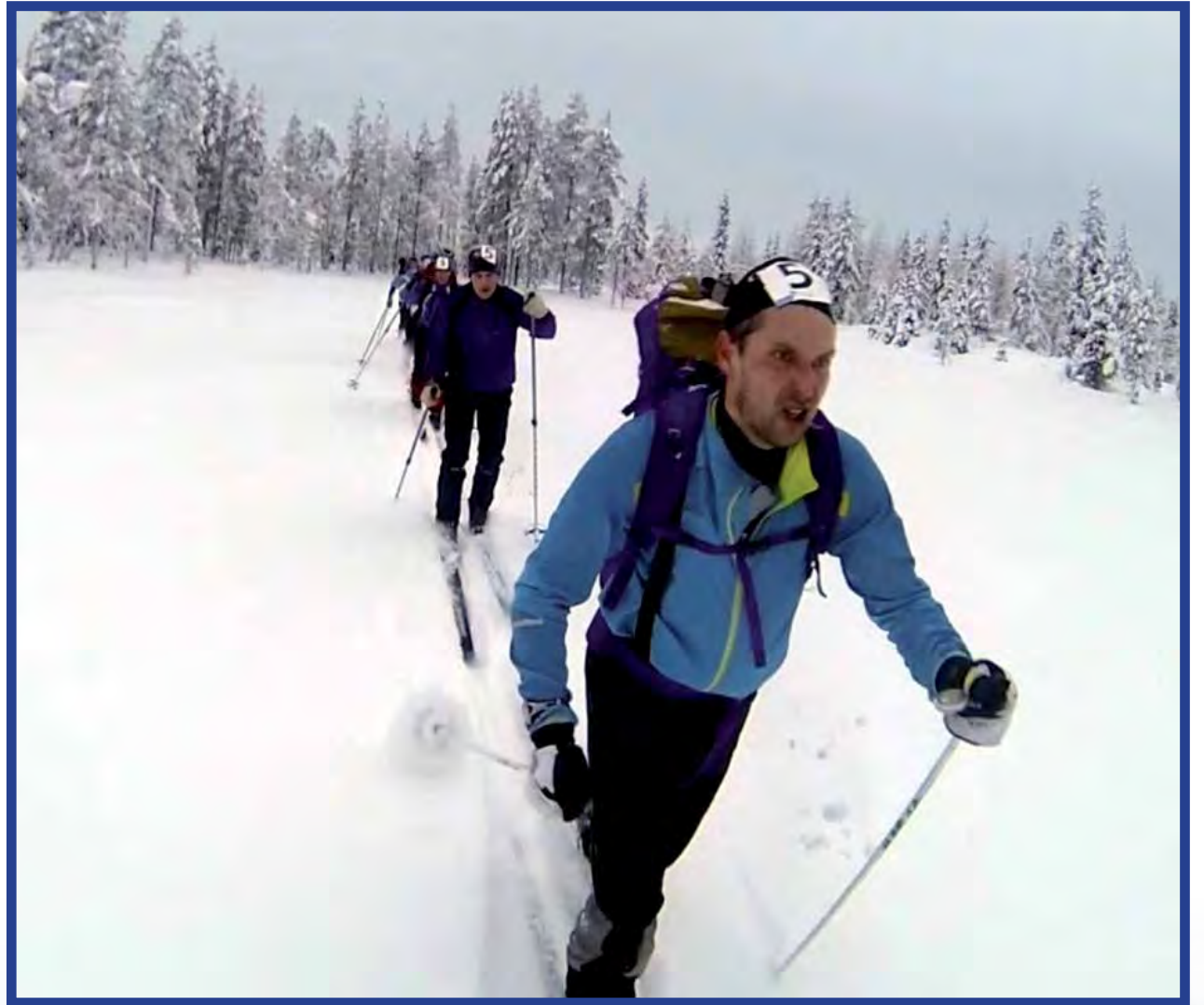
Kiinteistö-Neliön joukkue umpihankiosuudella. Kuva viime vuodelta.

Erätaidot ovat kisaajalle välttämättömyys. Kisassa ei ratkaise pelkästään kova kunto ja nopeus, vaan matkan varrella on myös teh-