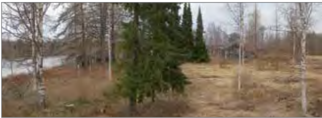
Kokous käsitteli Kurenalan koulukampukseen toteuttamiseen liittyen Poroputaan rakennuspaikan vuokraamista Kuntarahoitus Oy:lle.