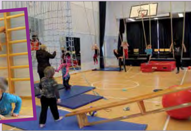
Lapsille oli Hyvän olon päivässä mahdollisuus kiipeillä ja saada hyvää oloa liikkumisesta.