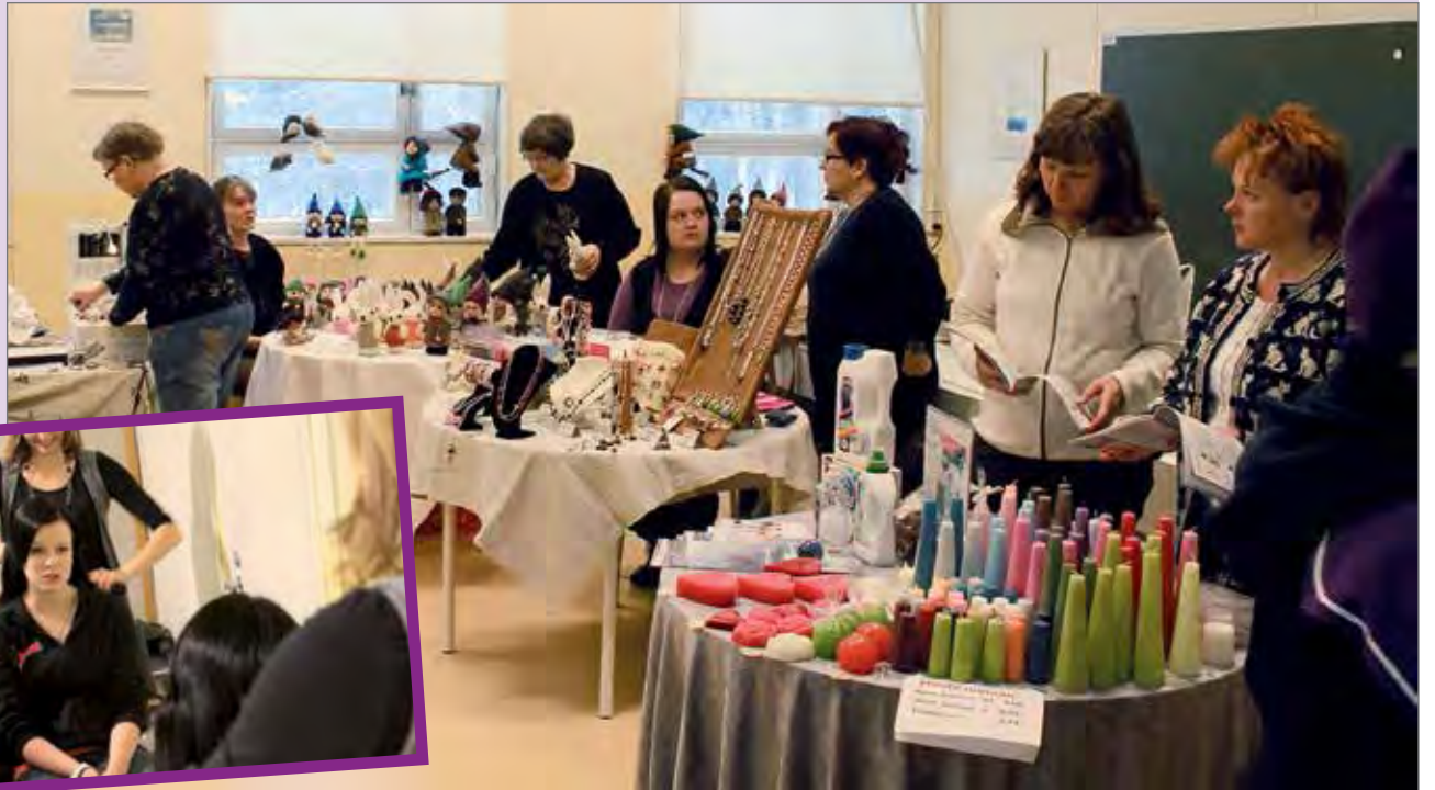
Myyjiä oli saapunut mukavasti tuomaan markkinahenkeä hyvän olon tuotteilla.

Hirvaskosken kyläyhdistys toivottelee teille, mukavaa menoa ja odotusta hankikelille.