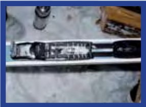
Metsäsuksessa hiihtomonolle tarkoitetut siteet.

tävä- ja lisärasteja, joilla käyminen ja tehtävistä suoriutuminen parantaa mahdollisuutta voittoon ja epäonnistuminen puolestaan vaikuttaa tuntuvasti seuraavan päivän lähtöaikaan.