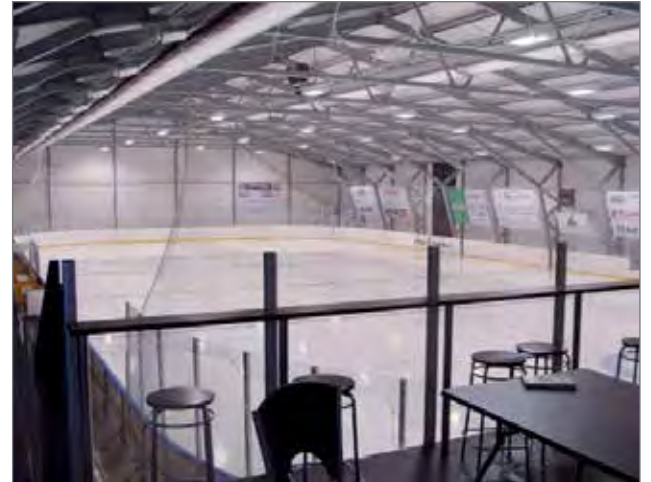
Kahviosta kentälle ovat Posion hallissa erittäin hyvä näkyvyys.