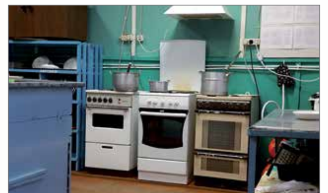
Kesselin hankkima vesipumppu toimii edelleen ja helpottaa emäntien työtä.

- Sinun ystäväsi käveli tiellä noin sadan metrin päässä hukasta, sanoin.