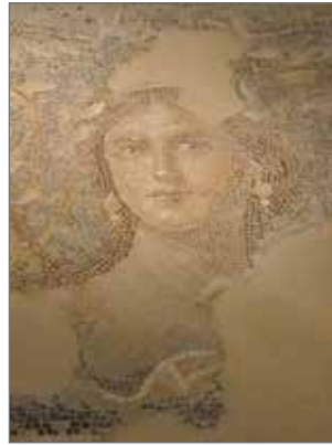
Mosaiikin kaunotar lähikuvassa.

Jälleenrakennus on työllistänyt paljon ammattivaik- keä, jota tuli tietysti myös