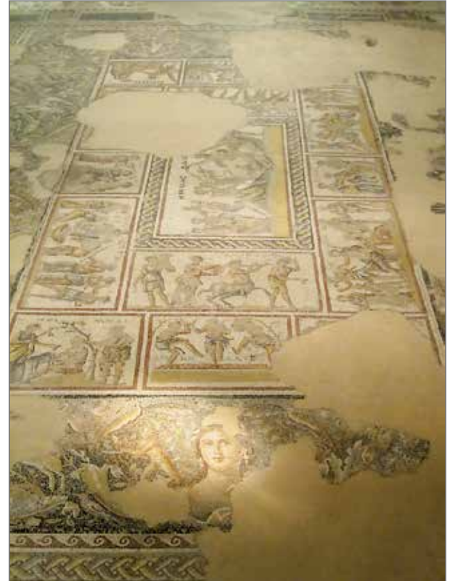
“Mona Lisa” valaistuna etualalla.

Jeesus tunsu rakenta- jan työtä ja arkea, puhuihan hän vertauksen oikeanlaisel- le paikalle tehdystä perus- tuksesta, joka kestää. Vertauksen kaupungista, joka ei ylhäällä vuorella voi pysyä kätöksessä, on nähty viittaavan lähes kolmensadan met-