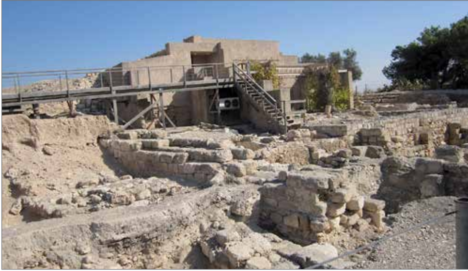
Dionysoksen talon mosaiikit löytyvät taustalla olevasta rakennuksesta.

Syksyisen hellepäivän aurinko paahtaa muinaisen Seforiksen (Zipporin) kaupungin raunioita Israelin Galileassa. Korkealta kukkulalta näkee kauas. Sää on nyt poikkeuksellisen kuuma. Haifan suunnasta raportoidaan metsäpaloja (niin kuin tätä kirjoittaessani runsas kuusi vuotta myöhemmin). Nasaretista ottamamme taksinkuljettaja on vetäytynyt juomapulloineen kauemmas varjoon.