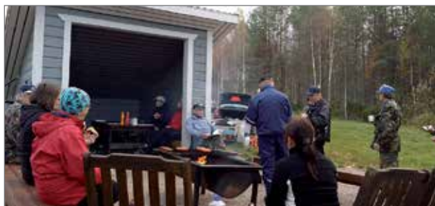
Ala-Siuruan laavulla 18.9.2016.

Keskustelussa nousi esille tyytyväisyys hakkeen toimintaan. Esille nousseita kommentteja olivat muun