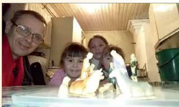
Lapset tarkkaavaisesti seurasivat tallin ihmeen kehittymistä.

Polttopuilla lämpöä. Koulussa on melkein joka nurkassa uuni. Työtä tekijälle, mutta pääasia, että koululaisilla on lämmin.