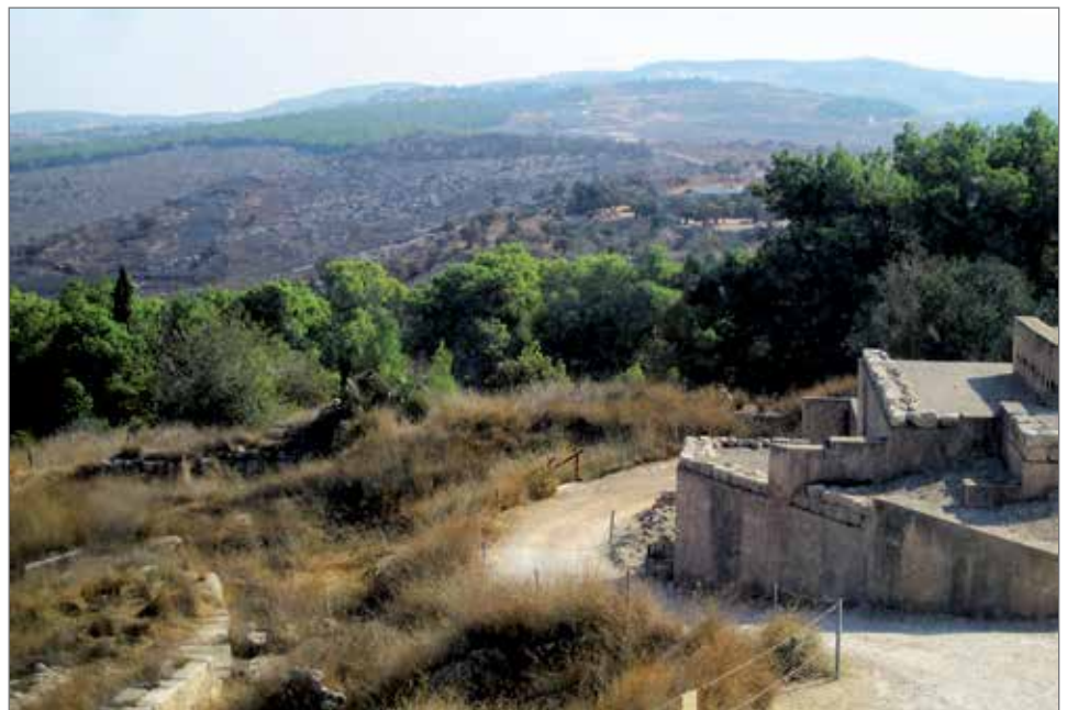
Seforis on nykyisin osa Zipporin kansallispuistoa.

Kirjoittaja on pudasjärveläislähtöinen tietokirjailija. Hän asuu nykyisin Rovaniemellä ja harrastaa matkailua.