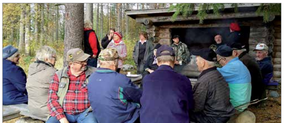
Aittojärven laavulla 14.9.2016.

Osallistuva budjetointi on ollut keskeisellä sijalla Laavun toiminnassa. Osallistuva