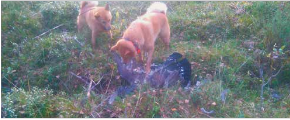
Aina ei tänäkään syksynä töpeksitty. Riitun ja Hillan yhteistyö tuotti tulosta vanhan kukon muodossa - Joulumetso oli annettu eräksi!

Nousen jo UKK -polun länsipuolelle vajaan kilometrin verran, kun toivottu tapahtuu. Hilla alkaa kiihkeän haukun kahden sadan