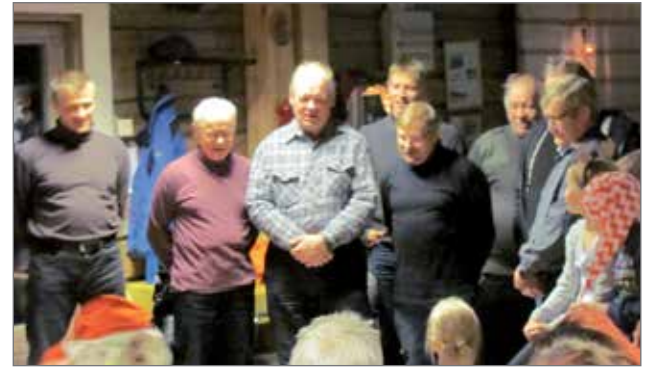
Mieskuoro esitti Äidin porsaats.