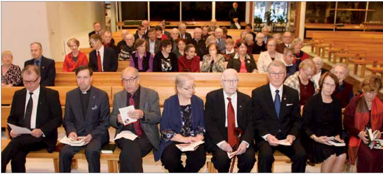
Sotiemme veteraaneja, puolisoita, leskiä ja tukijäseniä kokoontuneena seurakuntakodille yhteiseen joulujuhlaan.