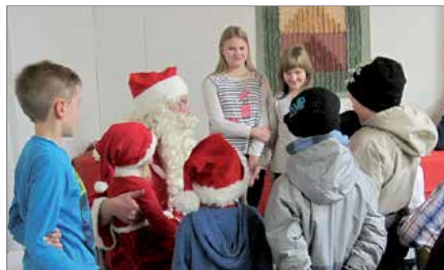
Lapset laulavat joulupukille.