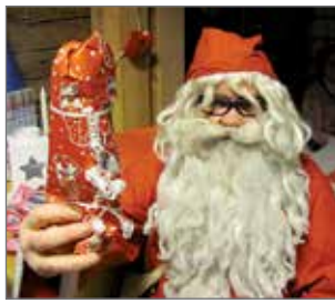
Joulupukki kertoi tulleen Korvatunturilta saakka.