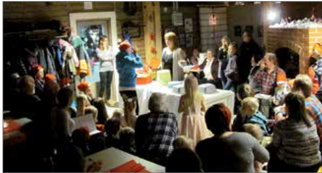
Pikkujouluperinne elvytettiin Marikaisjärvellä ja perinnettä päätettiin myös jatkaa.