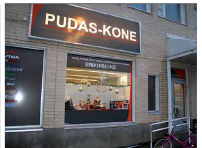
Pudas-Kone on ostanut ST1 nimellä tunnetun kiinteistön ja muuttamassa uusiin tiloihin keväällä ennen puutarhakauden avaamista.

- Nyt katsotaan tilannetta. Kuluttajathan sen viime kädessä päättävät, onko aukioloaikojen pidennys hyvä vai huono asia, Päckilä toteaa. PK, AK