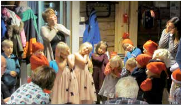
Soihdut sammuu tonttuleikki lisäsi joulutunnelmaa.