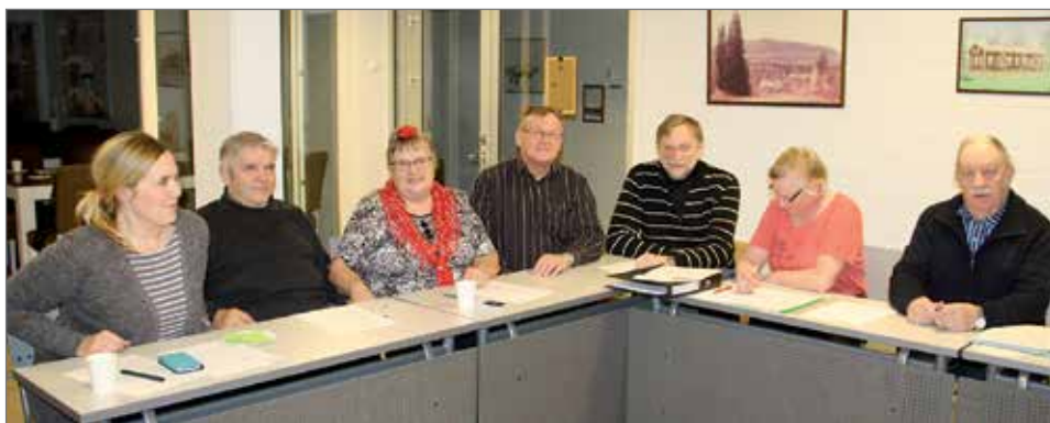
Keskustan Kurenalan paikallisyhdistyksen syyskokous sujui lämminhenkisenä ja rakentavan keskustelun merkeissä.