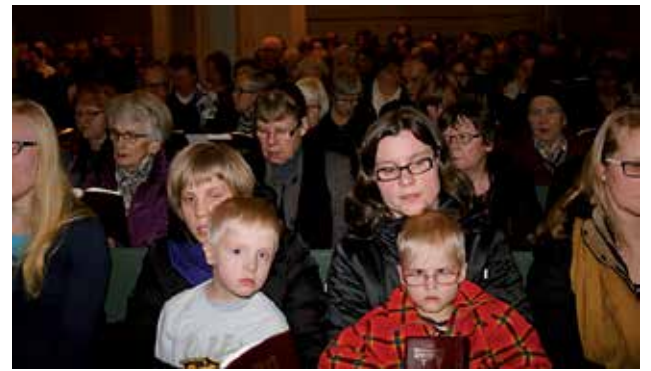
Kirkossa oli runsaasti kuulijoita, vain muutamalla penkillä eturivissä oli jäänyt tilaa.