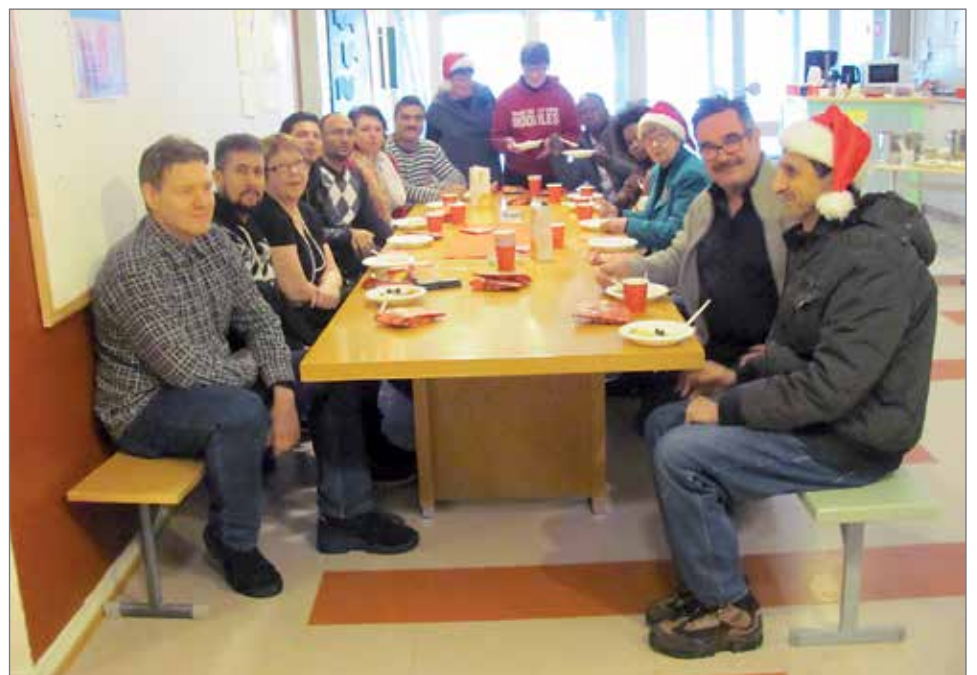
Puurojuhlassa nautittiin pöydän antimista, sekä keskusteltiin kuulumisista ja suunniteltiin tulevaa!