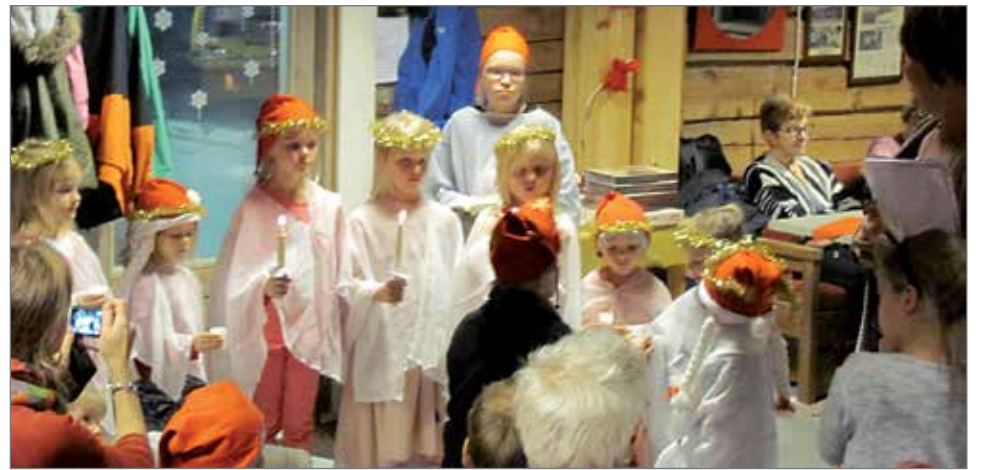
Lapset esittivät jouluevankeliumin.