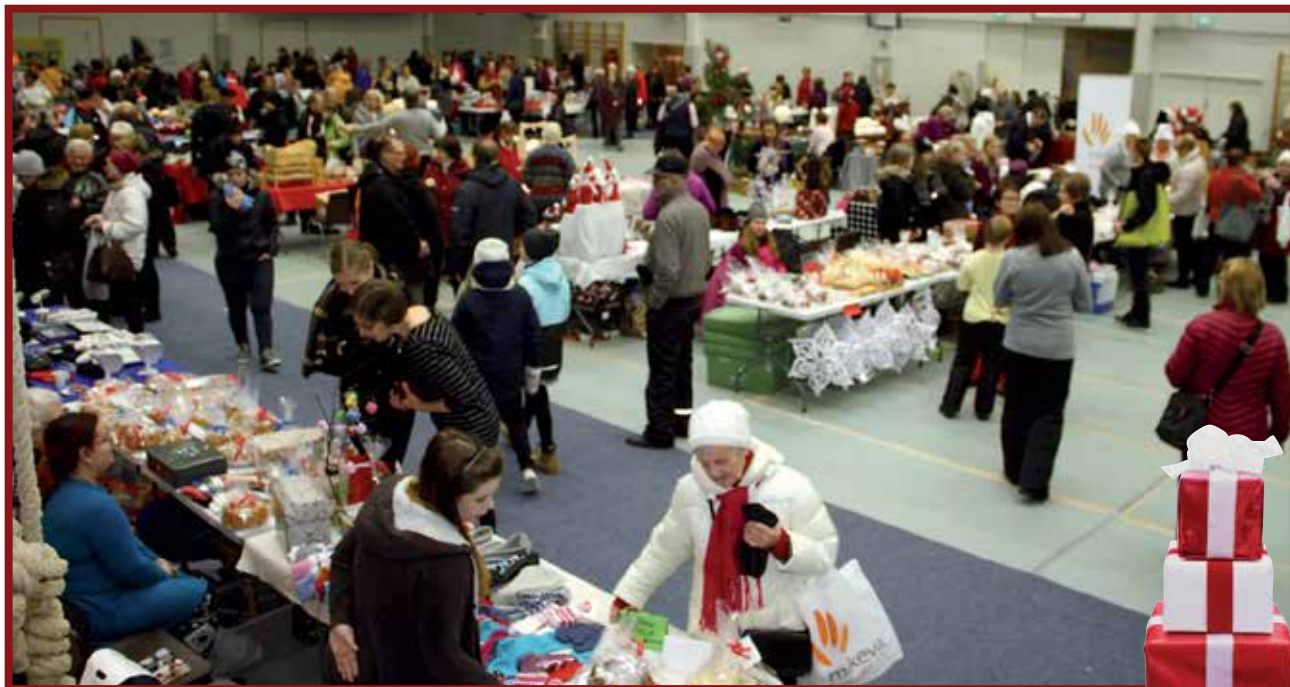
Joulumyyjäisten aikaan Sammelvuon -sali täyttyi myyjistä ja ostajista.