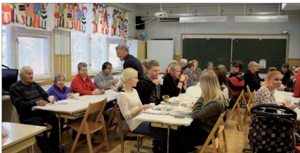
Aitto-ojan hirvipeijaisissa oli tupa täynnä väkeä.

Hyvän hirvikannan myötä Aitto-ojan Metsästysseuran hirviporukka sai kaadet-