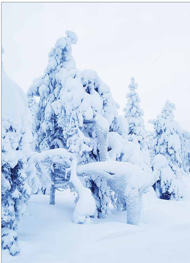
Talvinen maisema Iso-Syötteen huipulla, jota matkailijat ihailtavat.