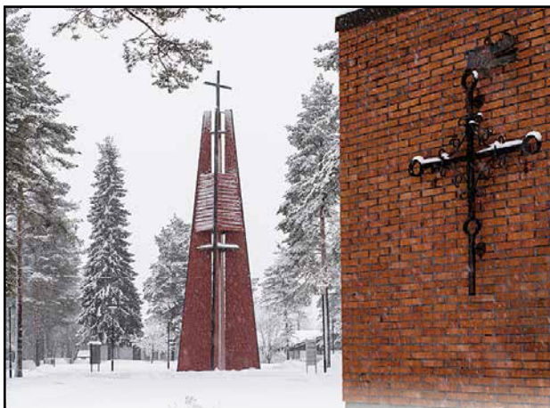
Seurakunnan tilaisuudet toteutetaan vallitsevan koronatilanteen vuoksi 28.2.2021 saakka vain YouTube välityksellä ilman läsnäolevaa seurakuntaa.