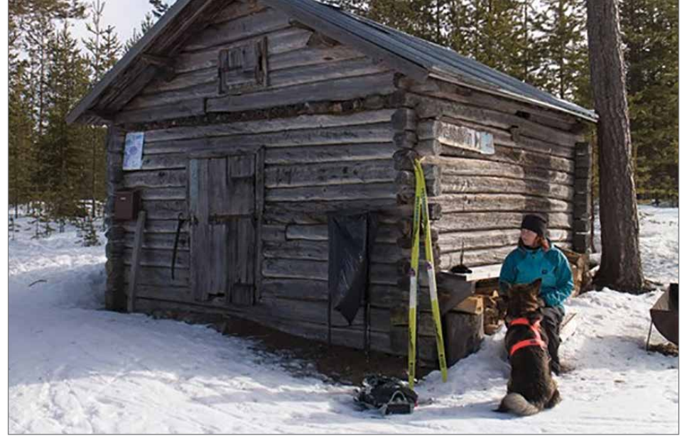
Mustalammen kämpän vihkoon on merkitty 3375 käyntiä.