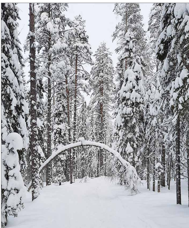
Syötteen kansallispuiston kävijämäärät nousivat 47 prosenttia, joka kertoo myös Syötteen luonnon ja reittien kiinnostavuudesta.