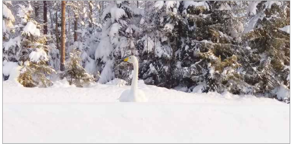
Koska nyt ollaan jo helmikuun puolella, joutsenten muutto saattaa alkaa jo kuukauden päästä. Oliko tämä yksilö harhautunut liian aikaisin Jaurakalle vai oliko se lankoihin lentänyt tai sairastunut lintuinfluenssaan. Kukapa tietää.