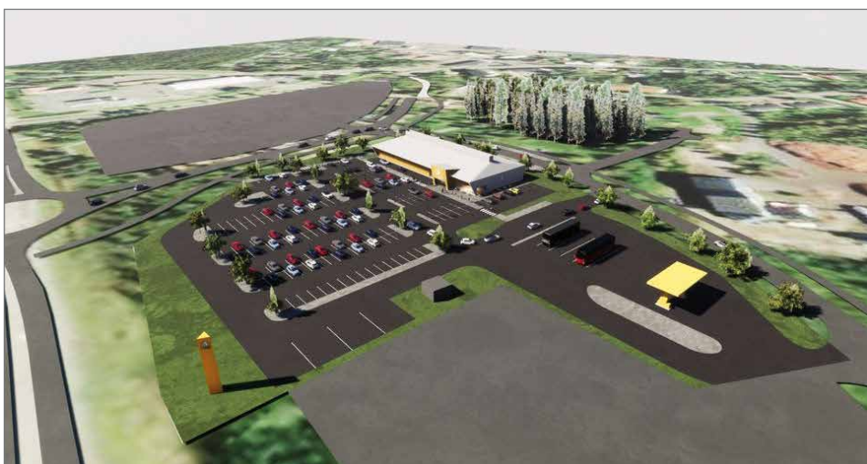
Havainnekuva uudesta ABC Pudasjärven liikennemyymälästä. Pääsuunnittelija on Arkkitehtuuritsto Seppo Valjus Oy.

Uusi ABC liikennemyymälän rakennuksessa on meneillään katon rakentaminen, joka tapahtuu sääsuojatussa kuivassa tilassa. Lämmöt laitetaan myös päälle lähiaikana. Seinien sisällä pohja on ollut suojattuna tyroksieristeillä sulana pysymiseksi. Työmaalla työskentelee 13-15 henkeä, jotka ovat palkattu pääasiassa Pudasjärveltä.