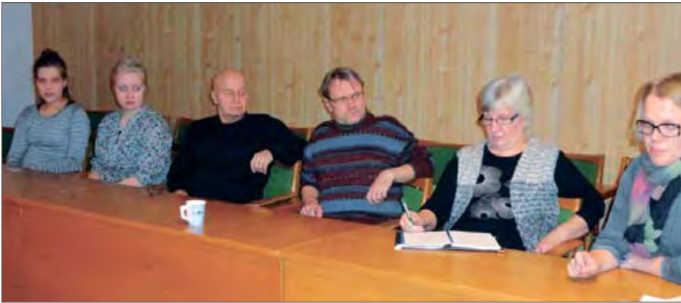
Järjestöjen edustajat istuvat "iltakahvilla".

Pudasjärveläisestä järjestötoiminnasta löytyy monenlaisia osaamisia ja vahvuuksia. Pudasjärven Nuorisoseuran toiminnallisena vahvuutena on mm. eri-ikäisten monipuolinen