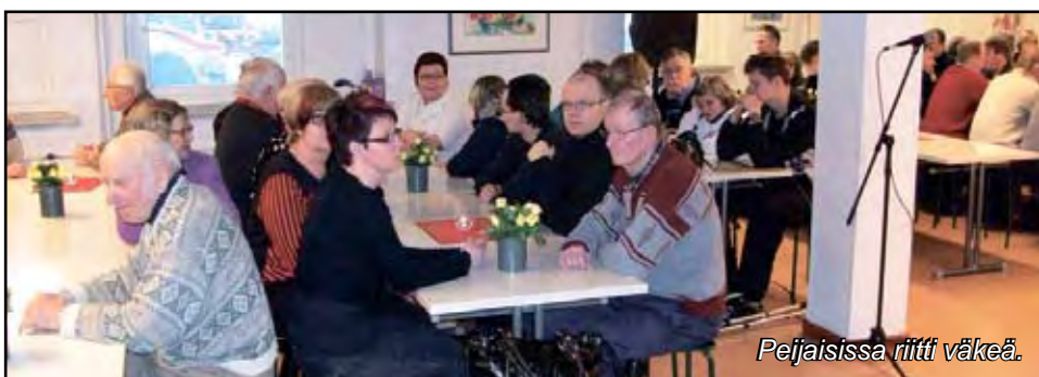
Peijaisissa riitti väkeä.