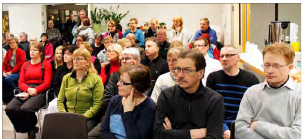
Puikkarin kahvio täyttyi kokonaan Maastokisojen Infotilaisuudessa ja kuulijoita jäi vielä ovensuuhunkin.