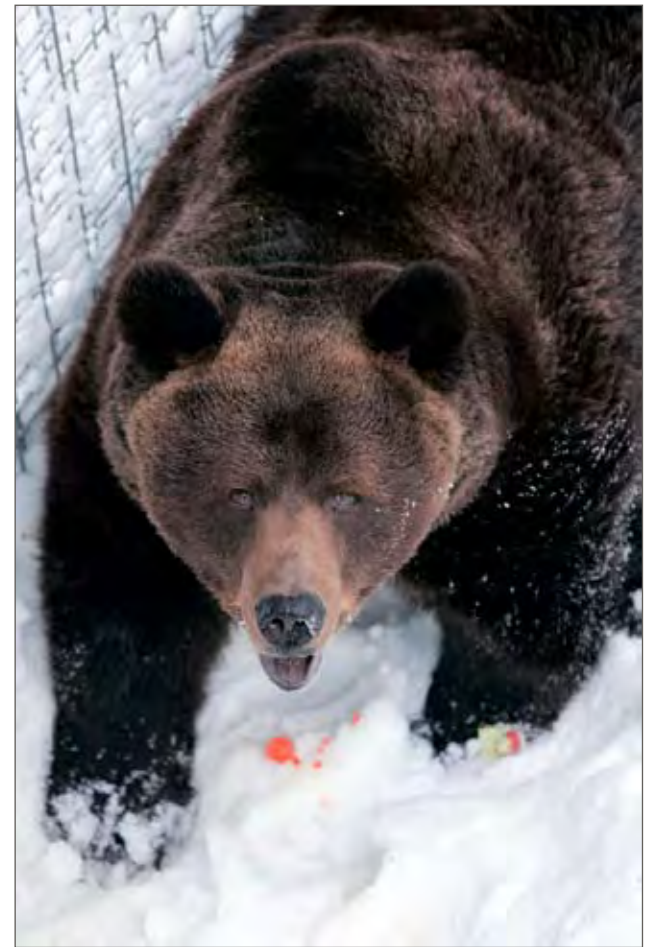
Palle talviunilta heräämisen jälkeen viime talvena.