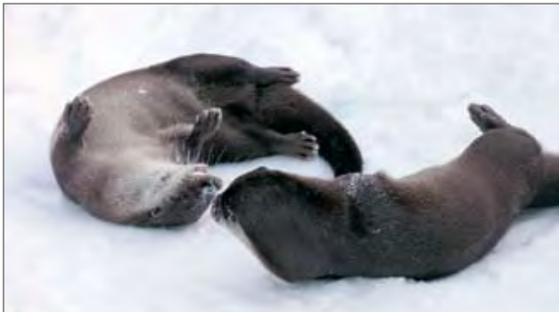
Saukot leikkimässä lumessa.

kirkaaseen kevääseen katkaisee talvisen taianomaisen hämärän ajan. Eläinpuiston kävijöitä hemmotellaan jo pikkuisen lämmittävällä auringonpaisteella. Päivän pidetessä täyttyy eläinpuisto äänistä. Ilveksen ja ketutujen kiima-ajan kyllä huomaa niiden karjahdellessa ja mourutessa lähes vuorokauden ympäri. Hämärän eläimet pöllötkin tuovat oman osansa eläinpuiston äänimaailmaan; on huhuilua, puuskutusta, vihellystä ja puputusta. Keväinen levottomuus tarttuu myös lintulammen joutseniin, hanhiin ja sorsiin, jotka kaakattavat, toitottavat ja kiljuvat -kukin lajinsa mukaan.