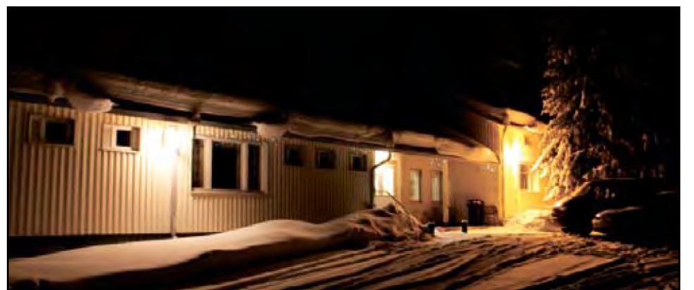
Vanhan Ervastian koulun tiloihin saadaan tunnelmalliset majoitus- ja kokoustilat.

Virallisia avajaisia yritys kaavailee kevättalvella ja suunnitelmana on myöhemmin myös aloittaa kalastusoppaiden täsmäkoulutus työllistävissä hengessä. Ennen avajaisia kutsutaan Ervastian kyläläisiä erikseen tutustumaan yrityksen toimintaan.