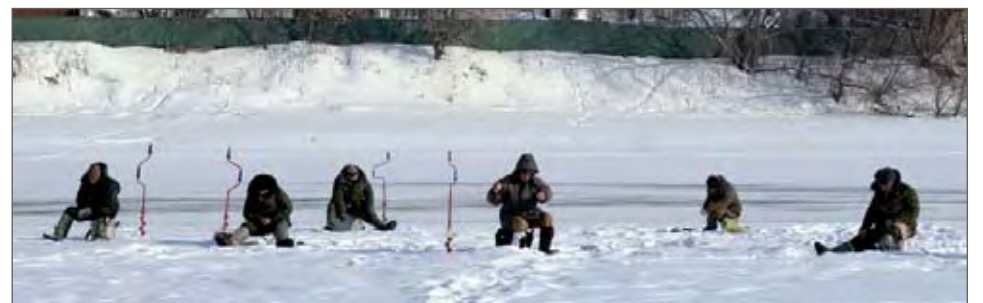
Tuttu näky keväältävesta lähtien.