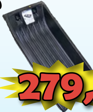
OTTER PRO AHKIO ISO