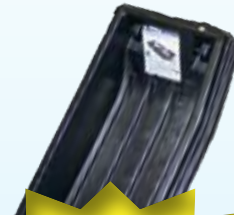
OTTER PRO AHKIO PIENI