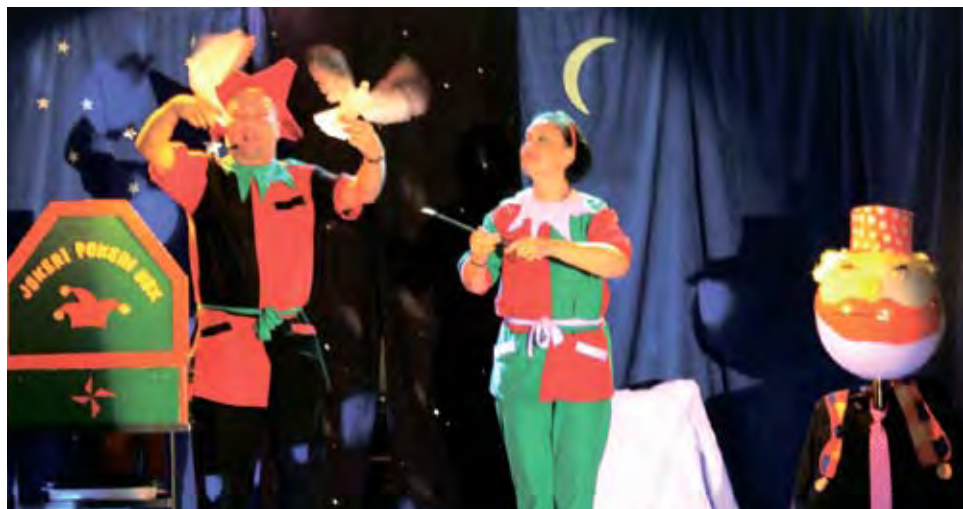
Simo-taikuri ja Kirsti loihitivat esiin ihka oikeita kyyhkysyitä.