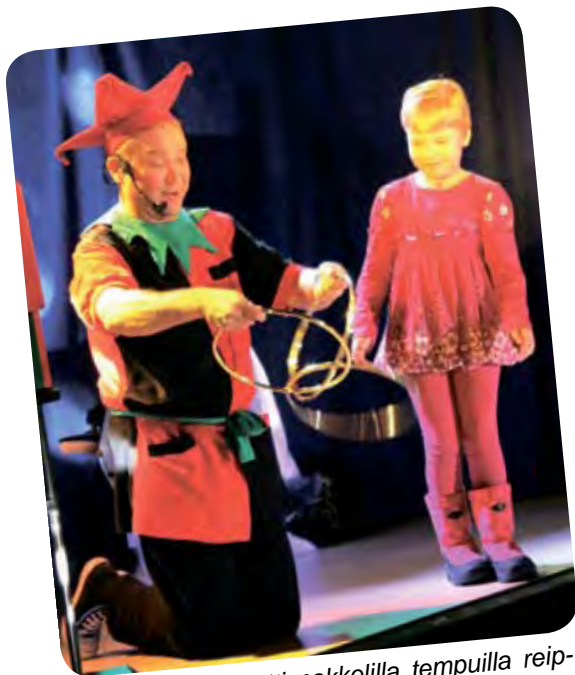
Taikuri hämmästytti nokkelilla tempuilla reippaan avustajansa ollessa mukana.

Jokeri Pokeri Box - "Vedetään nenästä!" -taikashow esitettiin Pudasjärvellä Kurenalan koululla sunnuntaina 9. tammikuuta klo 15.