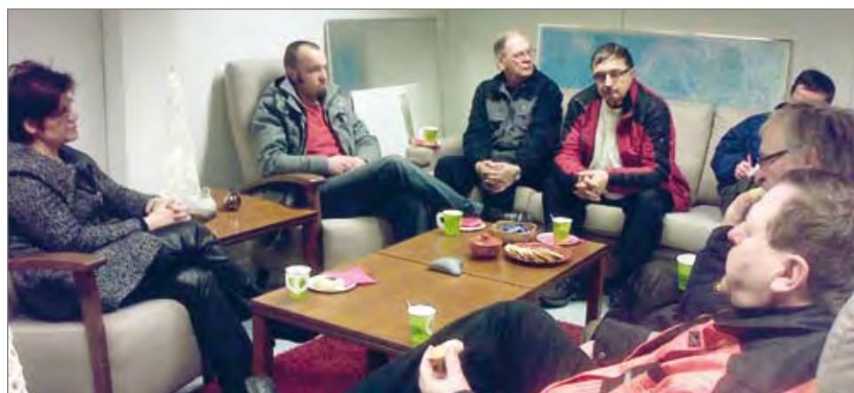
Illalla oli vilkas keskustelu kaupunkia ja yrittäjiä kiinnostavista asioista.

Aamulla torttukahveilla kävijöitä, joukossa muun muassa Pudasjärven yrittäjien edustajat.