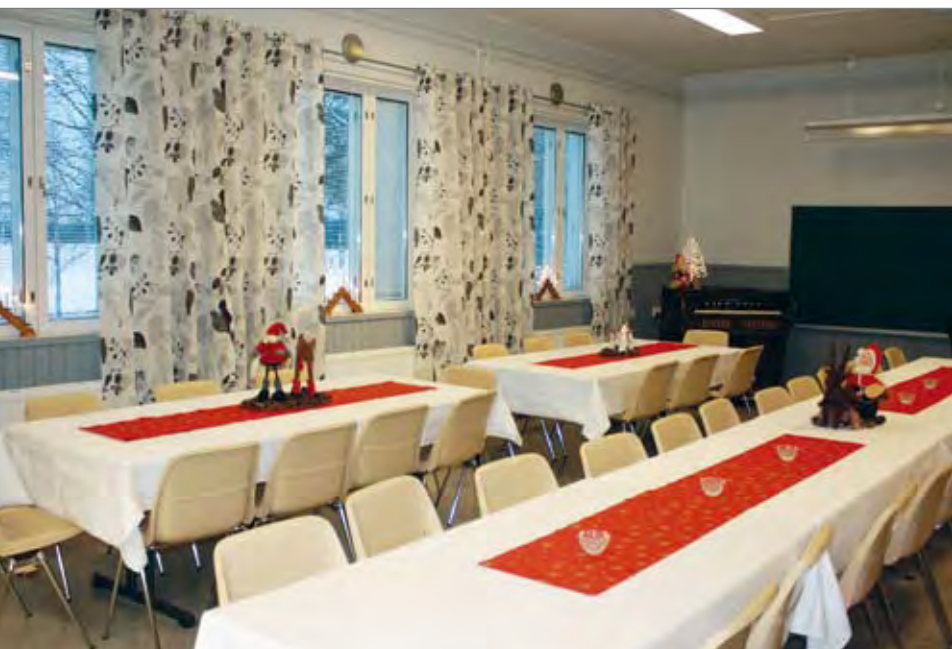
Linattijärven entisellä koululla on vilkasta toimintaa. Joulukuun alussa laitettut verhot tekivät aikaisemmasta luokahuoneesta entistä viihtyisemmän.

Jokijussiin. Linattijärven bingossa niin nuoret kuin vanhemmatkin voivat jännittää mahdollista bingovoittoa, tavata tuttuja ja ehkäpä löytää jopa elämänkumppanin, kuten muutamalle onnelliselle on käynyt vuosien saatossa!