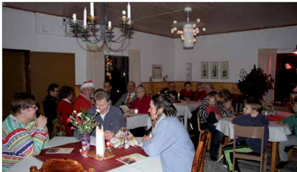
Kyläläisiä oli kokoontunut viettämään mukavaa puurojuhlaa joululaulujen merkeissä.