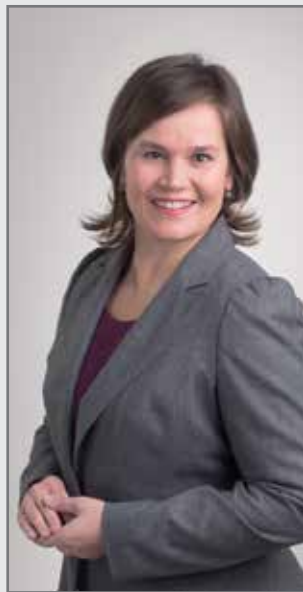
Mirja Vehkaperä kansanedustaja

Yksi asia on syytä muistaa. Suomessa metsiä ei kasvateta tai päätehdä vain energiaksi. Suomessa on pitkät perinteet laadukkaasta metsänhoidosta ja metsämme kasvavat suurella vauhdilla. Vaikka hakkuumäärät ovat nousseet, hiilinielut