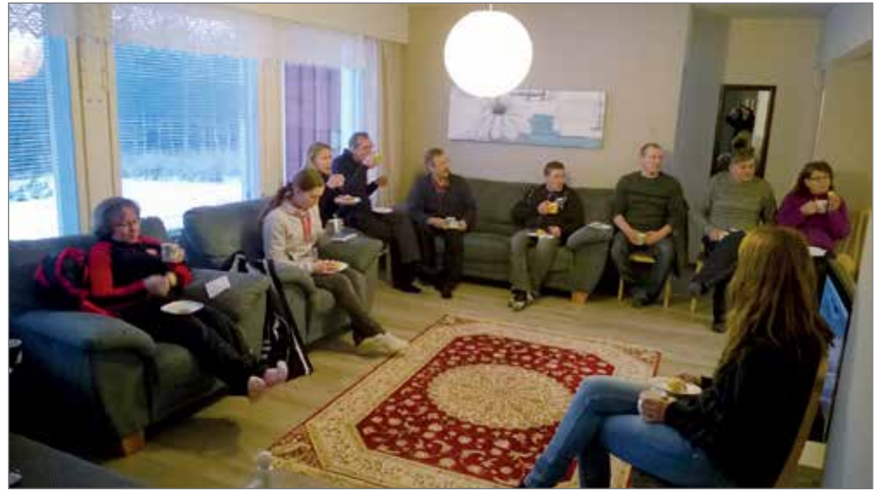
Retkeläiset olivat tyytyväisiä tilan isännän asiantuntevaan ja avoimeen esittelyyn. Myös Pudasjärven väki oli perehtynyt asiaan jo etukäteen ja keskustelu oli vilkasta.