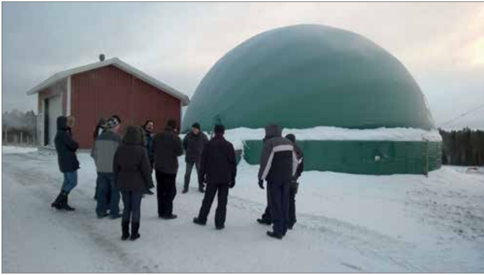
Biokaasureaktori on rakennettu vanhaan 500 kuution lietesäiliöön joka on ulkoapäin eristetty. Biokaasun lähteenä eli syötteenä on lietelanta, ylivuotiset rehupaalit ja nurmimassa.