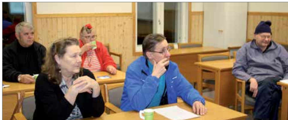
Syyskokousväkeä mieteliässä tunnelmissa.