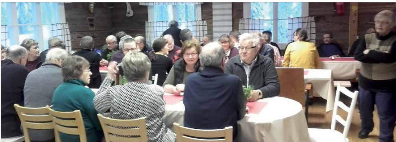
Pirtissä oli lähes sata vierasta.

Emännille - runsaat kiitokset - perinteinen maistuva käristysresepti oli saatu säilytettyä toiminnassa - vaikka tekijät olivat osittain uudistuneet. Näin hyvät perinteet säilyy ja siirtyy nuoremmille. JS/OK