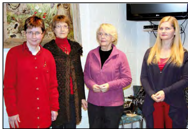
Suomen voimisteluliiton harrastusmerkkien saajat.