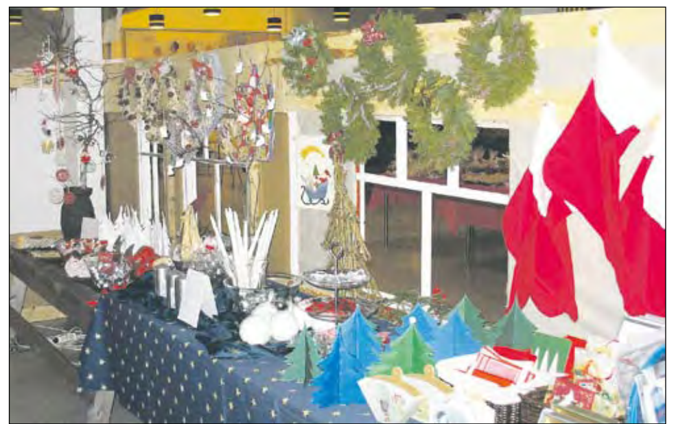
Joka vuosi yritetty saada jotain uutta. Tänä vuonna laitettiin joulupuoti.