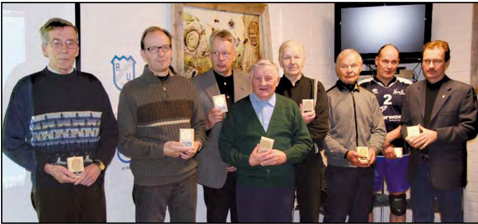
Paikalla olleet kultaisen ansiomerkin saajat