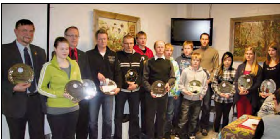
Vuoden valintojen henkilöt olivat lähes 100 prosenttisesti paikalla.