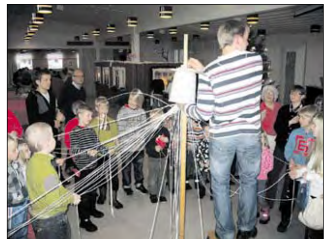
Narun veto "narutus" ja arvonnat ovat myös myyjäisten suosiossa.

Myyjäisiä edeltävällä viikolla oli talkooväellä runsaasti puuhaa, kun myyjäistuotteita valmistettiin niin yhdistyksellä kuin kodeissaan. (ht)