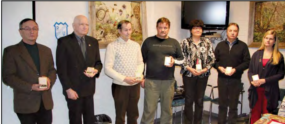
Hopeisen ansiomerkin saajat