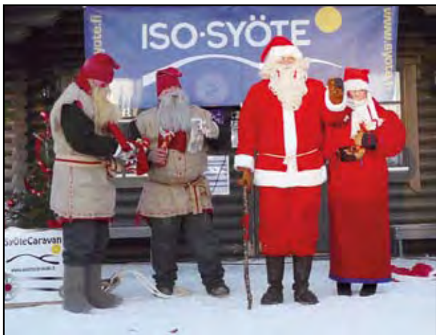
Pärjän Caravaanarit oli kolmas pudasjärvinen joukkue. Heillä oli pukkiperhe, jossa oli pukin lisäksi muori ja kaksi tonttua. He eivät päässeet kolmen parhaan joukkoon, vaikka antoivat lahjojakin tuomareille. Joukkue oli myös lasten suosiossa.