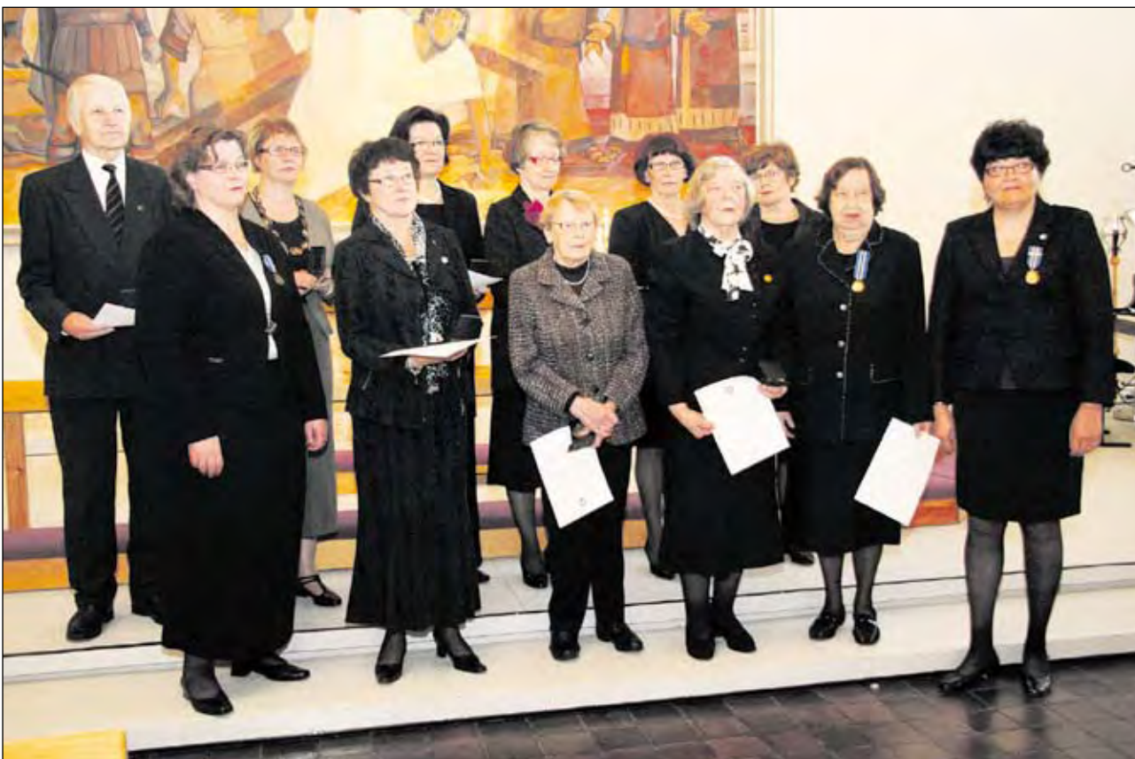
Juhlassa ansiomitaleita ja plaketteilla muistettujen yhteisessä kuvassa.

vaikutuksella. Itsenäisyyden juhlaaunille kutsuttiin 70-luvulta lähtien vapausotureita, veteraaneja ja eri maanpuolustusjärjestöjen edustajia ja tämä käytäntö jatkuu edelleen.