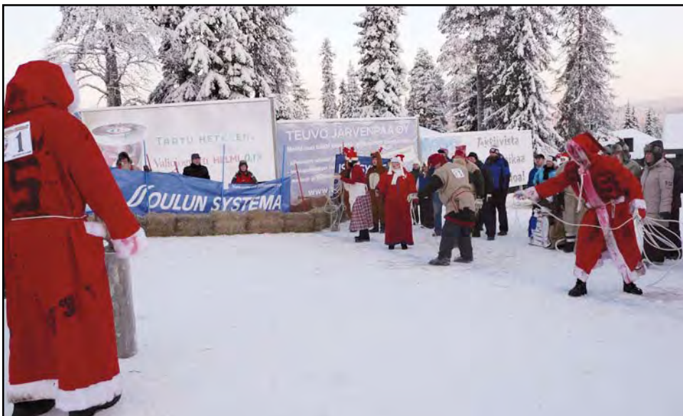
Suopungin heitto oli yksi joulupukkikisan kilpailulaji.