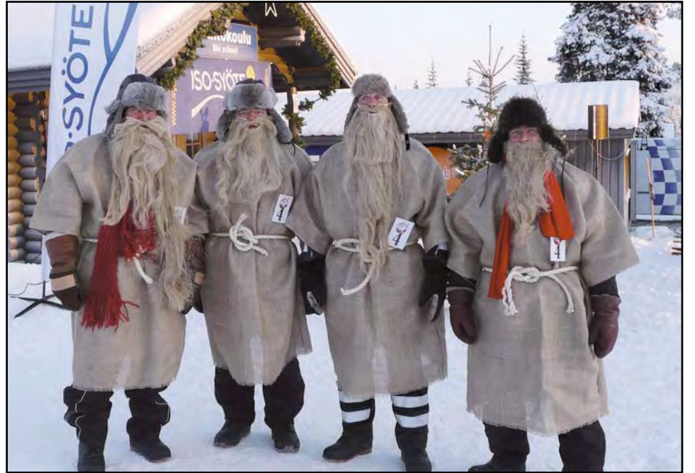
Team Safarihouse oli Pudasjärvinen joukkue, jonka perinteisiä joulupukin asuja kiiteltiin kisan parhaimmiksi.