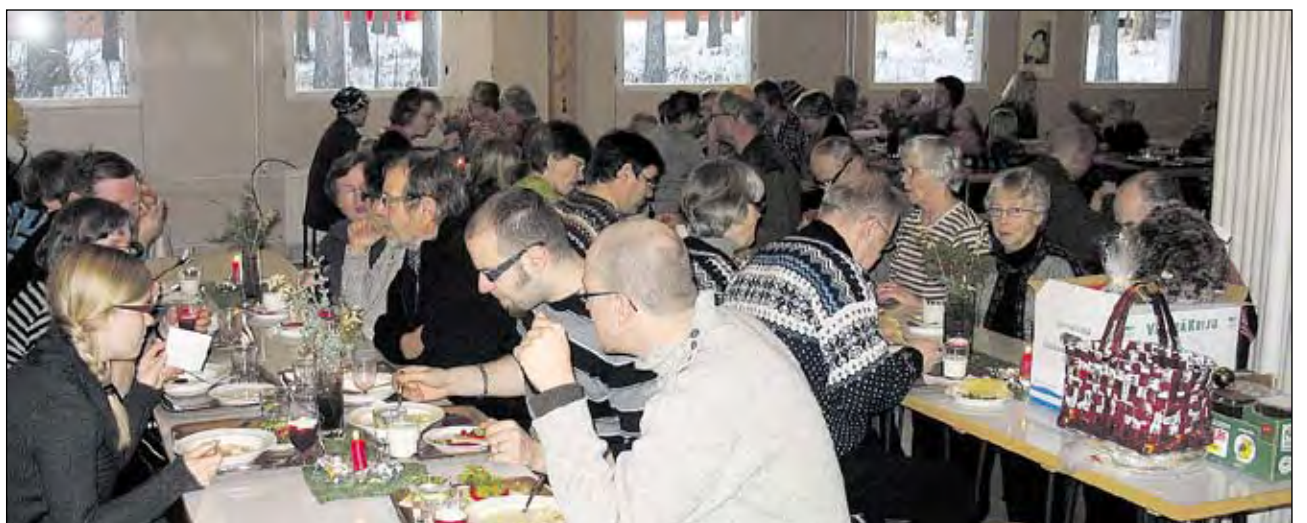
Myyjäisvieraat Lapinukon keittoaerialla.