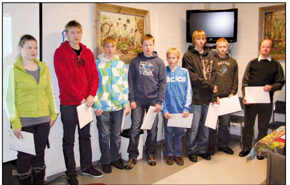
Urheilustipendeillä seura kannusti eri lajien lahjakkaita ja menestyneitä urheilijoita