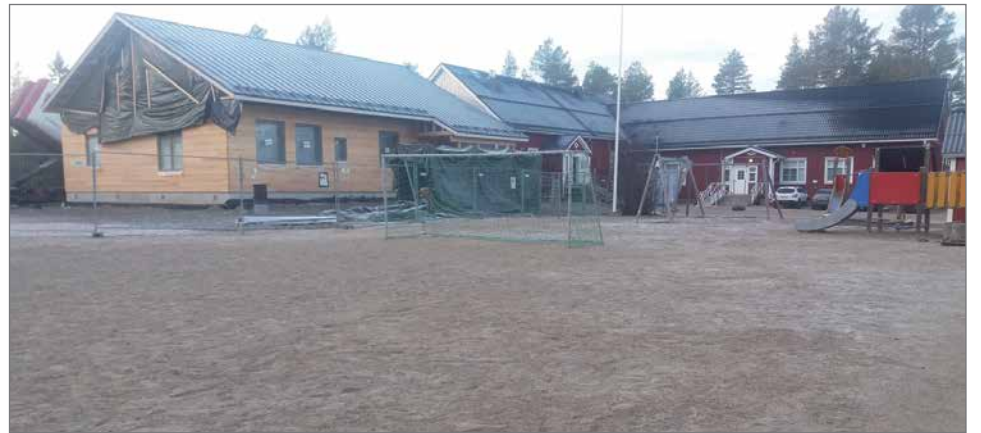
Läntisen Pudasjärven alueella asukkaiden määrä on kasvussa. Tämä näkyy myös Kipinän kyläkoululla, jonne kaupunki tekee laajennus investointia.

Urheilukenttä on tärkeä välitunti- ja koululiikunnan harrastusalue. Sitä voidaan käyttää myös kyläläisten liikuntapaikkana, mikäli se on asianmukaisessa kunnossa. Nykyisellään urheilukenttä ei pehmeästä pohjastaan johtuen ole turvallinen käyttäjilleen. Lisäksi urheilukentällä ei ole esimerkiksi