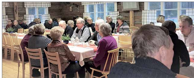
Tasainen puheen sorina kuului pöydistä - kerrottiin kuulumisia ja odotettiin tilaisuuden avausta.