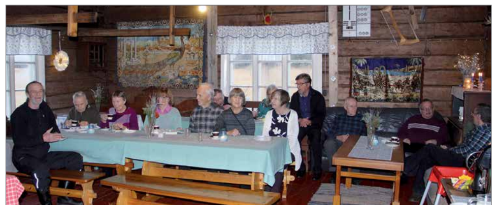
Ala-Livon Metsästysseuran kutumalle välle maistui hirvikäristys sekä monipuolinen muu ruoka- ja kahvitarjoilu.