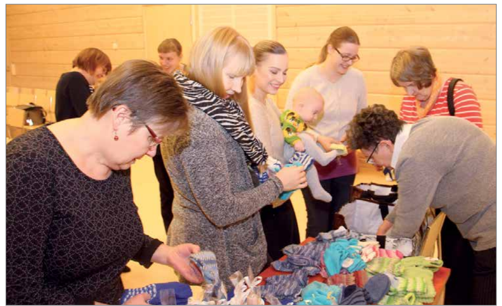
Pudasjärven Maa- ja Kotitalousnaisten kutomat vauvasukat ja lapaset löysivät omistajansa.