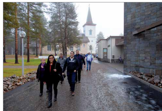
Valtuustoseminaarimatkalle osallistui lähes kaikki valtuutetut ja kolme varavaltuutettua.