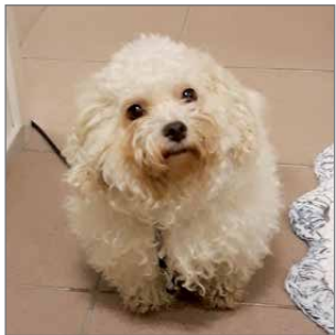
Jade on 5-vuotias terapia-koira, rodultaan bolognes.