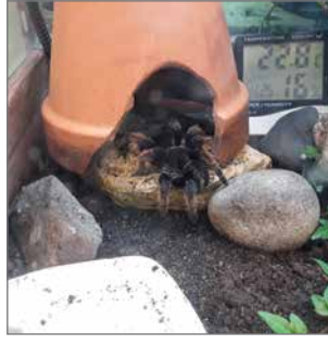
Muhoksen eläintenhoitajien opiskelukohde Tarantella.