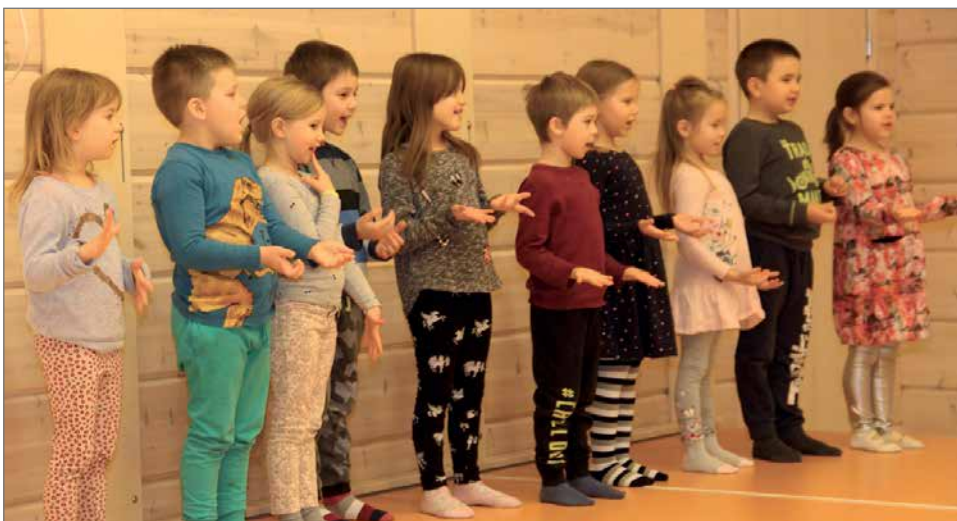
Päiväkodin Helmipöllö eskariryhmä esitti laulu- ja leikkiohjelman.

Tilaisuuden kunniaksi kuultiin myös päiväkodin Helmipöllö eskariryhmän laulu- ja leikkiesityksiä sekä kaikille tarjottiin pulla- ja pi-parikahvit. HT