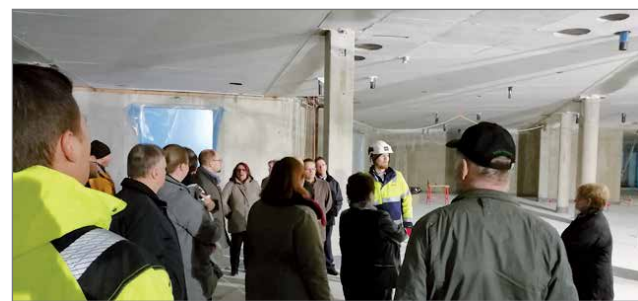
Sodankylän hyvinvointikeskus on osittain kaksikerroksinen. Rakennukseen ei tule yhtään muovimattoa.