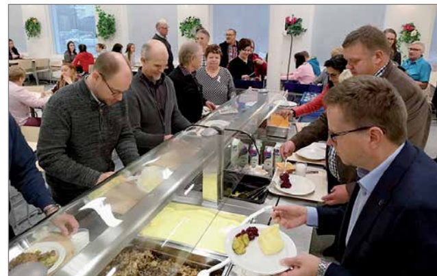
Valtuutetuille tarjottiin kouluruokaa eli naurisnautakäristystä, oikeista potuista tehtyä muusia sekä naurisnautamakkaraa.