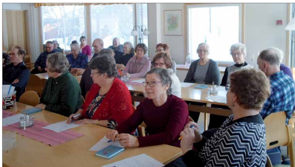
Eläkeliiton kerhot kokoontuvat säännöllisesti.

malla viranomaistahot ovat heikentäneet omaa asiakaspalveluaan merkittävästi. Esimerkiksi Kela hoitaa Suomessa asuvien perusturva-eri elämän tilanteissa. Useiden muidenkin viranomaistahojen tapaan, toimipisteverkostoa on karsittu viime vuosina merkittävästi ja ihmiset ohjataan yhä useammin hoitamaan asioita verkossa tai puhelimitse. Digitalisaation myötä viranomaisten yhteystietoja