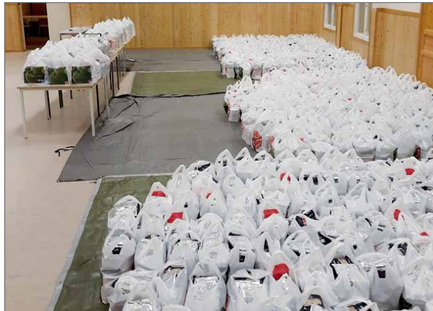
EU-ruoka oli pakattu 704 muovikassiin.

Paketeissa oli mm. vehnäjuuhoja, hapankorppua, maitojauhetta, sian- ja naudanlihaa, hernekeittoa, puurohiutaleita, myslää ja pastaa, sekä uutena tuotteena tum-