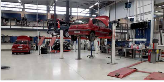
Ajoneuvoasentajatutkinnon opiskeluympäristöä Muhoksen OSAOlla.