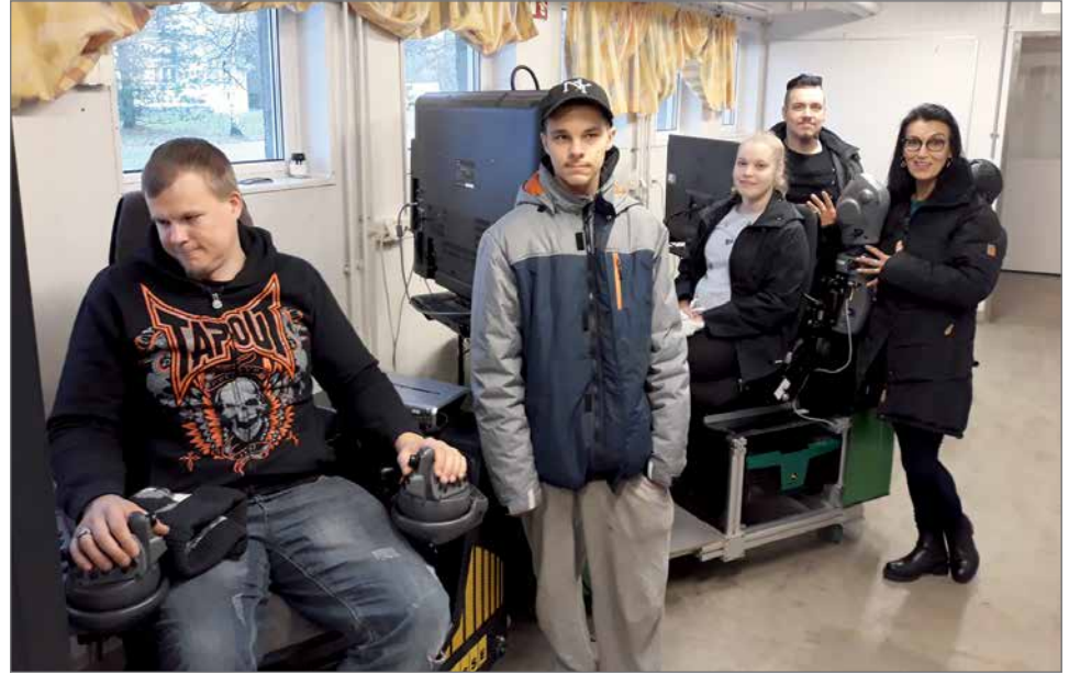
Muhoksen OSAOLLA tutustuttiin maansiirtokoneiden simulaattoreihin.

Ensi kevään yhteishaku koulutuspaikkoihin lähestyy kiitävää vauhtia. Jatkuva opiskeluun haku-, oppisopimuskoulutus- ja koulutus-sopimusmenetelmät ovat nykyään mahdollisia koko vuoden ajan. Tietoja edellä mainituista saa oppilaitoksesta, TE-toimistosta ja useilta muilta tahoilta, joiden toiminta suuntautuu nuorten, aikuistenkin, opintoihin hakemisessa. Karhupajan yksilövalmennus on yksi tällainen neuvova ja auttava