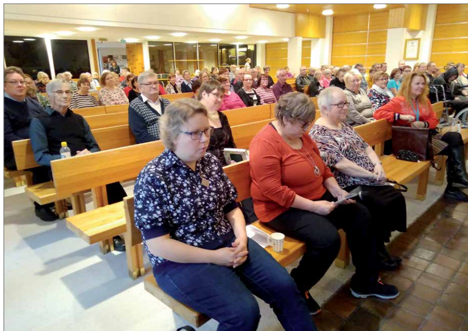
Tilaisuudessa oli mukana kaikkiaan 130 henkilöä. Esiintyjäkaartia edessä.