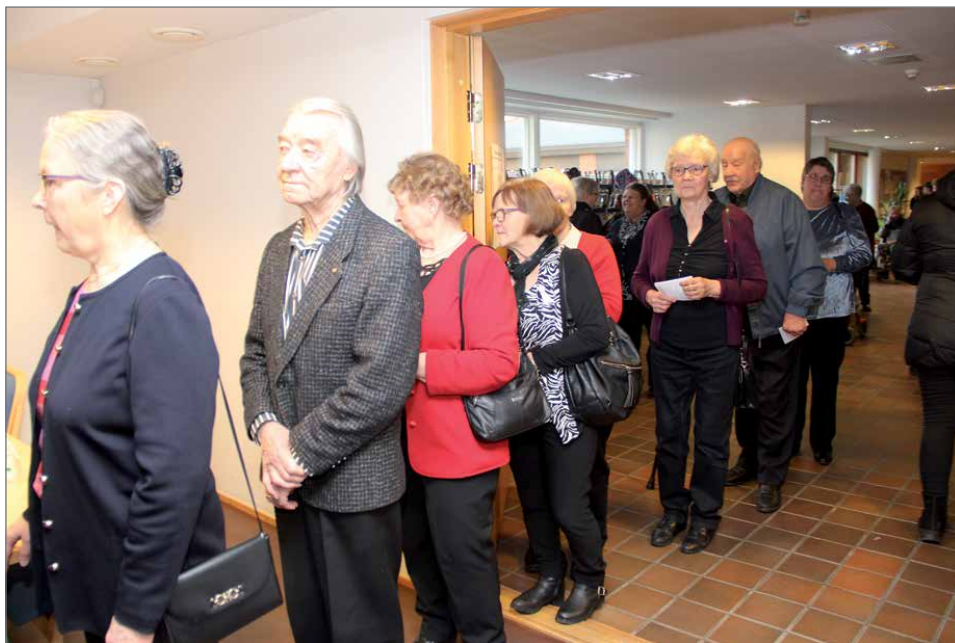
Varsinaisena vaalipäivänä äänestäminen alkoi heti sunnuntai-iltaa jälkeen ja aluksi oli myös jonoa.