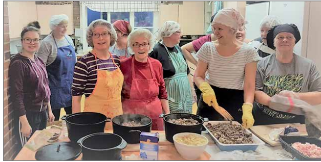
Valman johdolla emännät valmistivat lauantain tarjoilut valmiiksi hautumaan.

Peijaisten jälkeen suoritti metsästysporukka "tasaulihojen jaon" ja katsottiin tämän vuoden metsästys onnistuneesti päättyneeksi. Metsästyseura kiittää peijaississa mukana olleita. Teitte päivästä onnistuneen! O.K./J.S