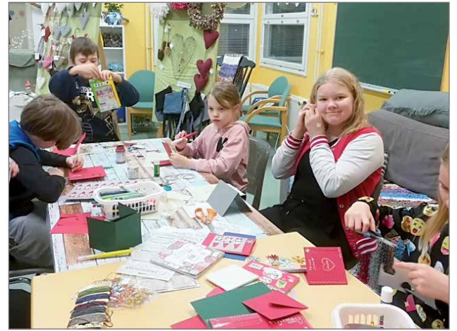
Reddie Kids on Suomen Punaisen Ristin varhaisnuorten kerho, joka on suunnattu 7-12-vuotiaille.