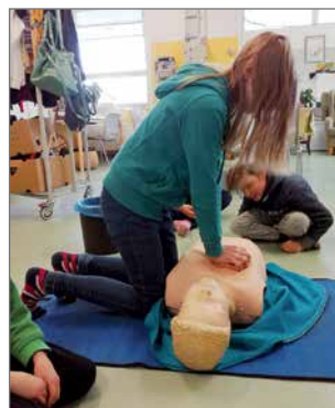
Ensiaputaidot ovat tärkeä osa Punaisen Ristin toimintaa, joten niitä harjoitellaan kerhossa ahkerasti

Reddie Kids on Suomen Punaisen Ristin varhaisnuorten kerho, joka on suunnattu 7-12-vuotiaille. Kerhon teemoja ovat käytännöllisten perus ensiaputaitojen ja turvallisuuden lisäksi muun muassa ystävyyden, pakolaisuuden, suvaitsevaisuuden sekä vieraiden kulttuureiden ymmärtäminen ja arvostaminen. Kerho tarjoaa varhaisnuorelle loistavan mahdollisuuden tutustua Punaiseen Ristin toimintaan ja periaatteisiin. Tarjolla on lisäksi tietysti paljon hauskanpitoa ja uusia kavereita.