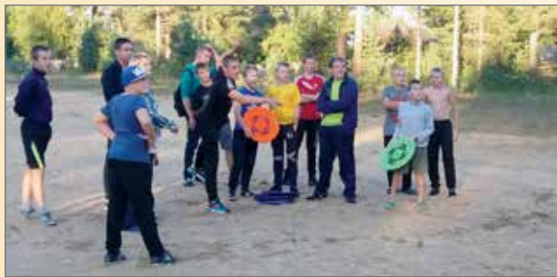
Nuorisojoukko oli innostunut leiripäivästä. Frisbeen heitto oli kai uutta ja ihmeellistä.