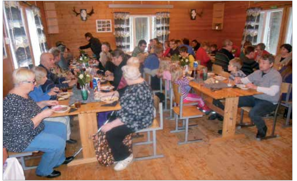
Maistuvan ruoan äärellä tuvan täydeltä peijaisvieraita.

Ja huutokaupassa huudettiin hirvenlihaa, hyvin vakuumiin pakattua. Siinä