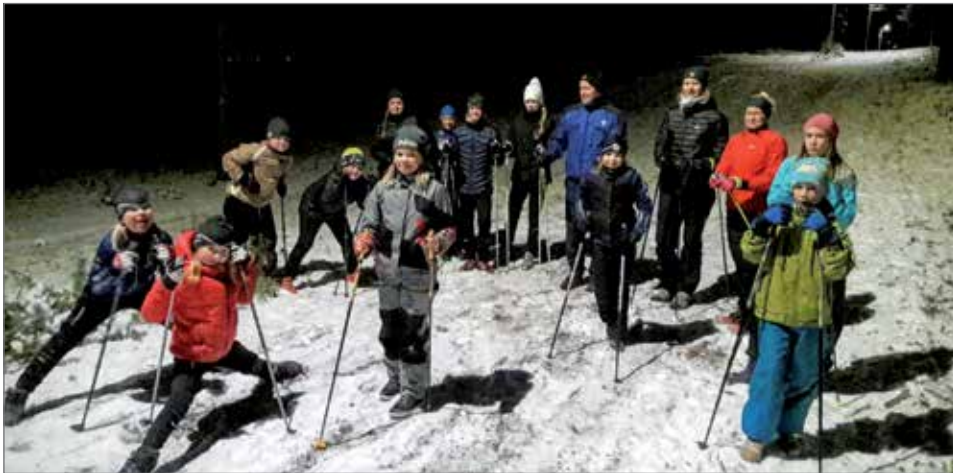
3-9-luokkalaisten aloituskokoonpano Jyrkkäkoskelta.

Seuraavaksi olikin jo vuorossa päivän kestävä hiihtoleiri lauantaina 19.11. Taivalkosken Taivalvaaralla. Siellä oli kahden kilometrin latu saatu erinomaiseen kuntoon jo lokakuun alkupuolella edellisenä talvena säilyttäen tykkilunta käyttäen. Hiihtokoululaiset harjoittelivat aamupäivällä luisteluhiihdon tekniikoita Tomin, Antin ja Merjan opastuksella. Harjoituksen jälkeen nautittiin monitoimitalolla Metsä-Veikoilta tilattu maittava keittolounas. Iltapäivällä sitten luotiin peruskuntaa hiihtämällä vapaaseen tahtiin. Lopuksi vielä laitettiin pystyyn leikkimieliset sprintiviestit, jotta saataisiin lihaksisto oikein kunnolla heräteltyä. Harmaasta ja välillä sateisestakin säästä huolimatta saimme hiihtokoulun vietyä läpi varsin mallikkaasti ja niin hiihtokoulun oppilaat, huoltajat kuin ve-