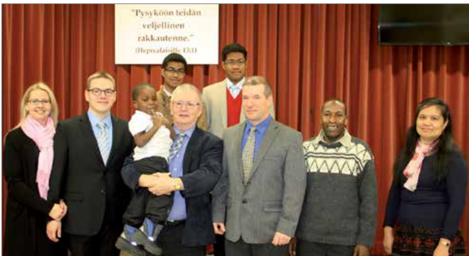
Pudasjärven Jehovan todistajien seurakunta-aktiiveja avoimien ovien päivänä valtakunnansalin etuosassa.

rasta. Viime kesänä tehtiin rakennuksessa perusermontti. Englannin kielen salia suurennettiin, uusittiin ilmastointi, valaistus, päätylauditus ja katto. Lisäksi parannettiin sähköistystä ja äänentoistoa. Erikoisuutena