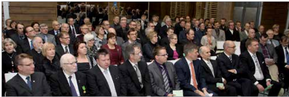
MHY:n 80-vuotisjuhlaan osallistui Hirsikampuksella reilut 150 henkeä.