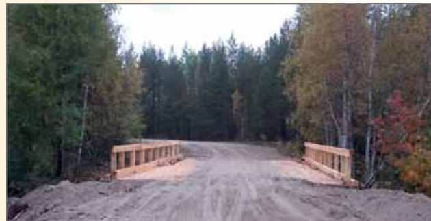
Borovoin uusi silta palvelee taas kyläläisiä ja turistejakin.