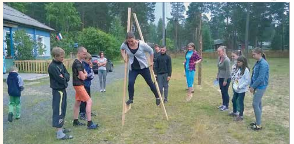
Puujaloilla on kuulemma ennen kävelty paljonkin, mutta nykylapsien leikkivalikoimasta se puuttuu. Toivotaan uutta intoa tähän harrastukseen.