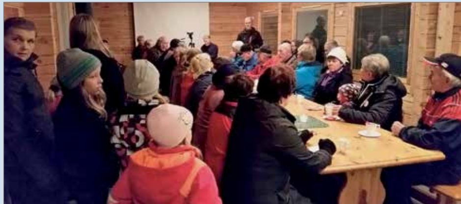
Osallistujilla oli päällimmäisenä tunteena helpotus ja luottamus tulevaisuuteen.