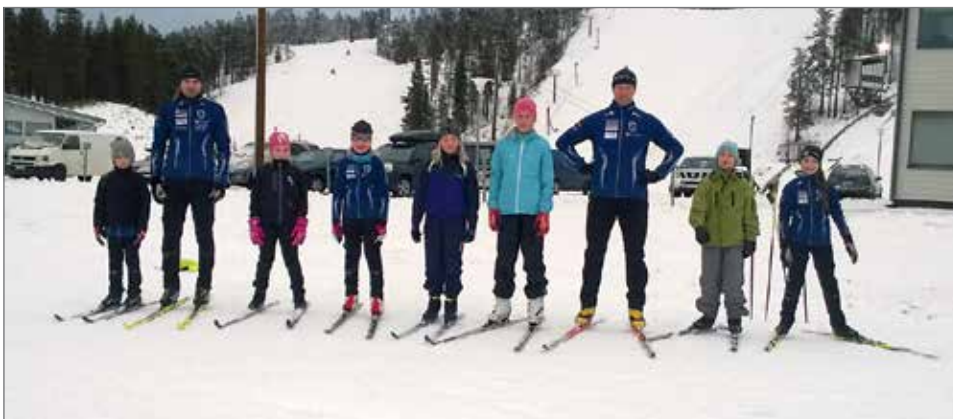
Taivalvaaralla oli hyvät ladut ja hiihtokeli.

täjätkin saimme lähteä ajelemaan tyytyväisin mielin kohti Pudasjärveä. Harmillista hiihtoleiripäivässä oli ainoastaan se, että moni leirille ilmoittautunut joutui perumaan osallistumisensa flunssan vuoksi.