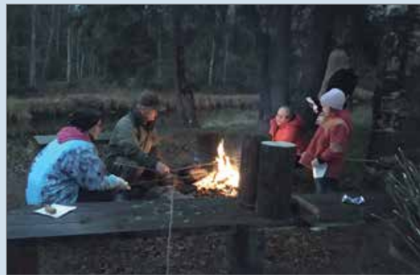
Illan hämärtyessä tunnelmaa loivat nuotiot, kynttilät ja roihut.