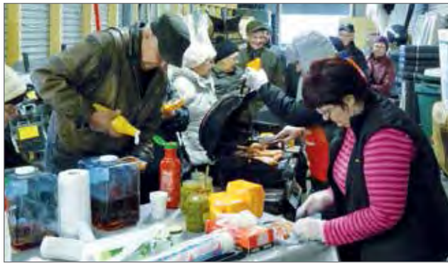
Perhemarketin joulunavauspäivänä suolaista ja suun makeaa kaipaavia asiakkaita oli jonoksi asti.

-Pihalla olleen kuorma-auton talous- ja wc-paperilastistakin oli myyty jo puolet parin ensimmäisen tunnin kuluessa. Päivän aktiivisiin ohjelmanumeroihin kuului mahdollisuus koeajaa tieliikennekäyttöön soveltuvilla traktorimönkijöillä ja tutustua työnäytöksenä myös halontekokoneeseen. Se että taajaman kahdessa yrityksessä järjestettiin samana päivänä teemapäivät, näytti se saaneen väen hyvin liikkeelle, totesi Heikkinen mielissään. PK