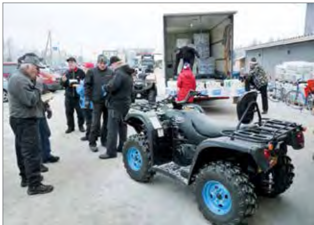
Päivän vilkkautta osoitti sekin, että kuorma-auton talous- ja wc-paperilastista oli myyty jo puolet parin ensimmäisen tunnin kuluessa.