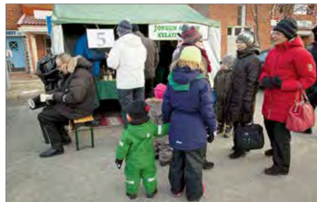
Jongun kojulla tarjottiin lohirullaa ja omenaglögiä.