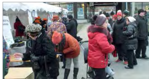
Voittaja ratkaistiin yleisöäänestyksen perusteella ja äänestyspisteessä olikin koko ajan vilkasta.