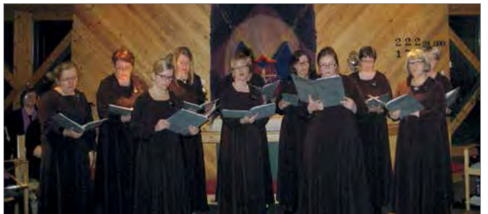
Vox Margarita -kuoro esiintymässä Sarakylän kappelissa.