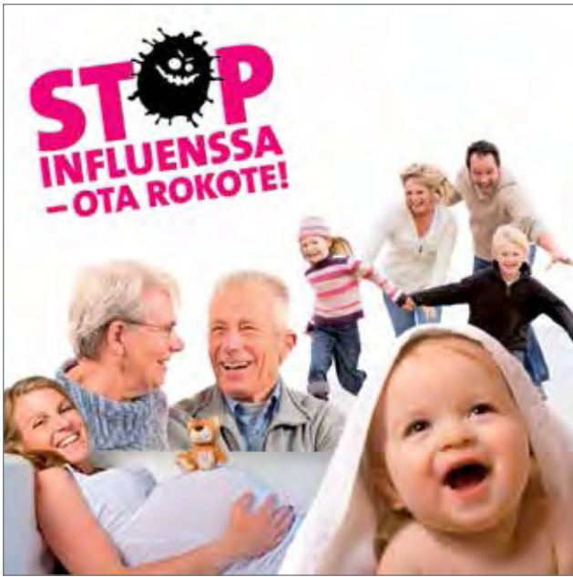
Suojaa itseäsi ja läheisiäsi influenssalta.

Influenssarokotteen saavat maksutta ne, joiden terveydelle influenssa aiheuttaa oleellisen uhan tai joiden terveydelle influenssarokotuksesta on merkittävää hyötyä. Rokote on maksuton muun muassa raskaana oleville naisille, 65 vuotta täyttäneille ja 6–35 kuukauden ikäisille lapsille. Maksuttomaan väestöryhmään kuuluvat myös sairautensa tai hoitonsa vuoksi riskiryhmiin kuuluvat, vakavalle influenssalle alttiiden henkilöiden lähipiiri sekä varusmiespalvelukseen astuvat miehet ja vapaaehtoiseen asepalvelukseen astuvat naiset. Näihin kuuluvat myös Sosiaali- ja terveydenhuollon sekä lääkehuollon henkilöstö, jotka osallistuvat potilaiden tai asiakkaiden hoitoon ja huoltoon. Lisätietoja aiheesta: www.kausi-influenssa.fi PK