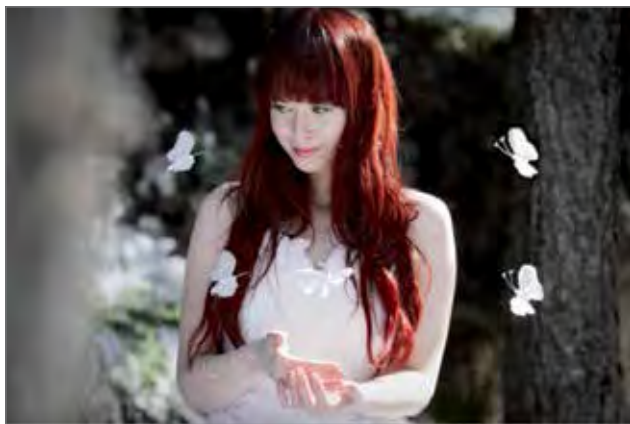
Laulaja Johanna Kurkelan koko maan kattava joulukonserttikiertue ulottuu myös Pudasjärvelle.

- Rakastan taikatalvia, revontulia ja pakkasta, lumen narskuntaa kenkien alla. Minulle joulunaika on kuin turvaise kodinlämpö ja rauha kaiken kylmän keskellä. Minun jouluni saapuu yhdessä ensilumen kanssa ja kestää aina aaton aluspäiville saakka. Se on täynnä onnea