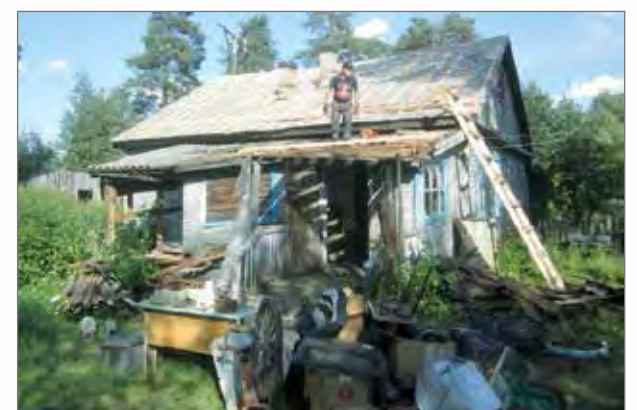
Katto korjattuna ja remontinkin loppusuoralla.