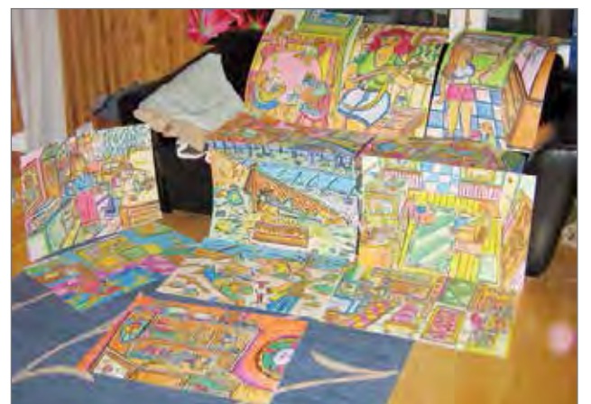
Kuvan piirroksissa on tekijän Turo Granlundin mukaan nähtävillä yltäkyläistä naivistista värisloistoa.

-En ole saanut minkäänlaista oikeaa taideoppia, vaan oman innokkuuden ja luomisvimman seurauksena on tullut tehtyä monenlaisia taidejuttuja. Näyttelyyni sain idean viime jouluna, kun mietin, miten saisin sarjakuviani enemmän esille. Silloin aloin tekemään pastellipiirustuksia, joita syntyikin runsaasti. Nykyiseen näyttelyyn valitsin 20 vähiten huonoa työtä. Keväällä väkertelin puusta erilaisia miniatyyrikoristeita alun perin omaan kirjahyllyyn, mutta kelpuutin lopulta nekin näyttelyrek-