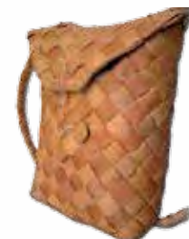
Valja mummon peukut.