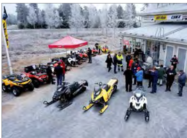
mista ensi viikon lehdessä. Moilanen pienoishelikopterin avulla. HT, kuva yläilmoista Jari