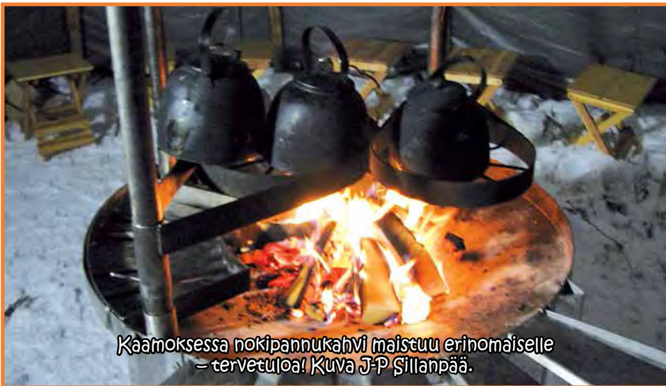
Kaamoksesta nokipannukahvi maistuu erinomaiselle - tervetuloa!