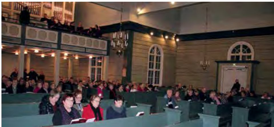
Kirkkomusiikkiviikon päätöskonsertin yleisöä Pudasjärven kirkossa.

Tärkeähän on, että musiikkitarjontaa myös kohtaa kuulijansa. Siihen voi olla nyt tyytyväinen.