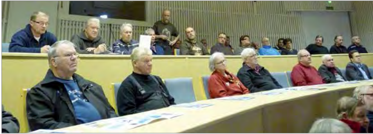
Kollaja-hankkeen keskustelutilaisuus kokosi Pohjantähteen reilu 50 kuulijaa.

kaisen tekoaltaan ja yhden voimalaitoksen rakentamisen. Hankkeen toteutuksen ja rakentamisen esteenä on kuitenkin vapaita virtavesiä suojeleva koskiensuojelulaki, jota altaan rakentamista kannattavien mielestä tulisi muuttaa. Rakentamista vastustaville jää Kollaja-hankkeen ympäristövaikutusten arviointiselvityksen valmistuttua enää mahdollisuus yrittää vaikuttaa kansanedustajiin. Viime kädessä Kollaja-hankkeesta päätetään eduskunnassa. Pudasjärven kaupunginhallituksen ja -valtuuston on määrä myös ottaa asiaan kantaa ensivuoden alkupuolella. PK