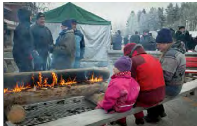
Rakovalkealla oli mukava lämmitellä.