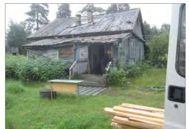
Valjan katto ennen korjaamista.