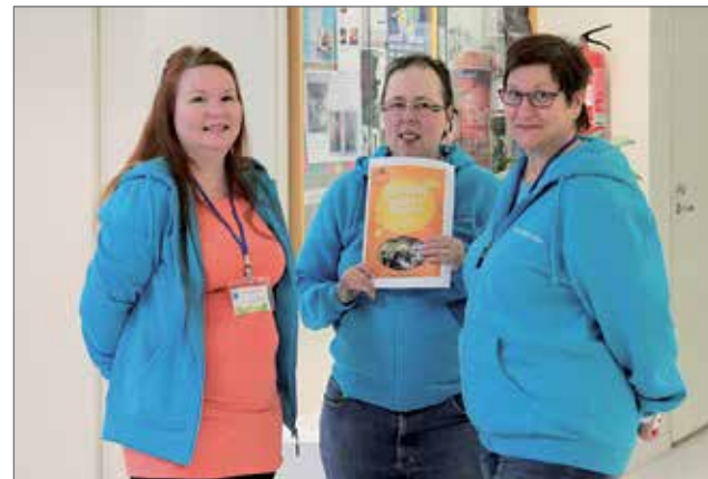
Iloinen Viesti -lehden toimituksen väkeä ja ohjaaja messuilla.

tamalla kautta kehitysvammaisten asiakkaiden osallisuutta heitä koskevien palvelujen osalta on pystytty parantamaan ja asiakkaille on voitu tuottaa heidän hyvinvointiaan ja arjen mielekkyyttä tukevia palveluja.