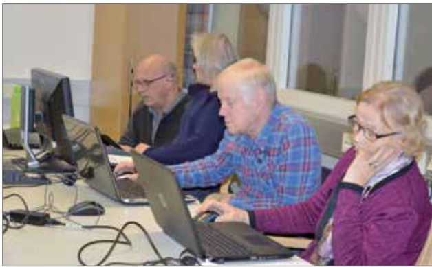
Treffipäiviltä saivat kaikki uutta tietoa; niin aloittelijat kuin aiemminkin nettiä käyttäneet.

Jokilaaksojen alueella kouluttajana toimii Ipo Kä-