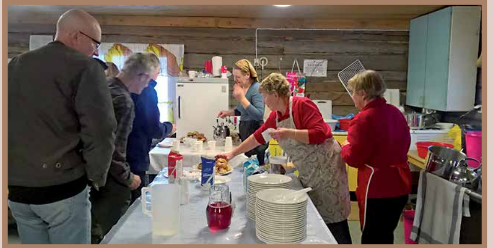
Emännät olivat valmistaneet herkullista hirvenlihakeittoa.

Isänpäivä valkeni pilvisenä. Lunta oli satanut puiden oksille. Maisema oli kaunis. Kun ajelimme Hetekyläntietä kohti Viinikosken erän metsästysseuran majaa.