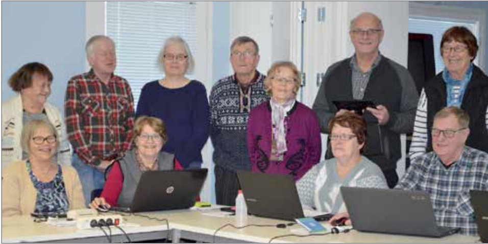
Pudasjärven Nettitreffien runsas osallistujamäärä yllätti järjestäjät. Uusi kurssi järjestetään tammikuussa, jonne pääsevät nyt rannalle jääneet.