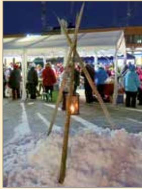
Joulutori ja joulunavaus täyttävät torin ensi perjantaina.