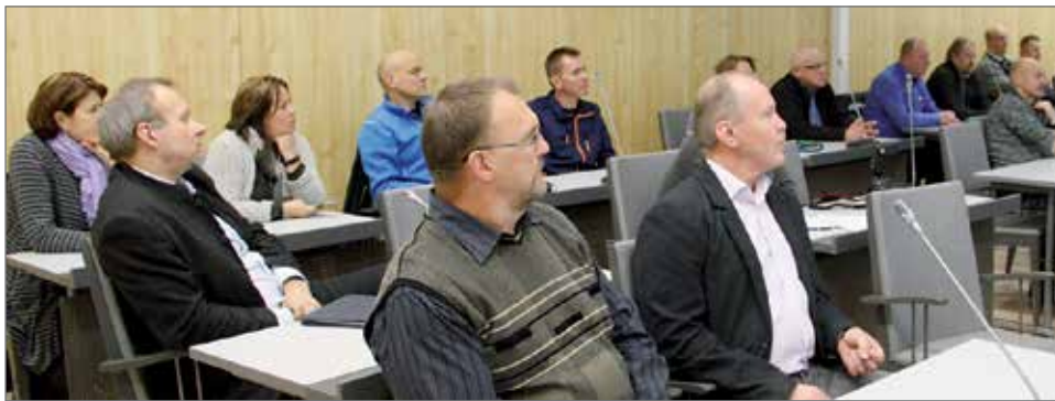
Iltaan osallistui kolmisenkymmentä henkeä.