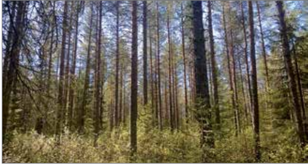
Ravinnetasapainon ollessa kunnossa puu kasvaa hyvin näilläkin korkeuksilla.