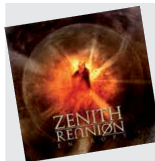
Vahvat Pudasjärveläisjuuret omaava ja oululaistunut Zenith Reunion -yhtye on solminut