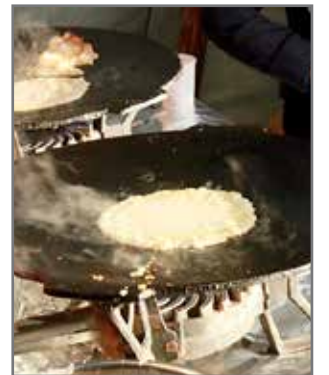
Matkailupuolen oppilaiden muurinpohjaita näyttävät hyviltä jo tekovaiheessa.