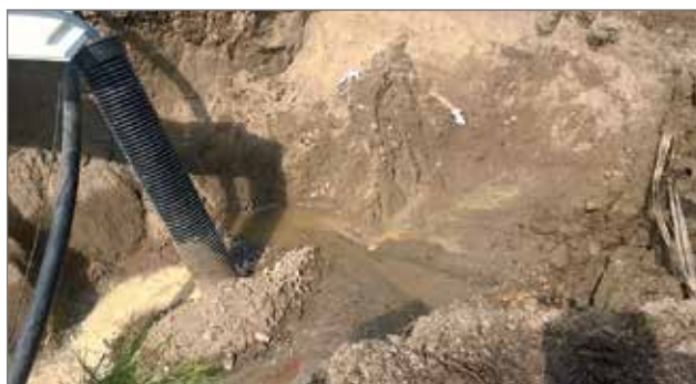
Väliaikaisia vedenpumppaamoja jouduttiin rakentamaan työmaan aikana useita.