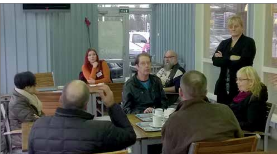
Ajankohtaiset poliittiset aiheet lämmittivät keskustelijoita kahvikupposen äärellä.

- On vaarana, että urakat menevät muille kuin Pudasjärvisille yrityksille koska Pudasjärveltä ei löydy suurta määrää Kollajan rakentamiseen tarvittavia ko-