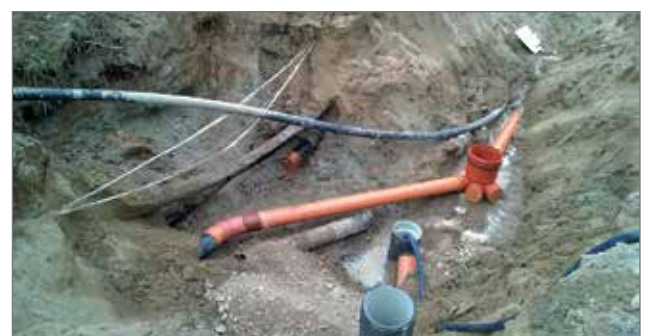
Uutta ja vanhaa rakennetta.

-Kärsivällisyys palkitaan ensi kesänä, kun alue valmistuu. Lopputulokset tulevat varmasti olemaan asukkaiden mieleen. Koko koulukampusalueesta uusine katuineen ja pyöriteineen tulee koko Pudasjärven käyntikortti, Ylitalo lupaa. RE