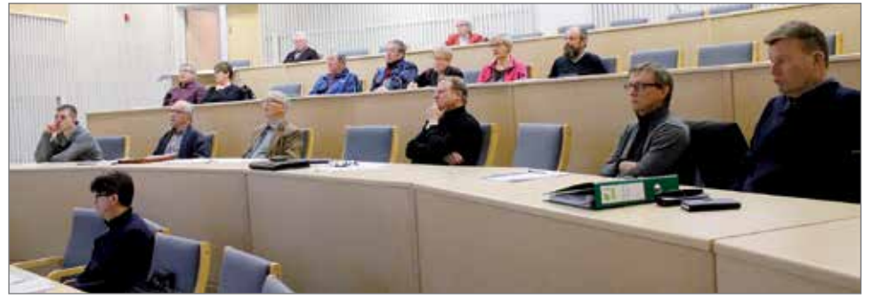
Yhteismetsäsopimuksen allekirjoitustilaisuuteen oli saapunut noin parikymmentä metsänomistajaa. Suuri osa allekirjoituksista tapahtui valtakirjalla.

Pudasjärvellä löytyy jo kymmenen vanhemman yhteismetsän alueita, joiden yh-