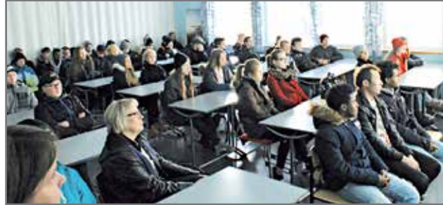
Rimminkankaan yläkoululaiset kuuntelevat tarkkaavaisesti matkailupuolen esitystä.

OSAO:n Pudasjärven yksikön ammattiopistossa Jyrkkökoskella vietettiin kiireisiä päiviä 4.-5.11., kun sadat yhdeksänluokkalaisten ja aikuiskoulutukseen hakevat