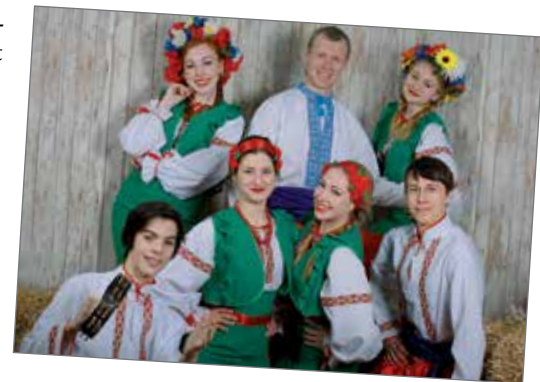
Ukrainalainen lauluyhtye Koljada esiintyy Pudasjärvellä ensi viikon perjantaina.

Yhteessä laulaa seitsemän nuorta laulajaa. Yhtyeen tarkka moniäänisyys,