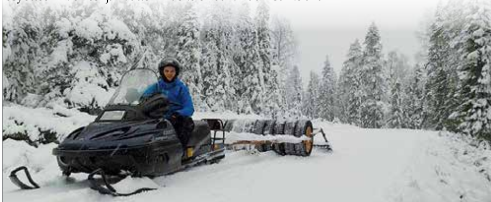
Latupohjien teko on hyvällä mallilla Kelosyötteellä ja Vattukurun reitillä.

on tiedossa, että loppuviikosta hiihtäjiä on tulossa kauempaakin, esimerkiksi Oulun seudulta. Sääennustekin näyttäisi hyvältä lumitilanteen suhteen, sillä lisää pitäisi sataa koko viikonvaihteen ajan. Toivottavasti lumi pysyy maassa jouluun asti. JK