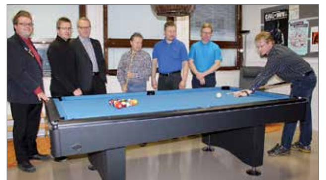
LC Pudasjärven hallitus vieraili kaupungin nuorisotiloissa ja totesi, että kevättalvella tehdyllä lahjoituksella on hankittu nuorten toivoma uusi biljardipöytä.

Nuorisotila on kuntalaisille ikkuna nuorten elämään. Tervetuloa tutustumaan, toimittaa Tarja Väisänen. HT