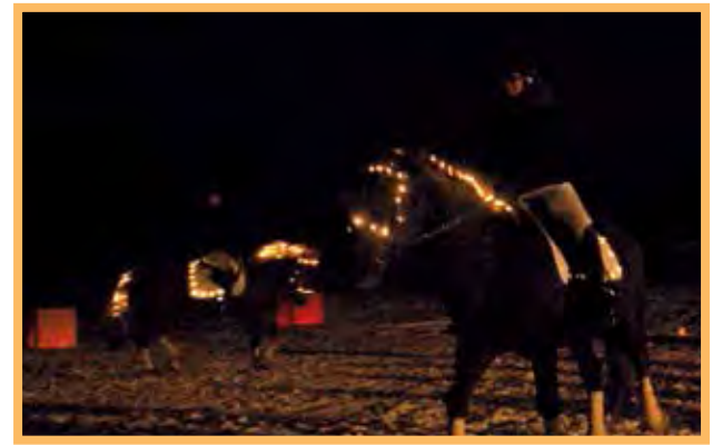
Hevosia valot päällä.

tapahtuman jälkeen, vaan reippaasti hoitivat roudaushommat loppuun asti, aina ilta myöhään ja seuraavaan päivään saakka.