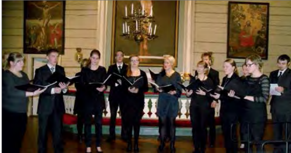
CADENZAN- sekakuoro Isänpäivän iltakonsertissa.