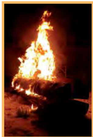
Kunnon rakotulet.

Perinteiset lätyt veivät voiton selvästi ja väkeä koululla riitti alusta loppuun,