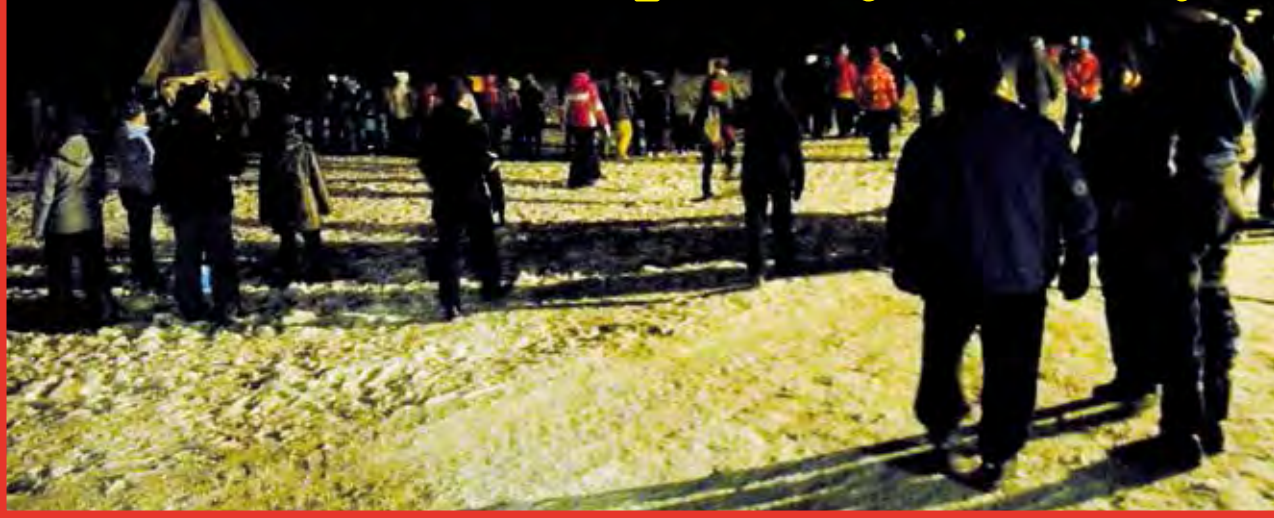
Reilut 200 osallistujaa kaatoi kaamoksen.

Oulun seudun ammattiopiston Pudasjärven yksikössä kaadettiin Kaamos viime torstaina 7.11. Tapahtumaan osallistui reilut 200 henkilöä. Kaamos selätettiin perinteeksi muodostuneessa kaamostapahtumassa jo yhdeksännen kerran, tosin perinteitä rikottiin hieman tänä vuonna.