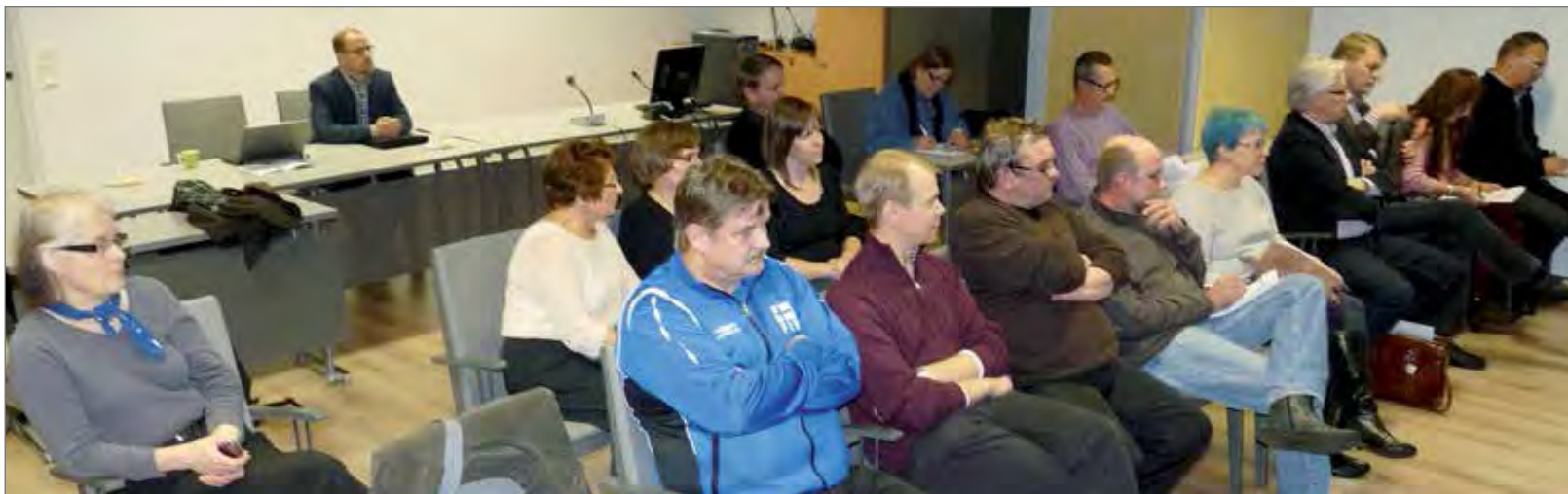
Keskiviikkona 6.11. pidetyn kaupunginvaltuuston kokouksessa oli yleisöä tavallista enemmän.