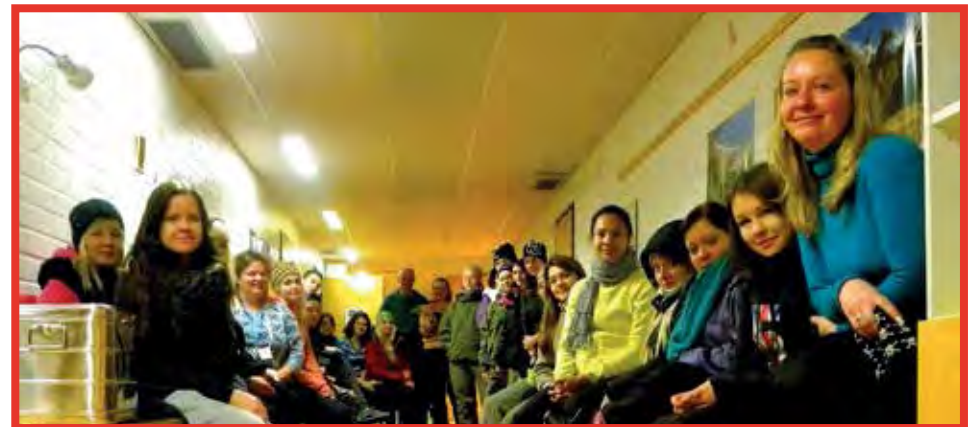
Matkailulinjan oppilaat valmistautumassa Kaamos kaatuu -tapahtumaan.

Järjestelyt aloitettiin jo hyvissä ajoin ja niin uudet, kuin eritoten jo tapahtumassa aiemmin mukana olleet opiskelijat tiesivät kyllä, että tekeminen ei lopu heti itse-