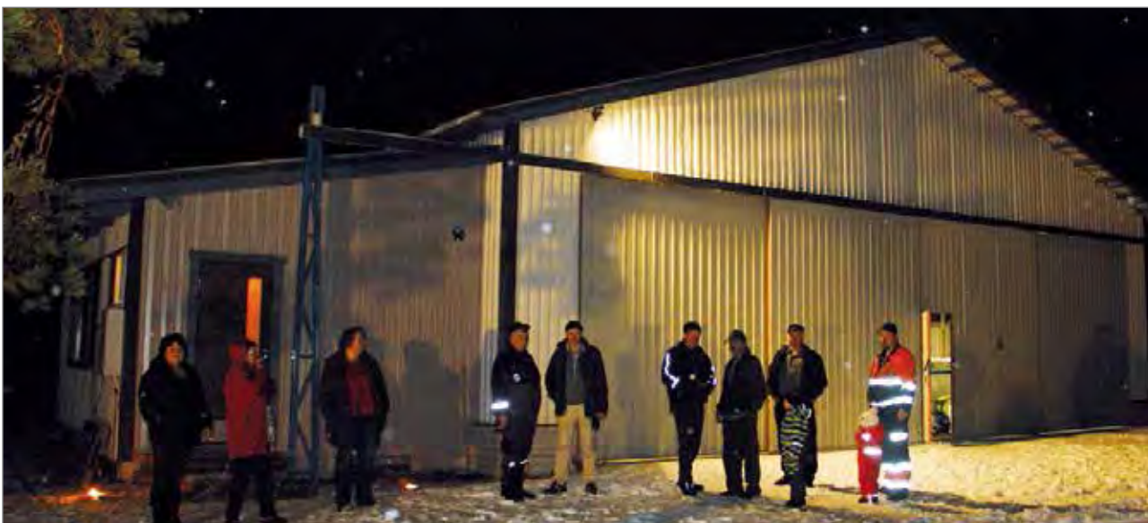
Kerholaisia uuden lentokonehallin edustalla. Kahvio ja kokoontumistila on rakennettu hallin kylkeen vasemmalle.