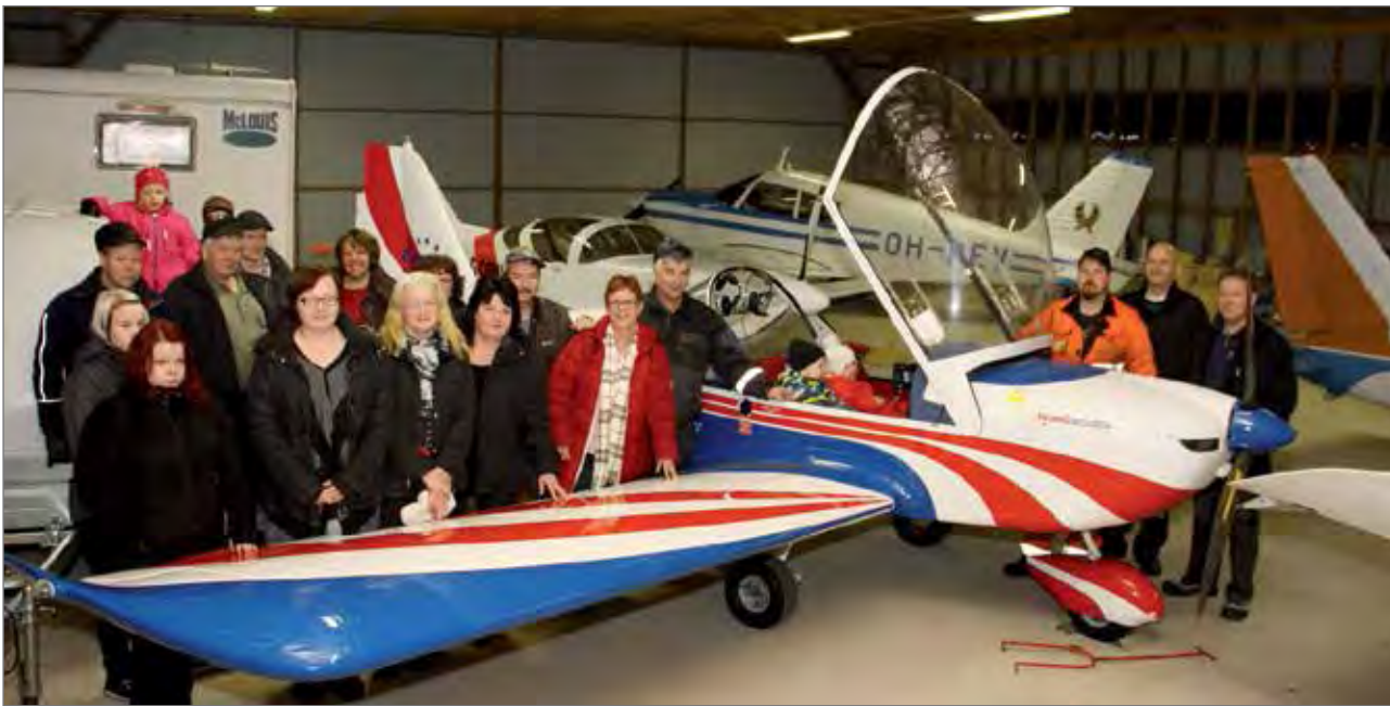
Ilmailukerhon syyskokoukseen ja tupareihin kokoontunut jäsenistö kerhon lentokoneen kanssa kuvassa. 300 neliön hallissa on tällä hetkellä talvisäilytyksessä neljä lentokonetta.