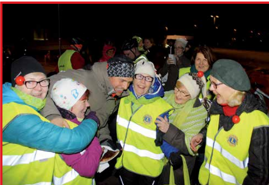
Pudasjärven Lions-Hilimat ottivat vieraan lämpimästi halaten vastaan.