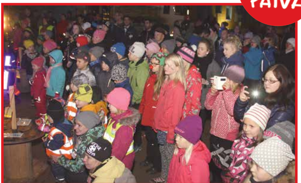
Yleisö eli ohjelman mukana.