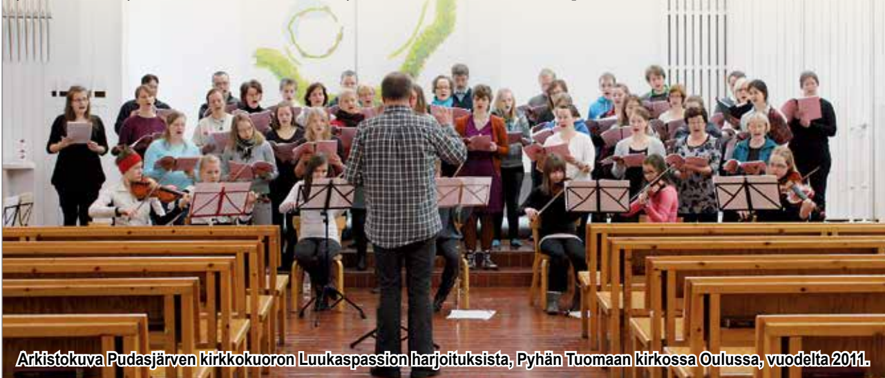
Arkistokuva Pudasjärven kirkkokuoron Luukaspasion harjoituksista, Pyhän Tuoman kirkossa Oulussa, vuodelta 2011.