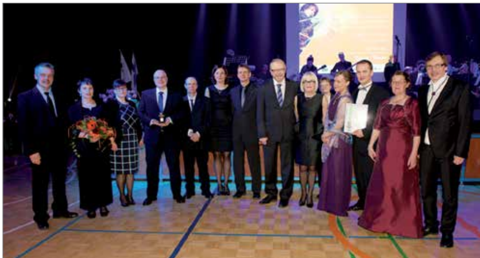
Mukana palkinnon luovuttamisjuhlassa oli Profin Oy:stä 14 hengen ryhmä.