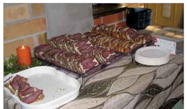
Maukasta lämminsavulihaa oli laitettu leipien päälle.