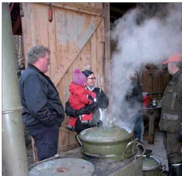
Ulkona hirvisoppa puhisi suuressa kentäkeittimessä.