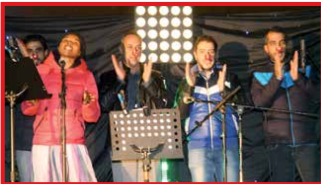
Kongolaislähtöinen Olive lauloi maahanmuuttajien taustakuoron kanssa.