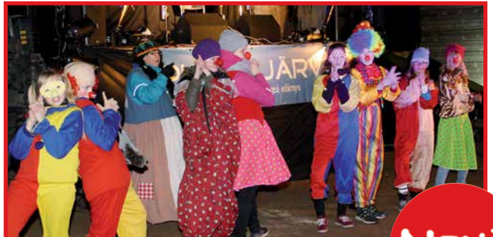
Jippii-näytelmäryhmä klovniesityksen vauhdissa.