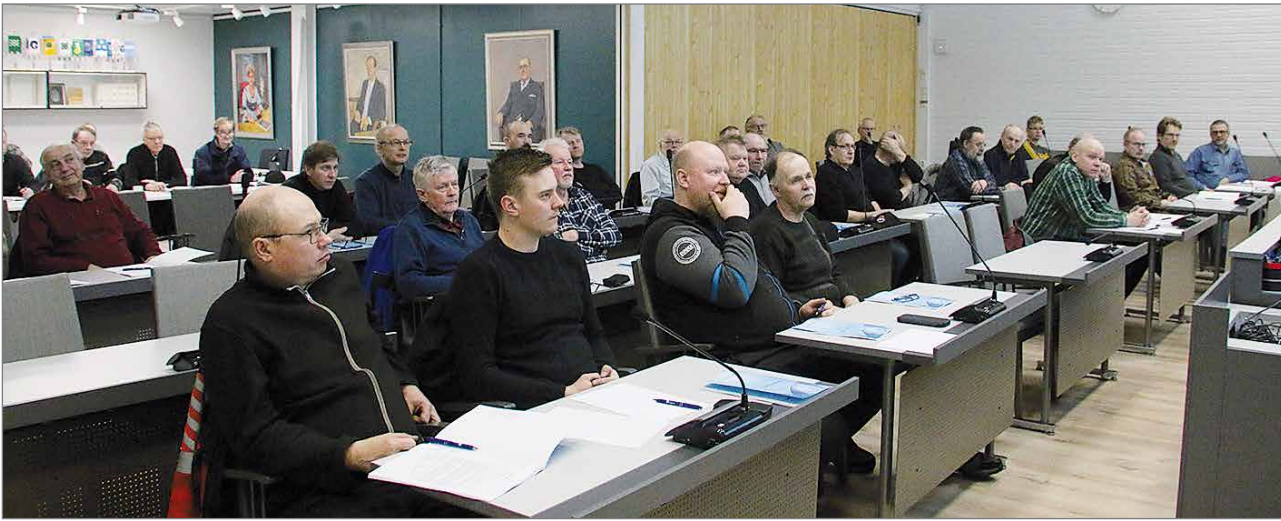
Kuusamon, Taivalkosken ja Pudasjärven alueen pienten vesihuoltolaitosten yhteistyön edistämishankkeen toimesta järjestettiin pienille vesiosuuskunnille vesityökorttikoulutustilaisuus tämän vuoden helmikuussa Pudasjärven kaupungintalossa. Mukana oli viitisenkymmentä pienten vesilaitosten edustajaa.