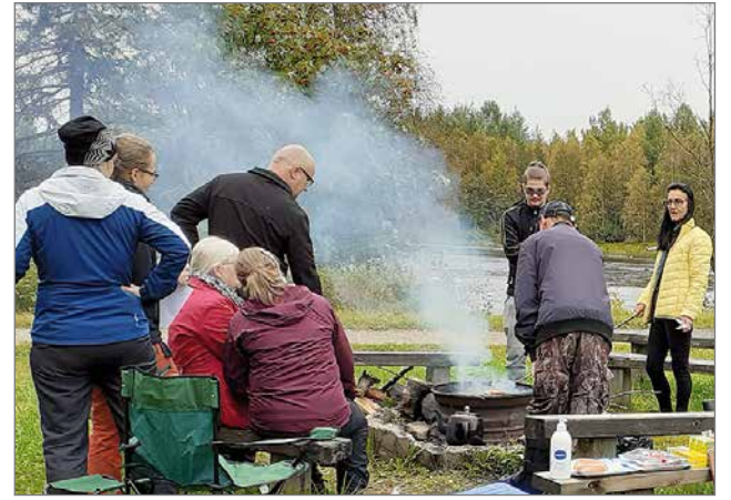
Ensimmäisessä Makkarahetki työnhakijoille järjestettiin 1.9 Liepeen rannassa. Järjestelyissä mukana olivat Vahvaksi-hankkeen ja Pudasjärven seurakunnan diakoniatyön porukkaa.