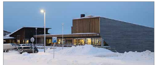
LumiAreena on ollut kaupallisessa vuokrauskäytössä joulukuusta 2019 alkaen. Kaupallisen käytön osalta kevät 2020 käynnistyi hyvin erilaisten tapahtumien muodossa, mutta kysyntä tyrehtyi nopeasti koronan aiheuttamiin ongelmiin.