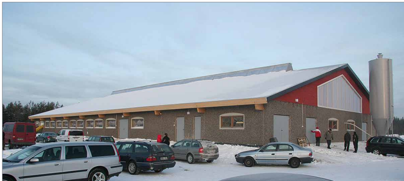
Jurmun uuden navetan avoimissa ovissa vieraili 10 vuotta sitten noin 500 henkilöä ympäri Suomea. Myöhemmin navettaa on laajennettu suuremmalle lypsykarjalle ja käytössä on kaksi lypsyrobotia.