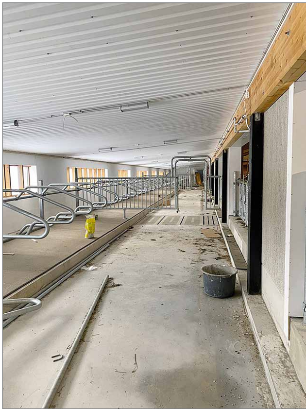
Tilalla on valmistumassa laajennusprojekti, jossa on rakennettu uusi kestokuivitettu poikimaosasto ja umpilehmille sekä lopputiineydessä oleville hiehoille omat väljät tilat.