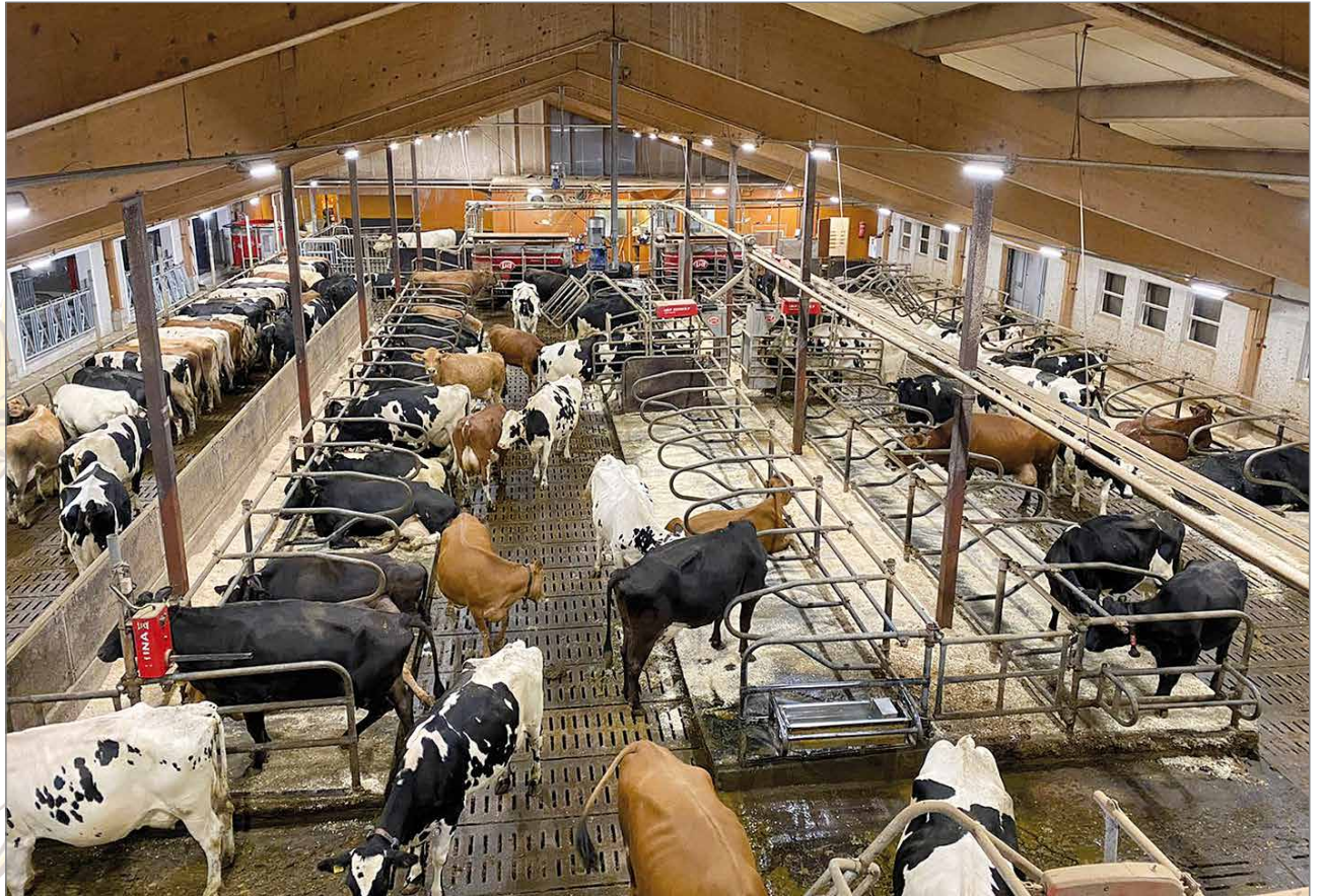
Valmistumassa olevan investoinnin jälkeen Kansakoulun Tilalla on paikat noin 220 naudalle, joista lypsylehmiä on noin 120.