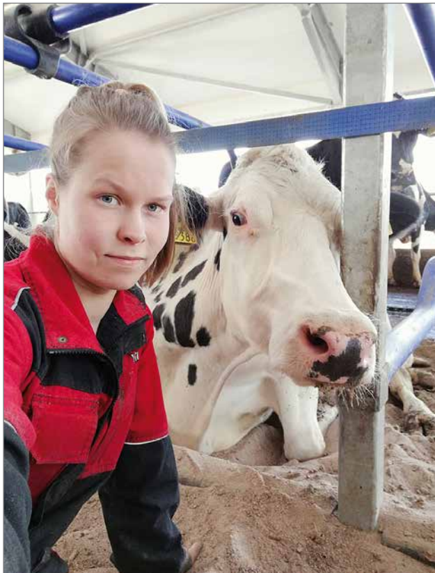
Emäntä poseeraa Liinu-lehmän kanssa.

Ronkainen on toiminut maitotilayrittäjänä Saijalan tilalla 14 vuotta. Avioliiton solmimisen jälkeen Suviemäntä on työskennellyt tilalla seitsemisen vuotta. Perheessä on kolme lasta, jotka ovat innolla navetassa mukana. Saijala on Matin kotitila.