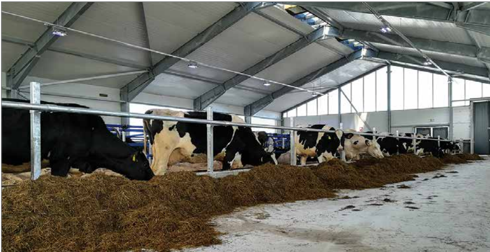
Lehmät syömässä tuoretta apetta.