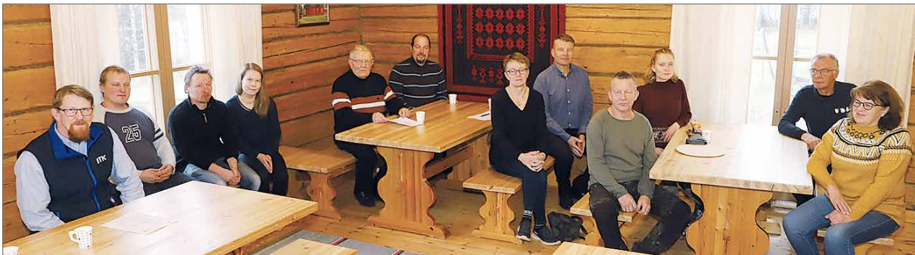
MTK Pudasjärven syyskokous pidettiin aikaisempien vuosien tapaan Liepeen väentuvassa.

Arvostamme Ilmastotiekartan painotusta sen osalta, että ohjelmassa esitettyjen toimien tulee olla viljelijöille vapaaehtoisia ja oikeudenmukaisia. Hyvää on myös se, että esitysten pohjana olevan tutkimuksen nykyinen määrä todetaan suppeaksi ja että tutkimuksen resursseihin vaaditaan lisää rahoitusta, jotta ohjelmaa voidaan jatkossa päivittää tutkittuun tietoon pohjautuen. Kaikilta osin emme voi hyväksyä Ilmastotiekartan skenaarioiden toteuttamistapaa. EU:n