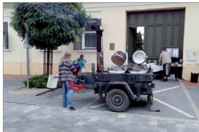
Unkarin kirkon vapaaehtoiset valmistaneet ruokaa, jota jaetaan kaikille halukkaille jumalanpalveluksen jälkeen.