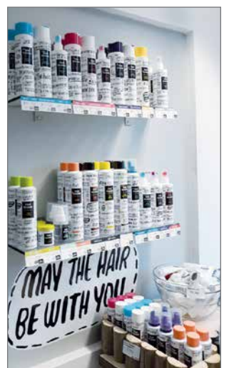
Tukkaputki on sisustettu lämpimin sävyin ja luonnonmateriaaleja hyödyntäen. Myytävät tuotteet ovat selkeästi esillä.

-Marraskuussa on tulossa kotimaisista Four Reasons -tuotteista 40 prosentin tarjouksia, Tanja tiedottaa haastattelun lopuksi. A-R.H