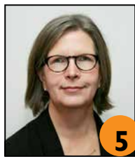
Fali Sirkku Sairaanhoitaja