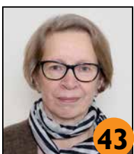
Loukusa Vuokko Arkstiosuhteeri