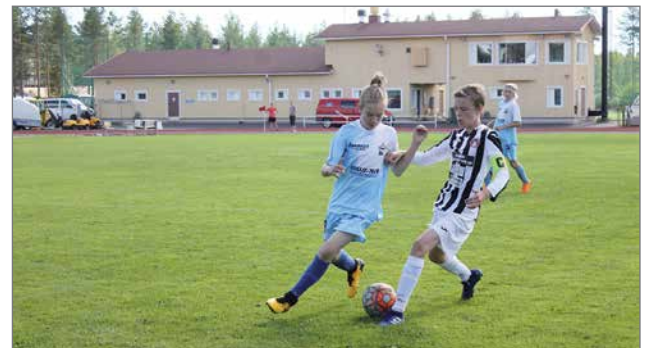
Kurenpoikien P14 joukkueen vahvuus on hyvä yhteishenki. Joukkueen perusta on säilynyt samana jo vuodesta 2011 ja uudet pelaajat ovat solahdaneet hyvin joukkoon mukaan.