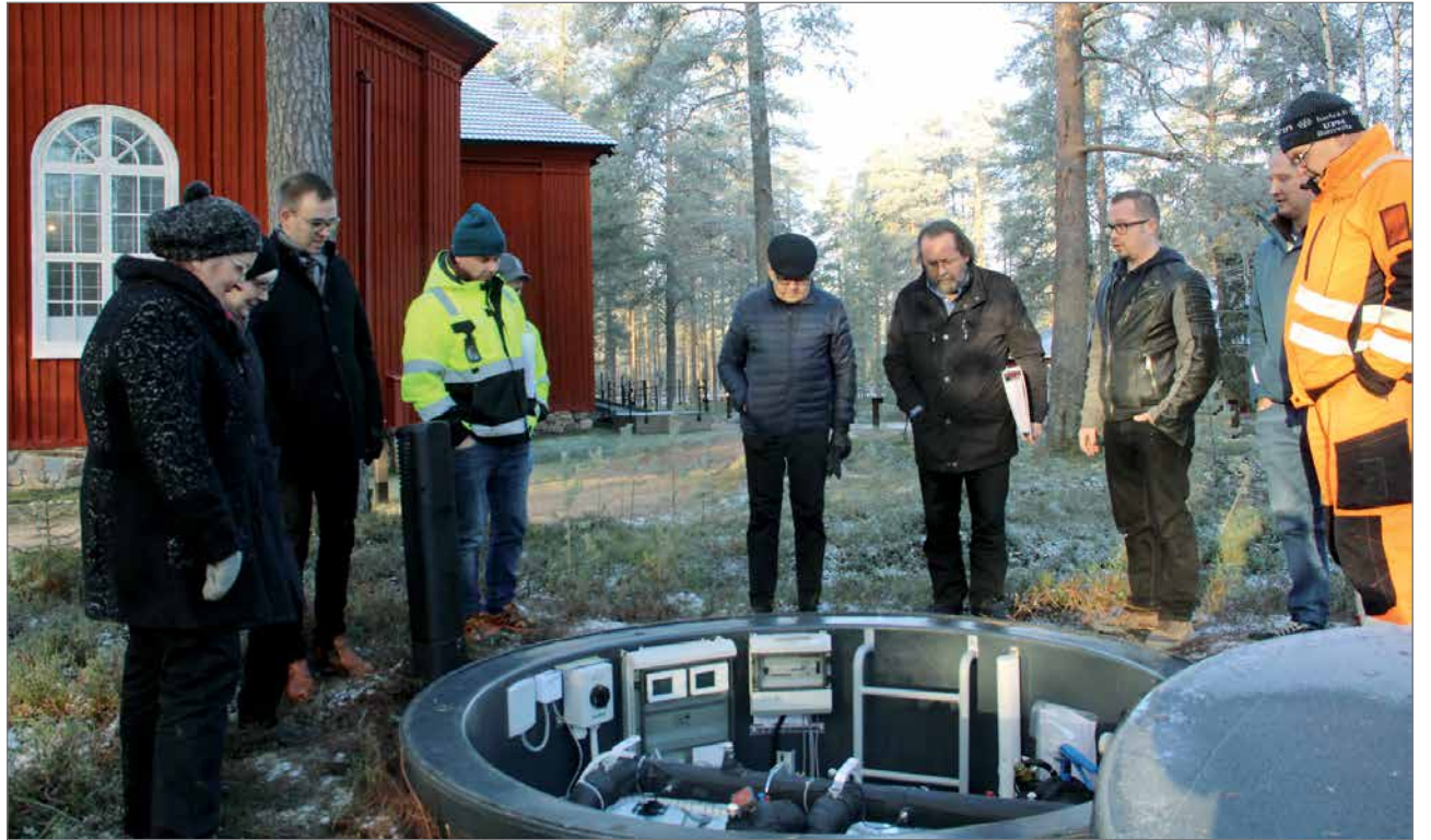
Gebwell E-Flex maalämpölaitteisto sijaitsee kirkon vieressä ulkopuolella, jonka toimintaa selostavat seurakunnan edustajille työurakan suunnittelija, valvoja ja työnsuorittajat.