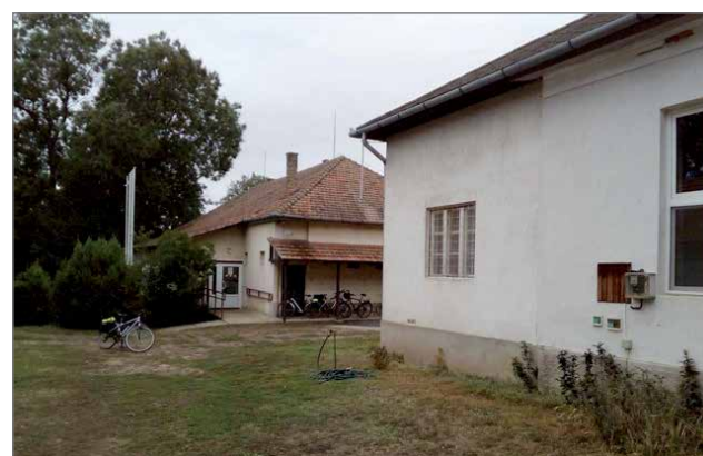
Unkarin kirkolla on 45 laitosta, joissa on muun muassa asuntoja vanhuksille ja päihteistä kärsiville ihmisille.