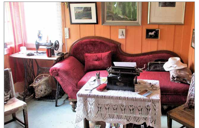
Kuin talon emäntä olisi vain hetkeksi poistunut... kirjoituskone ja polku-Singer valmiusasemissa.