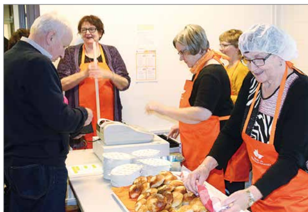
Pudasjärven Maa- ja Kotitalousnaiset olivat järjestäneet ruokailun ja kahvituksen.