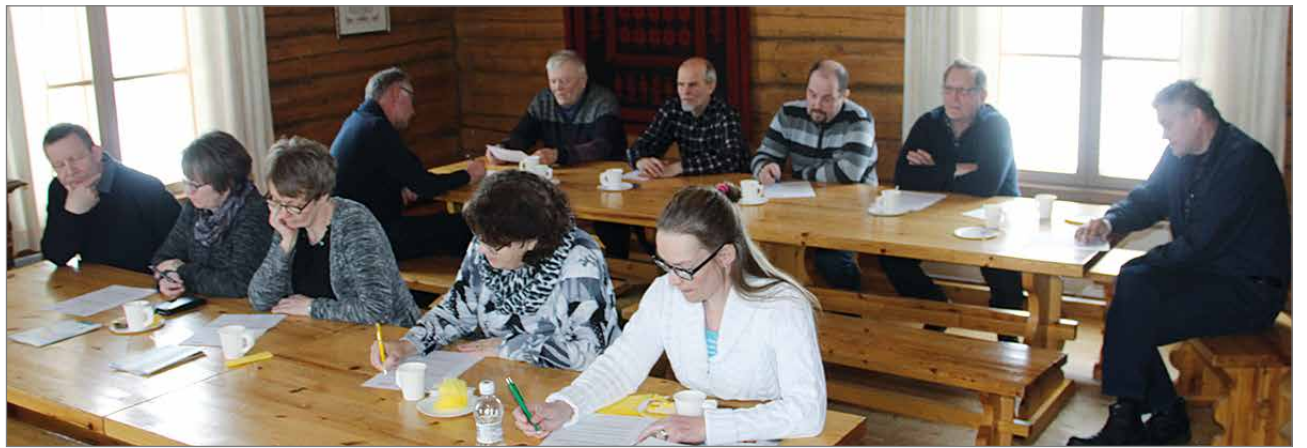
Kevätkokouksessa oli väkeä vajaa parikymmentä henkeä.

jon edunvalvonnan eteen. Kaikki työ ei välttämättä aina näy ulospäin, mutta esimerkiksi viiden prosentin yrittäjävähennys elinkeinotoiminnan tulosta ja ravintolaruokan alkuperämerkintöjä koskeva kansallinen asetukset ovat paljolti MTK:n aikaansaannok-