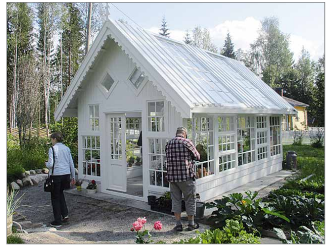
Puutarhan kaunis kasvihuone on rakennettu vanhoista ikkunaruuuista.