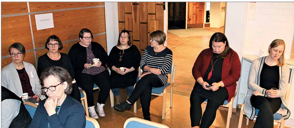
Seurakunnan työntekijöitä oli tällä kertaa tavallista enemmän seuraamassa kirkkovaltuuston kokousta.