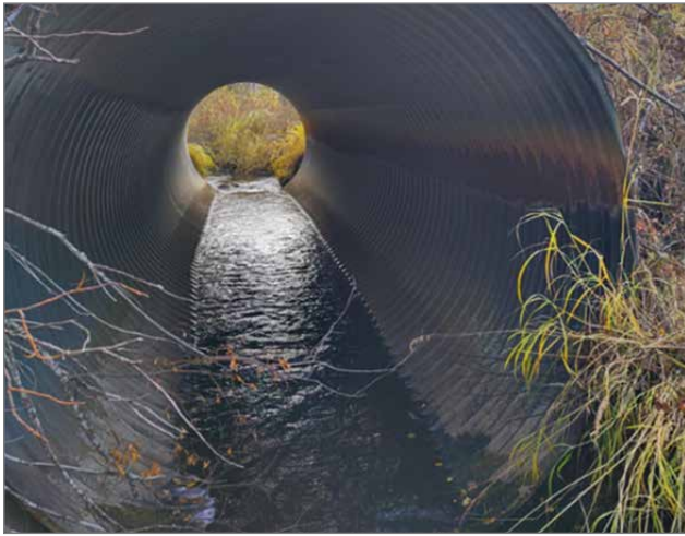
Kuvassa on alkava korrosio syönyt jo pinnoitetta rumpurakenteista. Veden happamuudella, PH-arvolla on vaikutusta syöpmisherkyyteen. Maalaus - pinnoitus jatkavat siltarumpun käyttöikä.