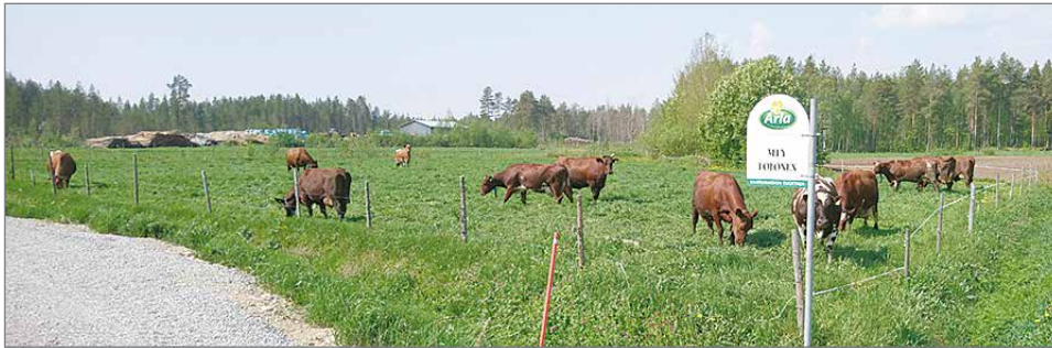
Lehmäluku tulee pihattonavetan myötä kolminkertaistumaan nykyiseen karjamäärään ver- rattuna.