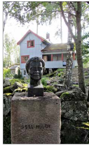
Kirjailijan muotokuva tervehtii portilla taloon tulijaa.

laisille muutaman vuoden verovapauden, jos nämä tulisivat asuttamaan kantaväestön karttamia metsiä.