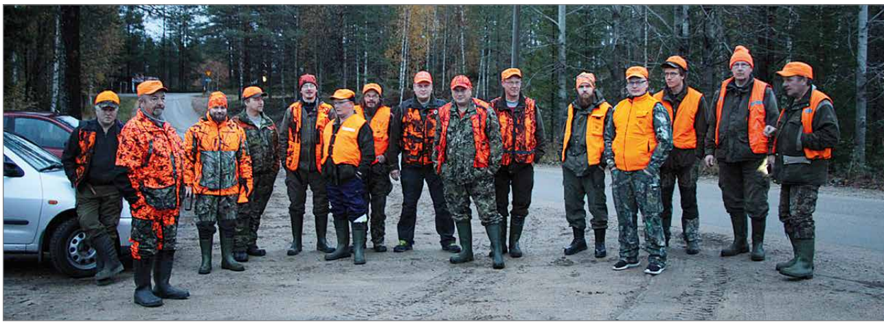
Aitto-ojan Metsästysseuran tämän syksyinen jahtikausi alkoi tuloksekkaasti.