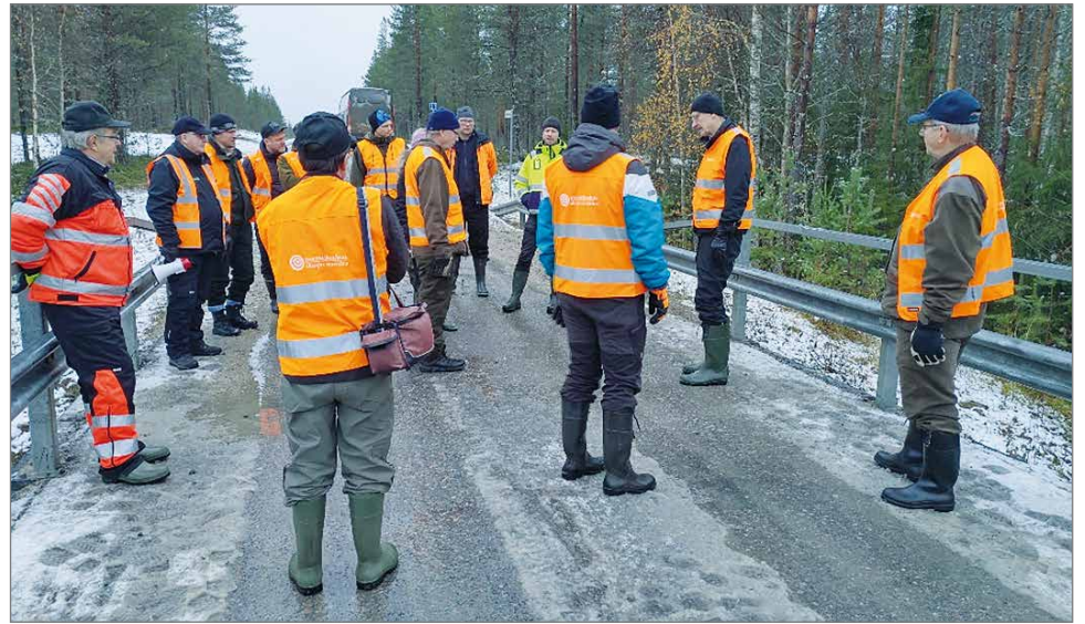
Sarakylästä siltaretkelle osallistui runsas joukko asiasta kiinnostuneita henkilöitä.

Vertailun vuoksi, putkisiltojen (halk. >2000 mm) mitoituksessa sallitaan laskea