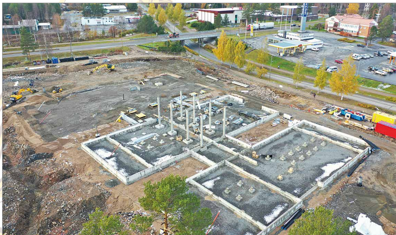
Pudasjärven keskustassa alkaa vähitellen rakentua kaupungin uusi hirsinen olohuone Hyvän Olon Keskus. Kuva Airmoilanen.

Olipa yrityksesi pieni tai suuri, yritysneuvonnan kautta saat apua ja tukea omiin kehittämissuunnitelmisi. Ota yhteyttä!