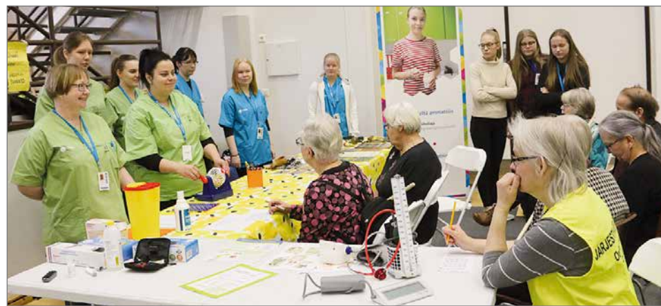
OSAO Pudasjärven yksikön lähihoitajaopiskelijat olivat messuilla monessa mukana. He järjestivät muun muassa bingon.