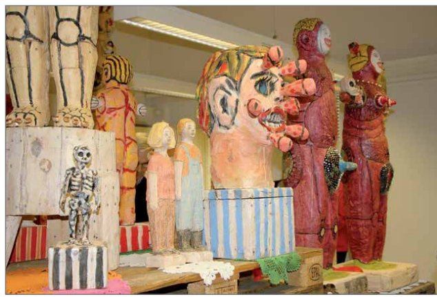
Kokon teoksista löytyy usein sekä taide että käyttöesine samasta paketista.

Kulttuurikeskus Pohjantähti ei lepäile. Tiistaina 16.10. siellä avautui uusi, kahden kuvanveistäjän yhteisnäyttely.