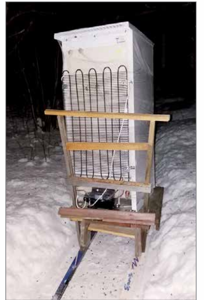
Änekosken ystävät kustansivat Merialle jääkaapin. Lupasin hommata kaapin Kostamuksesta ja toimittaa perille asti. Loppumetrit huonokuntoisella kelkalla.

tai yhteisöä. Suuri kiitos kaikille lahjoittajille. Osuuspankille ja Pudasjärvi-lehdelle vielä kiitokset yhteistyöstä ja avusta.