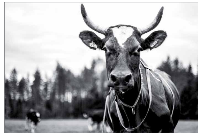
Palkittu kuvasarja on nimeltään ”vanhassa lehmässä asuu syvä rauha ja viisaus”.