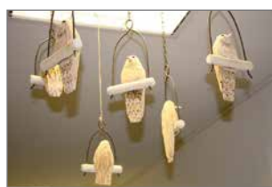
Tsirp tsirp -lintuteos johdattaa vieraat värikkäiseen taidehuoneeseen.