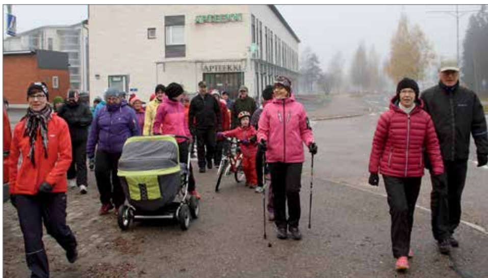
Viime vuonna Apteekin järjestämään kävelytapahtumaan osallistui reilut 50 henkeä.

Kohonnut verenpaine on merkittävä riskitekijä myös aivoverenkiertohäiriöille (AVH). Kohonnutta verenpainetta ei tunne, joten siksi verenpainetta kannattaa seurata säännöllisesti