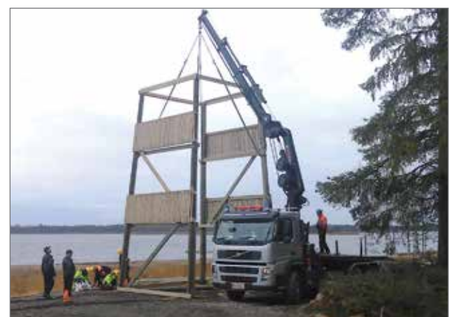
Pudasjärven rantaan on noussut Kurenalan kyläyhdistyksen tilaama Lintutorni, jonka rakennustöistä vastaa Unelmatehtas.