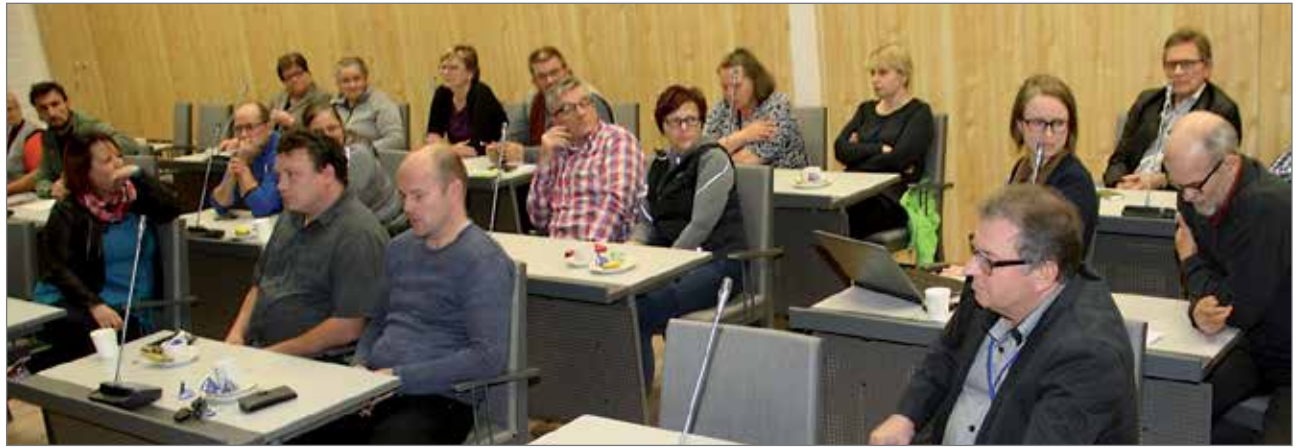
Yrittäjätöitä oli saapunut kolmisenkymmentä yrittäjää.