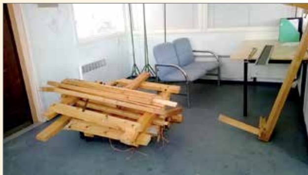
Kangaspuut jäivät Lytän tulliin, koska puntari näytti 62 kg. Yksi henkilö voi viedä tavaraa 50 kg, mutta mikään esine ei saa painaa yli 35 kg, muuten täytyy maksaa tullia. Meitä oli kaksi, joten ajattelimme, että ei ole ko. ongelmaa.