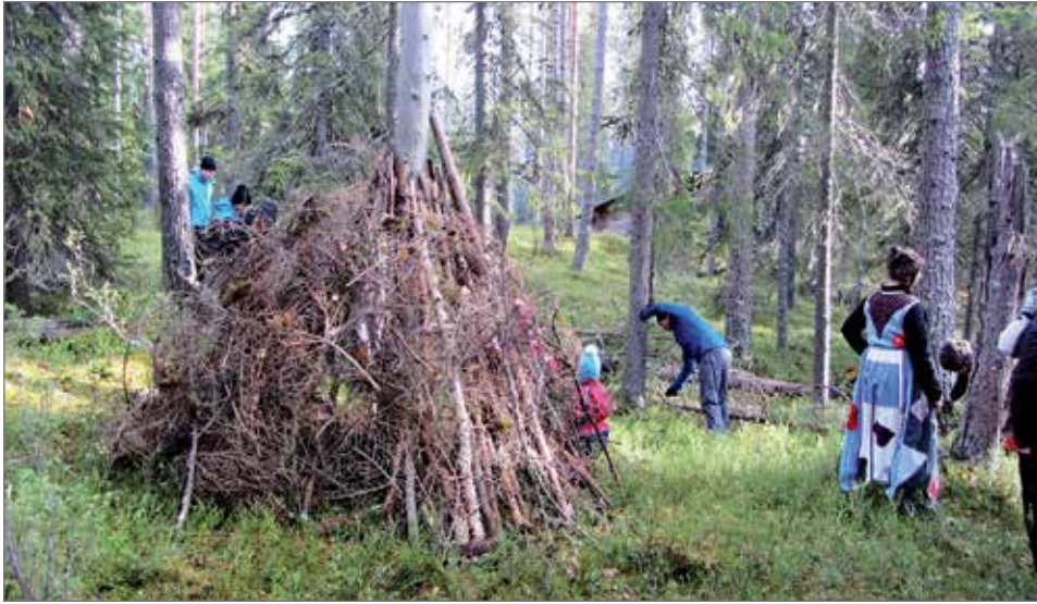
Viime vuoden vastaavassa tapahtumassa oli ohjelmassa muun muassa peikkomajan rakentamista.

Syyslomien aikaan 20.-29.10. Syötteen luontokeskuksessa vietetään perinteiseen tapaan lasten luontoviikkoa. Viikon aikana järjestetään retkiä luontoon, katsellaan elokuvia auditorion suurelta valkokankaalta sekä touhutaan monenlaista niin sisällä, kuin ulkonakin. Luontokeskuksen kahvila tarjoaa hengähdystauon ulkorientoihin. Tarjolla on muun muassa tuoreita leivonnaisia, kuumia ja kylmiä juomia sekä suurempaan nälkään herkullisia hampurilais- ja salaattiannoksia. Vaihtuvana näyttelynä pääsee ihailemaan Vuoden luontokuvia vuodelta 2014 sekä Syötteen koulun oppilaiden luontoaiheisia maalauksia. Luontoviikon tapahtumat ovat pääsääntöisesti maksuttomia, joitakin tarvikemaksuja lukuun ottamatta. Luontoviikon järjestää Syötteen luontokeskus yhdessä Pudasjärven OSAOn matkailu-