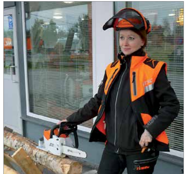
Metsätoimialalla on nykyään huomattavan paljon naisia ja määrä kasvaa koko ajan.

Metsäpäiväteemaan kuului vielä seuraavana päivänä torstaina naisil-