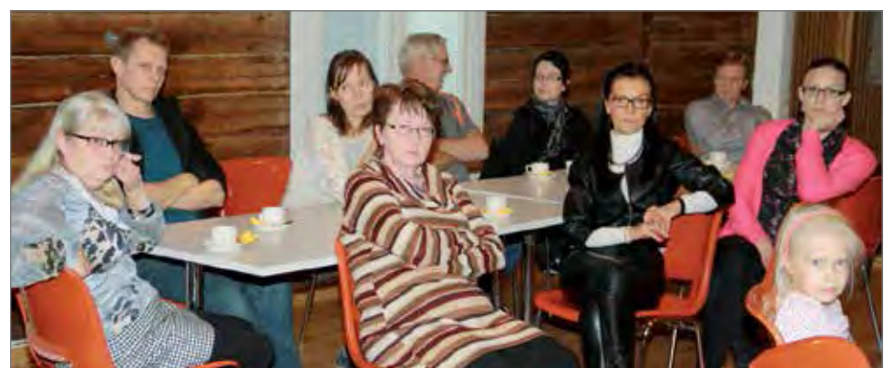
Loppupalaverissa todettiin tapahtuma onnistuneeksi ja KurenTanssi päätettiin järjestää ensi vuonnakin.

entisiä, kuin uusiakin tanssijoita. Mitä useampi pari on osallistujina, sitä enemmän tapahtuu tanssiparketilla, totesi Koivula. HT