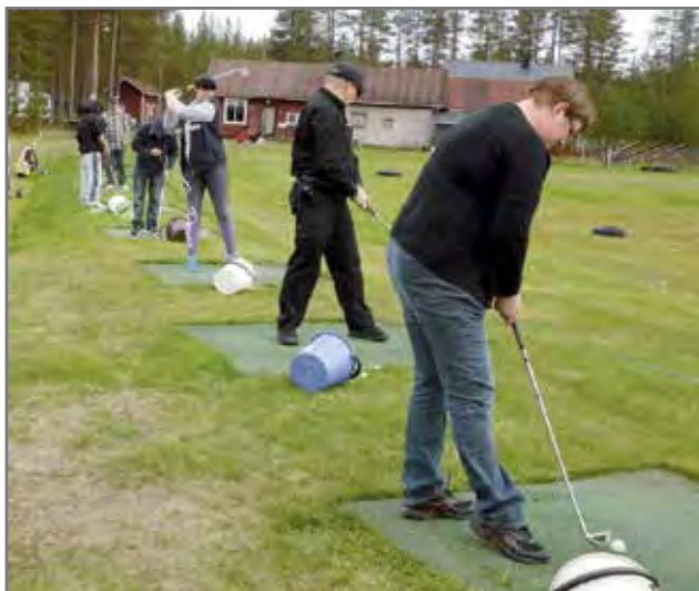
Opetellaan oikeita golfotteita.