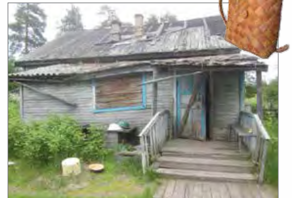
Valentina-mummon reikäinen katto.