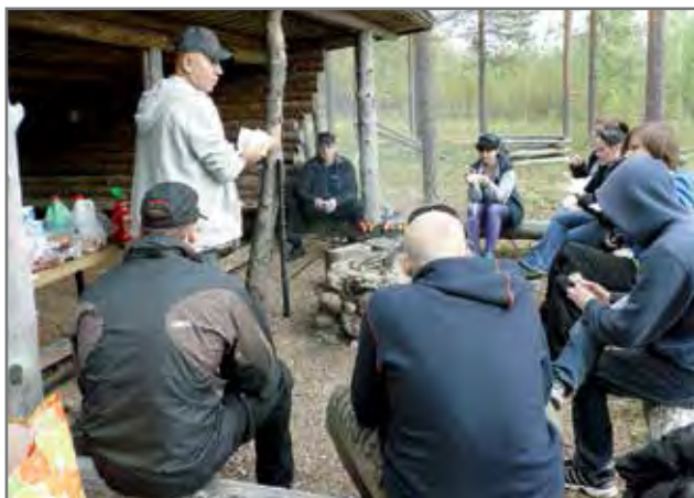
Golfauksen välillä kokoonnuttiin nuotille.