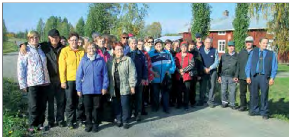
Ruskaretkeläiset ryhmäkuvassa Pajalassa Kengisenkosken maisemissa.