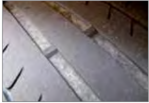
Kuvan kesärenkaissa on lain vaatimaa urasyvyttä jäljellä vain hitusen verran.

gaspaine. Alhainen rengaspaine lisää auton polttoaineen kulutusta, kuluttaa renkaita tarpeettomasti ja altistaa renkaat rasitusvaurioille sekä voi muuttaa auton ajokäytöksen vaaralliseksi. Rengaspaineet tulisikin tarkistaa vähintään kerran kuukaudessa. Tarkistus kannattaa tehdä ennen matkalle lähtöä, kun renkaat eivät ole ehtineet vielä lämmitä. PK