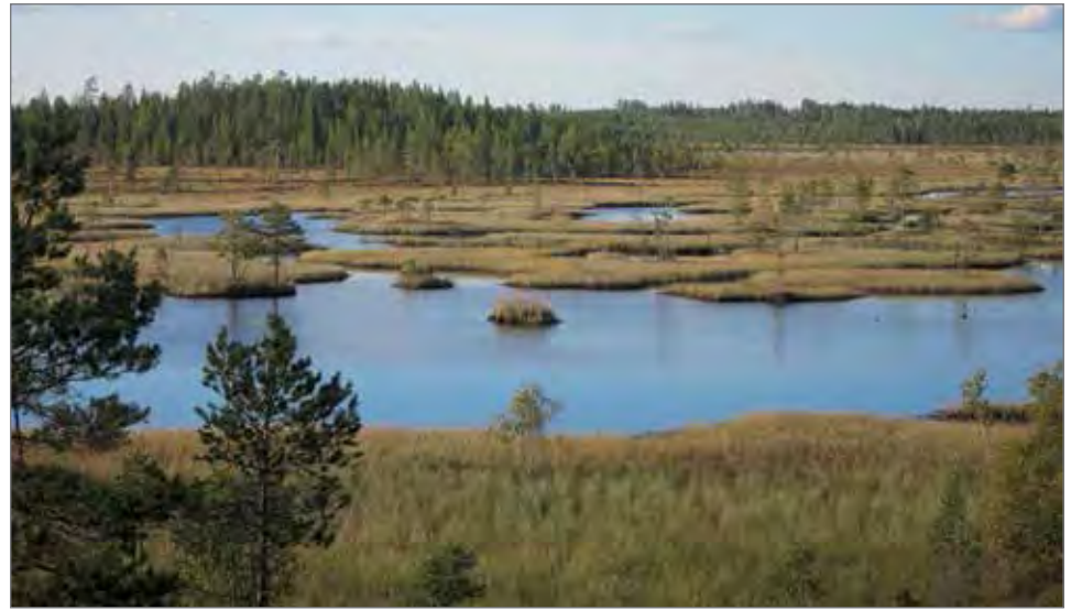
Olvassuo on luonnonarvoiltaan merkittävä, erityisesti aapasuot ja pohjavesivalkutteiset lettosuot ovat valtakunnallisestikin arvokkaita.

Olvassuon alue on palveluvarustukseltaan valmis vastaanottamaan kävijöitä myös kansallispuistona, mutta alueen kantokykyä ja käytön ohjausta tulee tarkastella ennen perustamista (esimerkiksi tiestö, park-