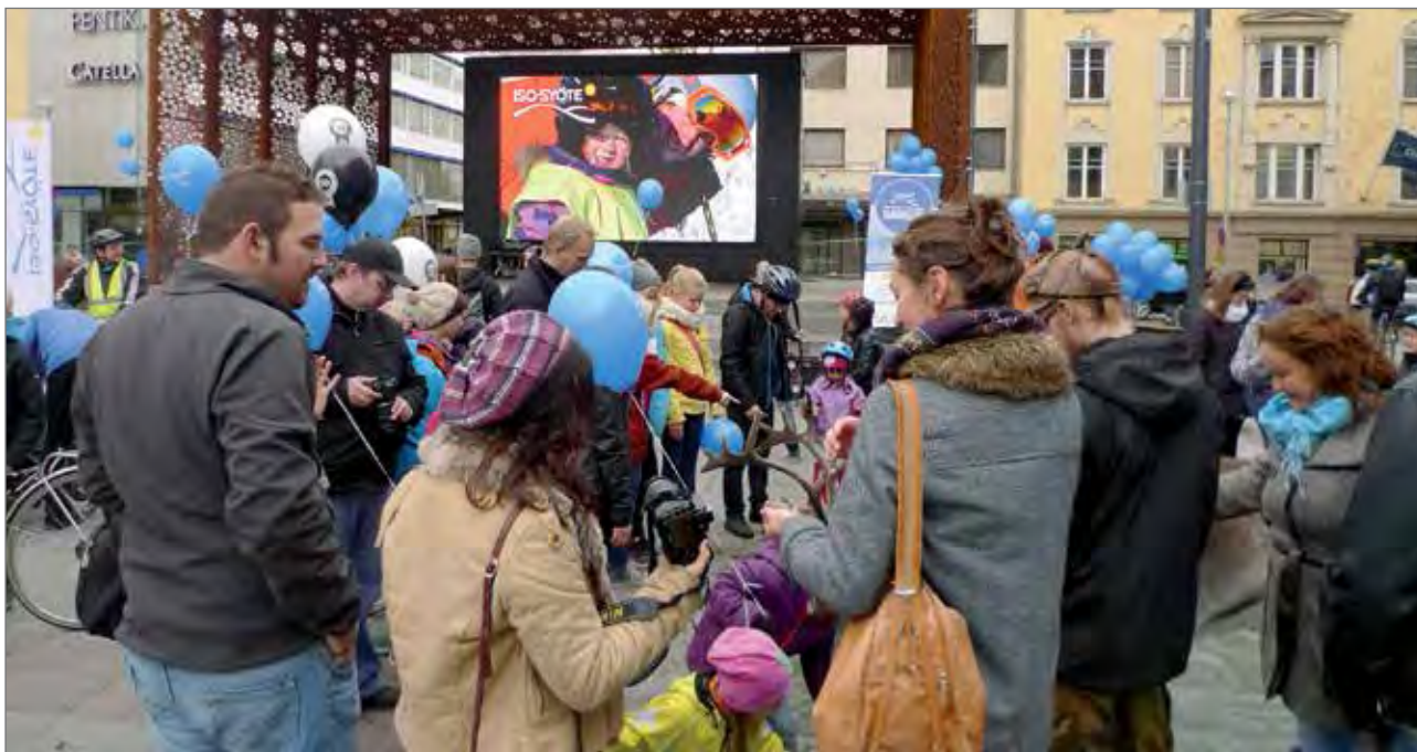
Syötteen väki kävi esittäytymässä Oulun Rotuaarilla. Kuvanäytöllä oli talvimaisemakuvia, ihmisiä jututettiin sekä lapsille jaettiin ilmapalloja.

ten siihen liittyy ympäristöministeriön valmistelutyötä sekä eduskuntakäsittely. PK