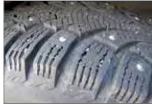
Kuvan talvirenkailla on ajettu yksi talvikausi ja matkan teko on turvallista.