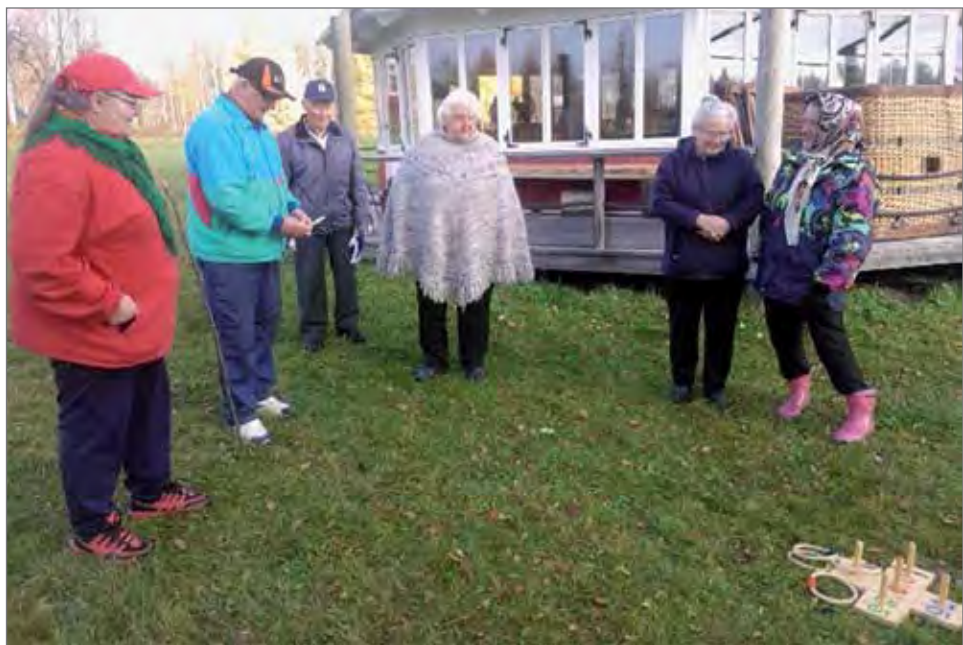
Parhaimpien pisteiden metsästystä heittopelin tiimellyksessä.