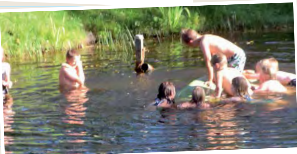
Vesi oli lämmintä ja kaikilla hauskaa.