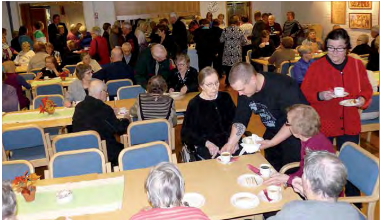
Kirkkokahveilla oli mukava tavata myös tuttuja ja vaihtaa kuulumisia.

Jaalangan vesiosuuskunnan avustushakemus päätettiin vielä jättää pöydälle lisäselvityksiä varten. Vesiosuuskunta anoi Pudasjärven kaupungilta avustusta 37 500 euroa 6,8 kilometrin pituisen yhdysputken rakentamista varten Kongasojan vesiosuuskuntaan. Hankkeen kustannusarvio on 107 000 euroa. Yhdysputken tarkoituksena on parantaa vesihuollon varmuutta, sillä koko osuuskunta on tällä hetkellä yhden vesilähteen varassa. Osuuskunnalla on 86 liittymää. JK