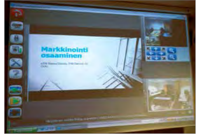
Koulutus käytiin videoseminaarina.