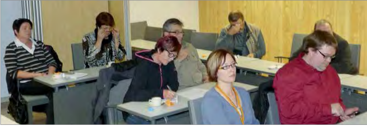
Pudasjärven markkinointikoulutuksesta kiinnostunut ryhmä.