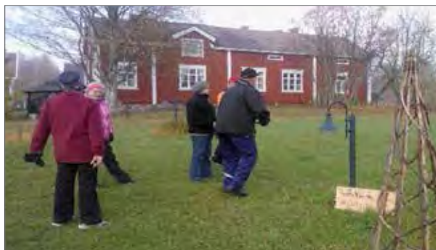
Kyngäskujan pihapiiri tarjosi kauniit puitteet frisbeegolfin pelaamiselle.