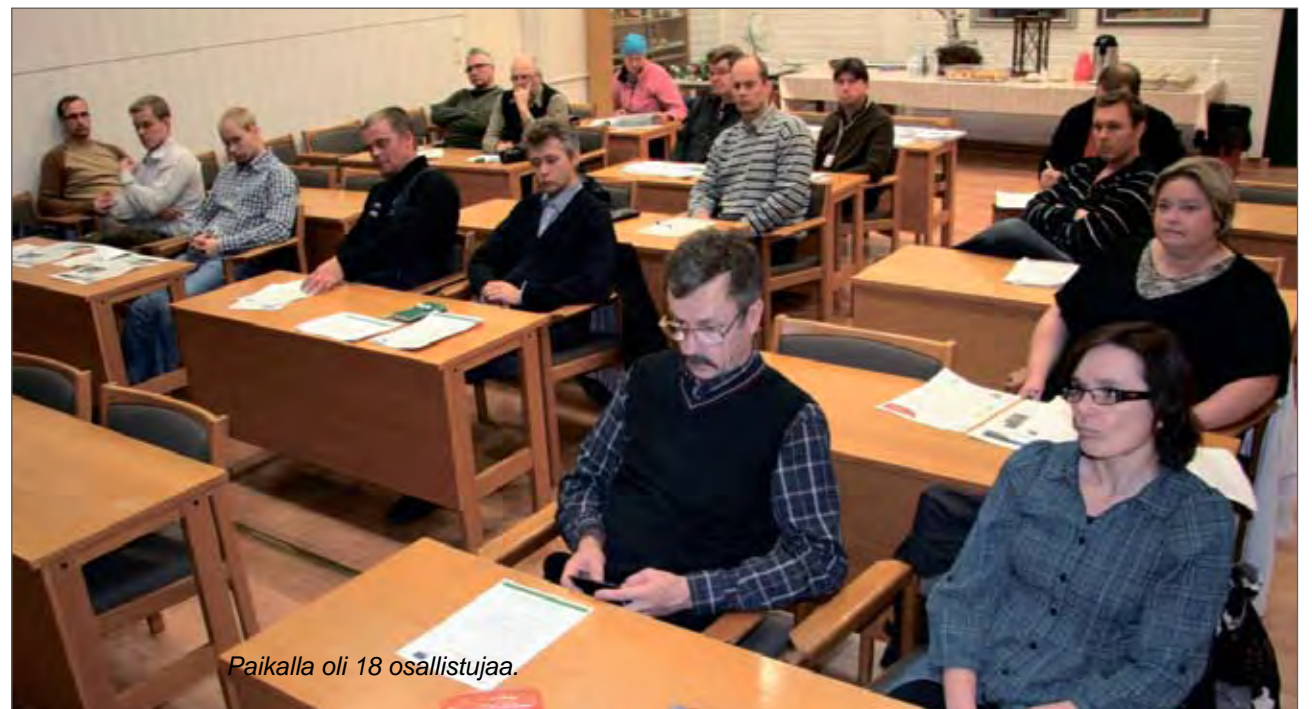
Paikalla oli 18 osallistujaa.