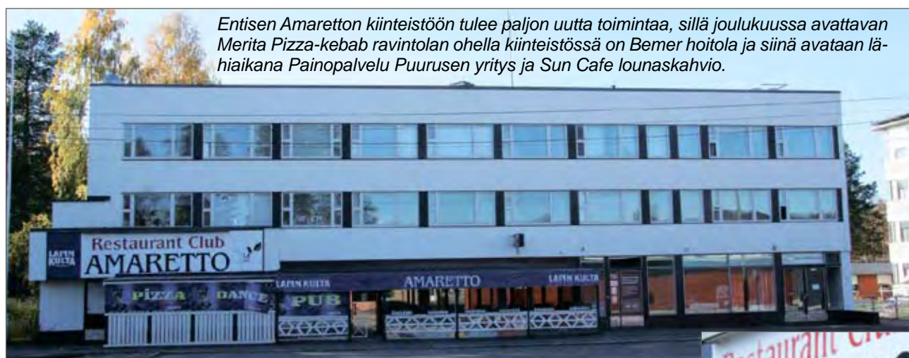
Entisen Amaretton kiinteistöön tulee paljon uutta toimintaa, sillä joulukuussa avattavan Merita Pizza-kebab ravintolan ohella kiinteistössä on Bemer hoitola ja siinä avataan lähiaikana Painopalvelu Puurusen yritys ja Sun Cafe lounaskahvio.

Liikenteen turvallisuusvirasto Trafitec kehittää aktiivisesti liikennejärjestelmän turvallisuutta, edistää liikenteen ympäristöystävällisyyttä ja vastaa liikennejärjestelmän sääntely- ja valvontatehtävistä. www.trafi.fi