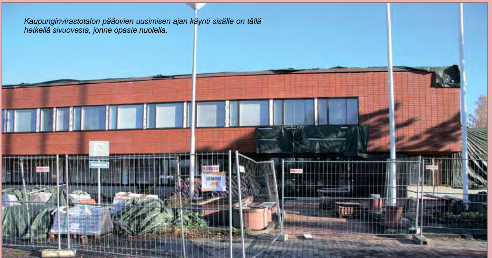
Kaupunginvirastotalon pääovien uusimisen ajan käynti sisälle on tällä hetkellä sivuovesta, jonne opaste nuolella.

Toisen vaiheen urakkahinta on hieman yli miljoona euroa. Pääurakoitsijana on Rakennusliike Asuntoinsinöörit Oy. (AK)