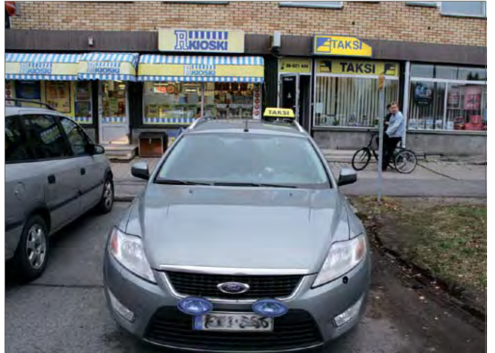
Pudasjärvellä on tällä hetkellä 30 taksia. Taksiasemat ovat Kurenalla ja Syötteellä.