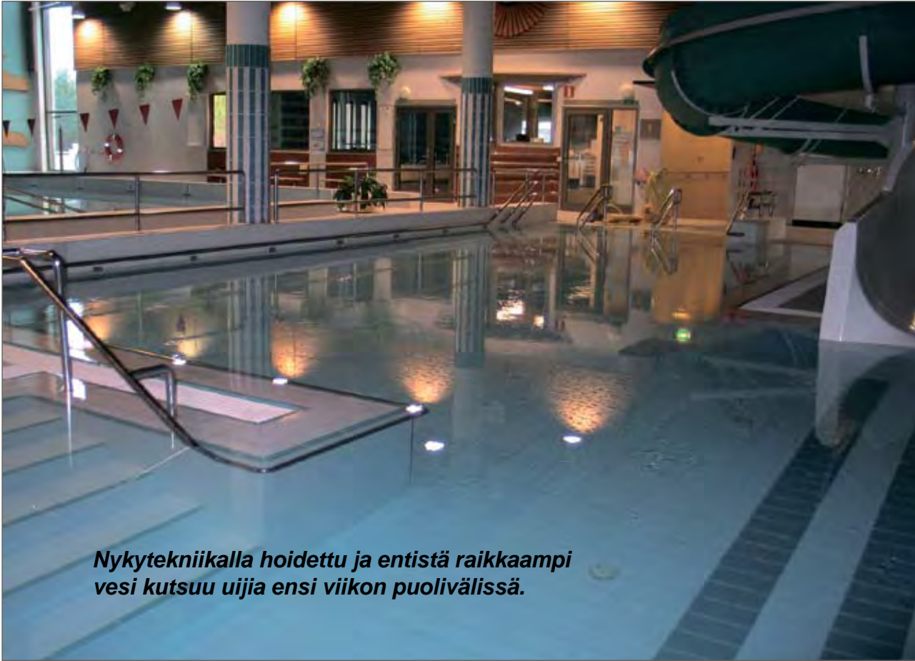
Nykytekniikalla hoidettu ja entistä raikkaampi vesi kutsuu uijia ensi viikon puolivälissä.

Virkistyskylpylä Puikkari avataan kylpijien käyttöön ensi viikon eli syyslo-maviikon puolivälissä.