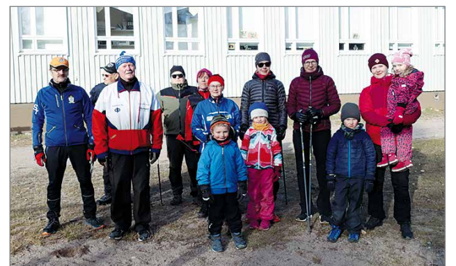
Juhlakävely aloitettiin lauantaina iltopäivällä.