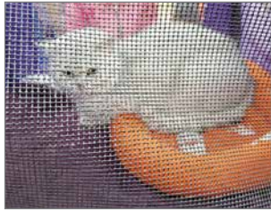
Tässä komeilee brittiläinen lyhytkarvainen Pauli-kissa.