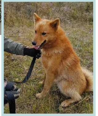
Suomenpystykorva Ove innosti oppilaita tutustumaan Suomen kansalliskoirarotuun.

Teksti ja kuvat: Eeva Tyni ja Rosa Rahkola