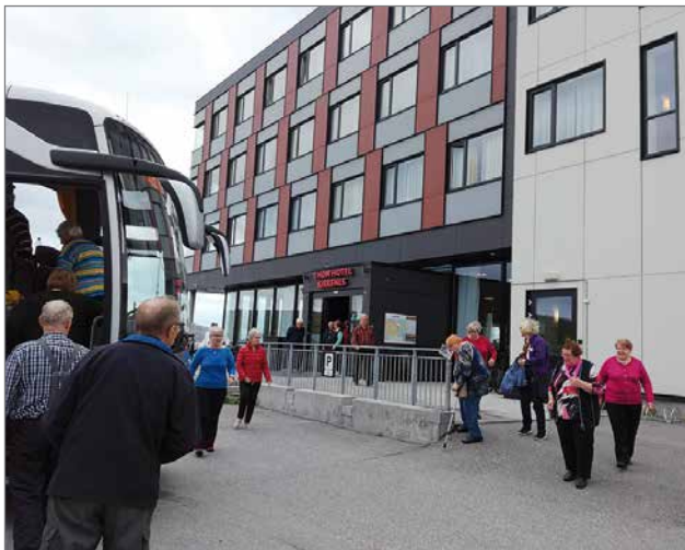
Kirkkoniemessä oli aikaa katsella kaupunkia. Ruokailu oli kuvassa näkyvässä hotellissa.