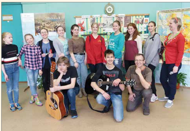
Osa ehti jo lähteä tarjoilujen jälkeen, mutta suurin osa yhteiskuvassa.