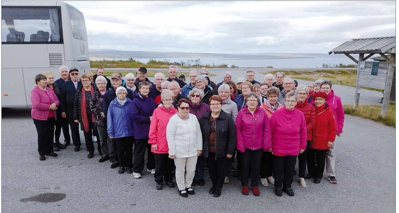
Retkeläisten yhteiskuva Varangin vuonon rannalla.