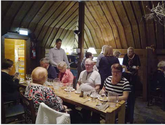
Ivalo hotellissa nautittiin illallinen lappilaisessa Kammi-ravintolassa - saamelaiskulttuurin parissa.

Pudasjärven syöpäosaston ruskaretki suuntautui tänä syksynä 5.-8.9. Ivaloon, josta käsin kävimme Nellimisessä ja Raja-Joosepissa sekä Norjan puolella Kirkkoniemessä. Linja-auto oli jälleen aivan täynnä, meitä oli 52 retkeläistä.