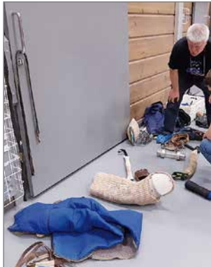
Monipuolinen rekvisiitta auttoi oppilaita ymmärtämään poliisikoiratoimintaa.