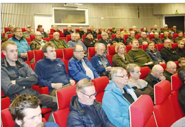
Pohjantähden sali täyttyi hirvipalaveriin osallistujista.

Voit myydä/ostaa/lahjoittaa Pudasjärven kautta. (Asuntojen ja rakennusten vuokraus ei ole myymistä/ostamista/lahjoittamista, maksu 22 € sis. alv:n. Myös asunnon/rakennuksen/kiinteistön myynti/ostoilmoitus on maksullinen, 22 € sis. alv:n) Pudasjärvi on tarkoitettu yksityisille henkilöille ja on ilmainen. Tekstin oltava lyhyt ja ytimekäs max n. 8 riviä. Muistathan laittaa yhteydenottoa varten puh. numerosi tai osoitteen.