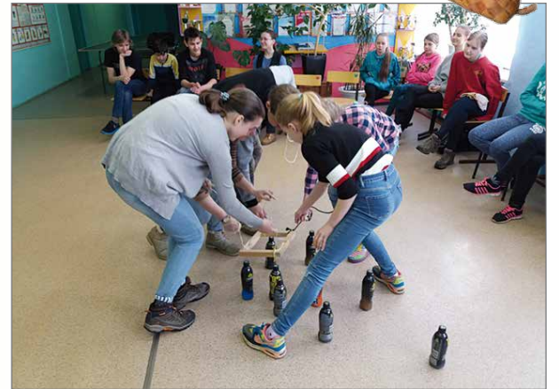
Leiripäivässä oli monenlaista yhteistä kisaamista.