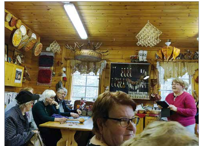
Paluumatkalla oli käyntikohteena Rovaniemen Saarenkylän Koru ja Taidekäsityöpaja.

Lauantaina suuntasimme varhain kohti Kirkkoniemeä. Päivä oli todella pitkä yli 12 tuntia. Ajoreitti kulki Inarinjärven kauniita ranta-