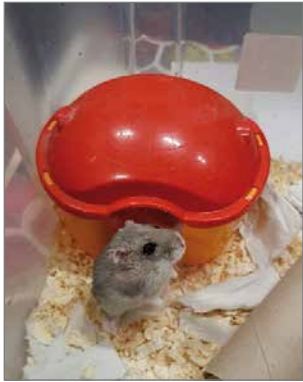
Pieni kääpiöhamsteri ihmettelee uteliaana ympärillä käyvää kuhinaa.