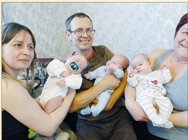
Onnellinen äiti vasemmalla.