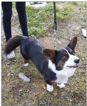
Welsh corgi cardigan Sulokoiraa hurmasi oppilaat hymyllään.

Valtakunnallista eläintenviikkoa vietetään vuosittain 4.-10.10. Eläintenviikon aloittaa kansanvälinen eläintenpäivä ja Hirsikampuksella sitä vietettiin lemmikkieläinten esittelypäivän merkeissä. Koulullamme vieraili tuolloin koiria, kissoja ja hamstereita. Oppilaat pääsivät luokitella kiertelemään ja tutustumaan erilaisiin lemmikkeihin. Lemmikkieläinten päivän järjestelyissä olivat tärkeässä roolissa huoltajat, jotka toivat lemmikit koululle ja esittelivät niitä oppilaille. Päivän lopuksi lemmikit saivat Hirsikampuksen oppilaskunnalta pienen lahjan ruusukkei-