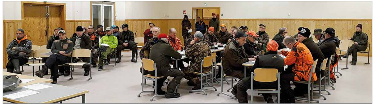
Suojalinna soveltuu koirakisojen keskuspaikaksi erinomaisesti.

Pudasjärvellä on innokkaita ajokoirahenkilöitä ja heitä toivotaan mukaan ak-