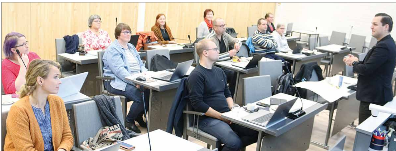
Valmentajat olivat perehtyneet etukäteen ilmoittautuneiden yrittäjien Facebook-sivuihin ja hakukonenäkyvyyteen ja antoivat niiden pohjalta vinkkejä yrittäjille.