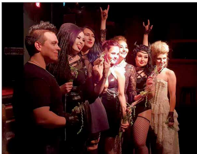
Metal Angel 2019 finalistit JuMe, Alice Von Absinthe, Nana, Nea Maria, Roxie Venom, Miss Sassy Fierce ja Miss Tiodor.