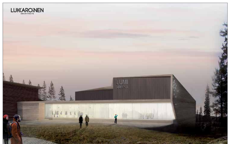
Safaritalon yhteyteen rakennettava Lumiareena rinteiden puolelta.