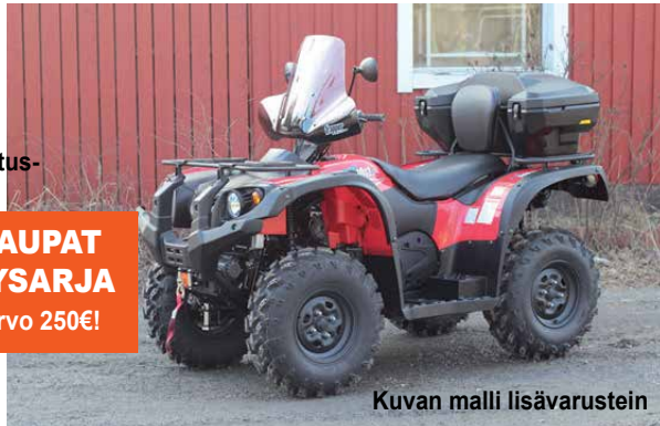
Kuvan malli lisävarustein