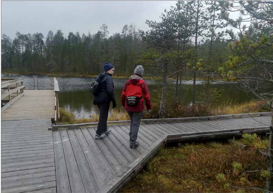
Luontopolkua on monipuolinen ja hyvin hoidettu.