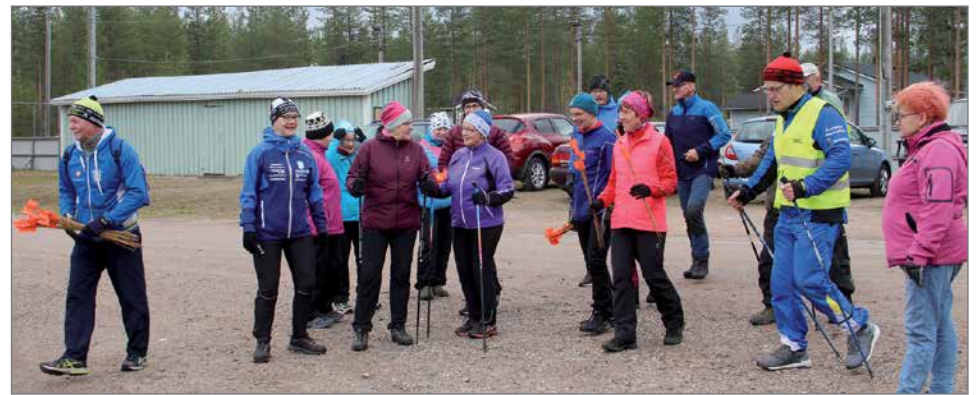
Juhlakävely aloitettiin lauantaina iltapäivällä. Illalla satoi, joten kävelyä jatkettiin sunnuntaina aamulla ja yhdeksän henkilöä suoritti 50 kilometrin matkan.

sä 50, iältään 3-81 -vuotiaita. Kilometrejä kertyi 964,4 eli päästiin lähelle tonnin tavoitetta. 50 kilometrin matkan käveli yhdeksän henkilöä. HT