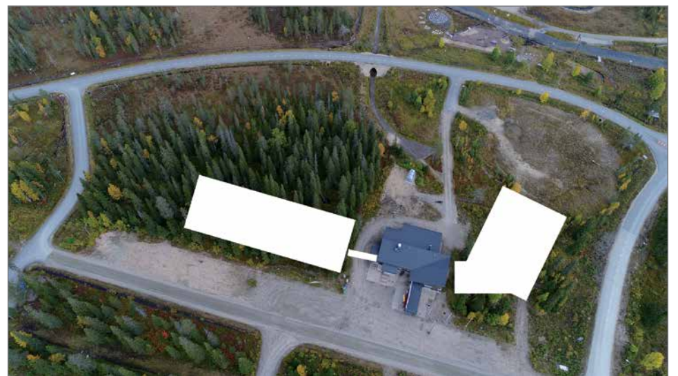
Rakennusten sijoittuvat siten, että nyt jo olemassa olevan Safaritalon (keskellä) vasem- malle puolen rakennetaan Kide hotelli ja sen yhteyteen oikealle puolelle Lumiareena. Ho- telli on jo nyt sitoutunut vuokraamaan mm. Lumiareenan suurta kuntosalia.

Hiihtokeskus Iso-Syöt- teellä kävi kaudella 2017- 2018 yli 50 000 laskettele- vaa asiakasta. Hissinousuja tehtiin reilusti yli miljoona. Hiihtokeskuksen liikevaih-