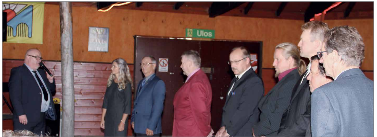
Onnitteluvuorossa Pudasjärven Urheilijoiden hallitus sekä eri jaostot.