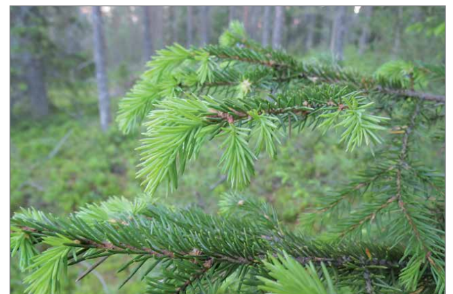
Kuusenkerkkä on monipuolinen luonnon raaka-aine.

Tapahtumaan ilmoittautumiset sonja.harkonen@pudasjarvi.fi tai 040 1866 965.