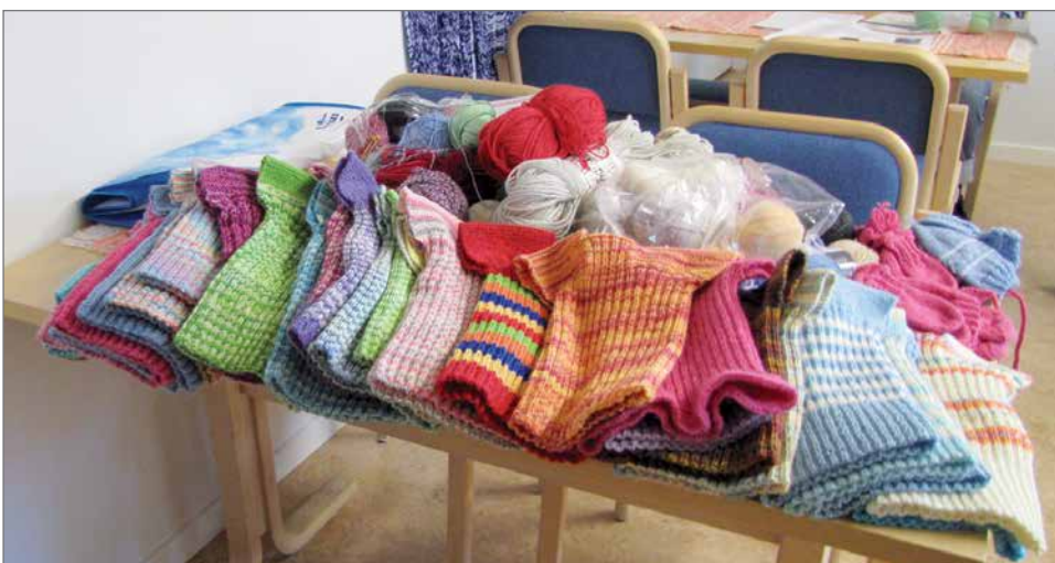
Lahjoituslangat ja illan nuttusaalis.