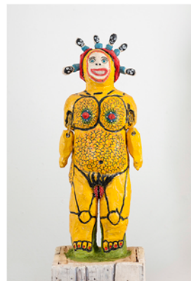
Pampula-Paula 2014 puu ja väri kuva Marko Mäkinen