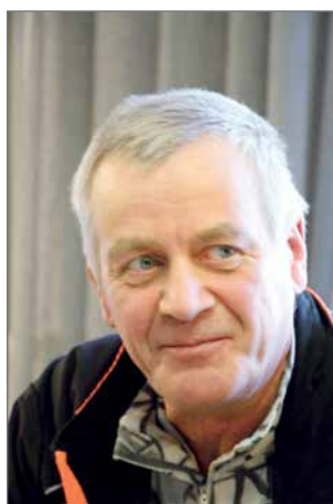
Kuuskymppisen katse kantaa vielä kauas....

Keskiviikkona 10.10.2018 ei liputettu suotta, olihan Aleksis Kiven ja suoma-