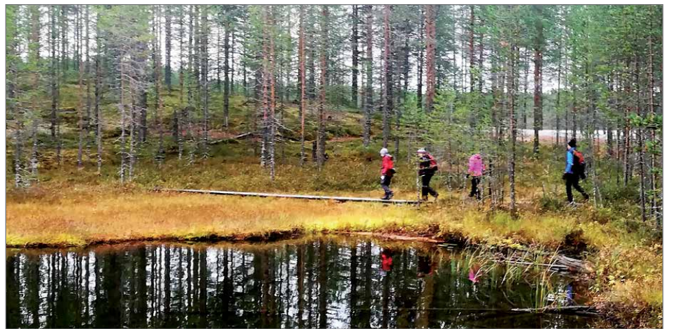
Osa porukasta kiersi upeaa vesistöjen ja hiekkaharjujen reitittämää luontopolkua.