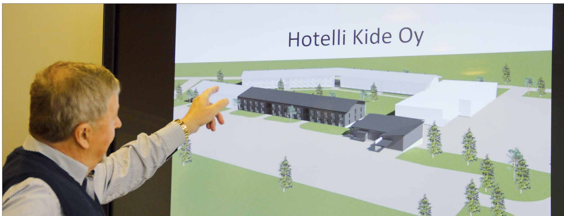
Nyt rakennettava hotelli on ensimmäinen rakennusvaihe. Terentjeff näyttää havainnekuva tulevien vuosien laajennuksista, jotka merkitty valkoisella.