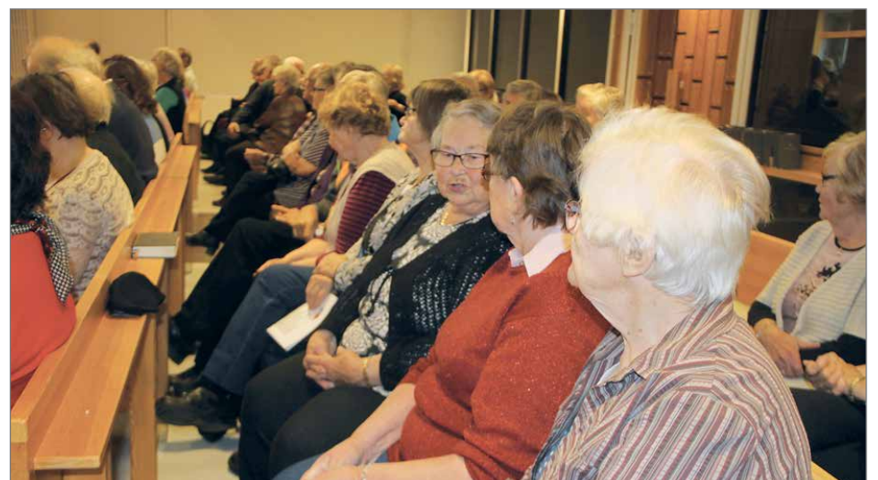
Maanantain 8.10. tilaisuudessa oli seurakuntakodilla runsaasti väkeä.