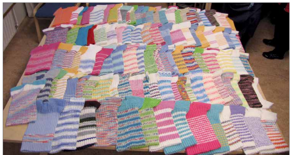
Nutut vuodelta 2016.