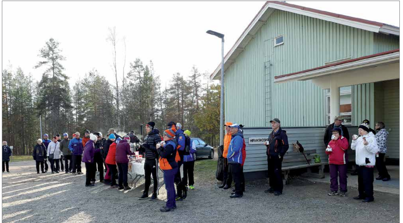
Yleisöäkin oli mukavasti mukana sunnuntaina iltapäivällä.