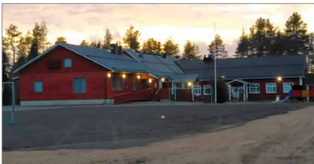
Kipinän koulun uudesta kentästä ollaan kylällä kiitollisia.