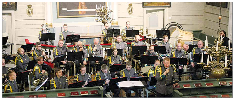
Lapin Sotilassoittokunta viettää tänä vuonna 50-vuotisjuhlaa.