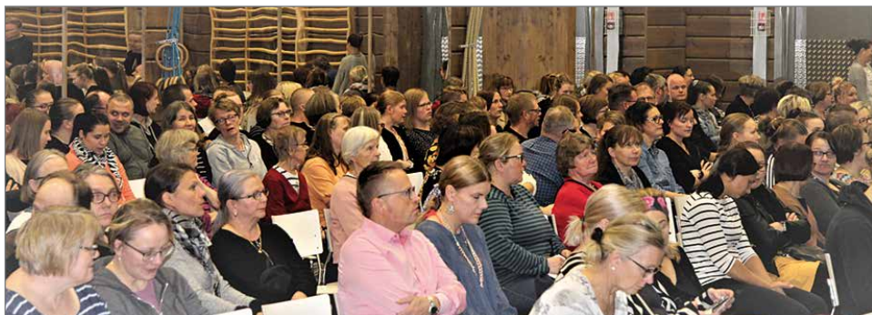
Hirsikampuksen sali oli lähes täynnä kuulijoita.