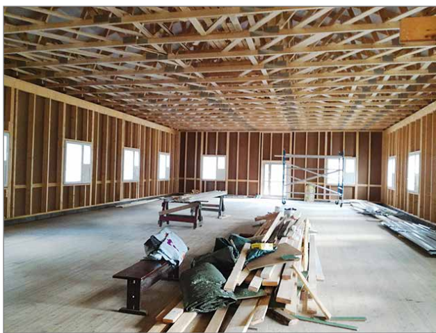
Sisäkuva syyskuun alussa.

Pudasjärvi lehden välityksellä haluan välittää suuret kiitokset erityisesti rahoittajille Suomen Kotiseutuliitolle ja Pudasjärven kaupungille avustuksista ja puskurilainasta. Ilman ni-