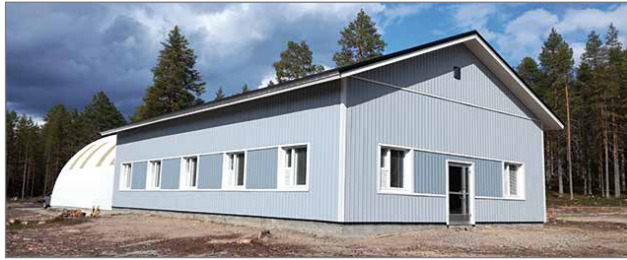
Uusi Hampushalli nousi kuluneen kesän aikana talkoovoimin. Sisäpuoliset työt jatkuvat tänä syksynä ja ensi keväänä. Seinät levytetään ja rakennetaan orkesterikoroke sekä orkesterin taukotila.