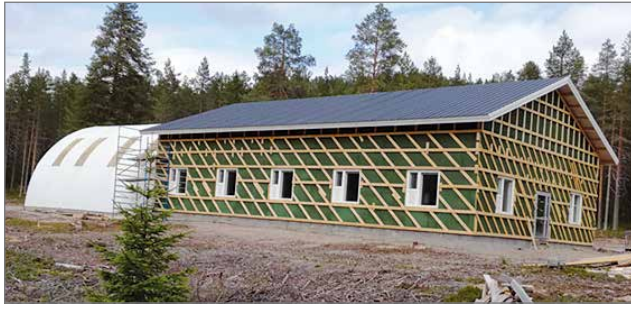
Peltikatto ja tuulensuojalevyt olivat asennettuna heinäkuussa.