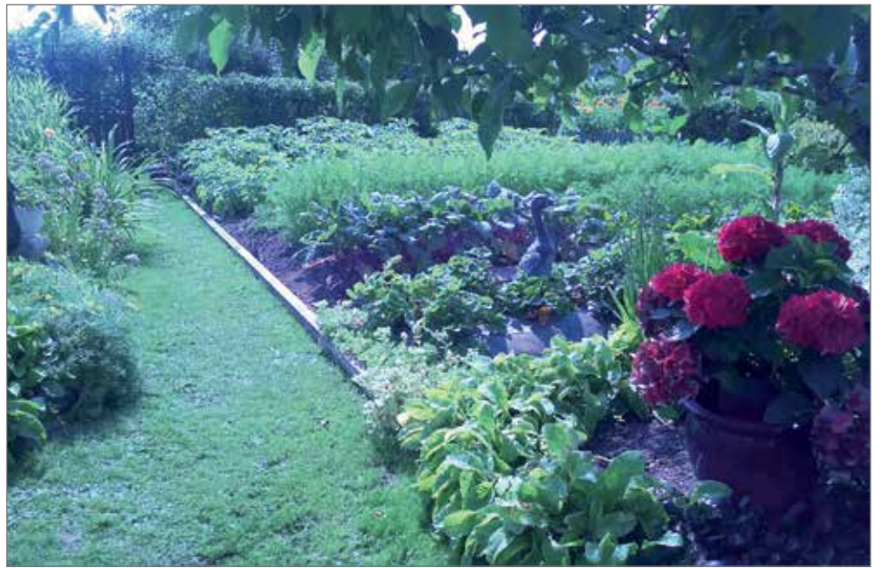
Pudasjärvelläkin olisi hyviä mahdollisuuksia kasvattaa luomuvihanneksia jalostettavaksi myyntiin. Jos useampi viljelijä lähtisi rinkiin mukaan, ei alojen tarvitse alkuvaiheessa olla välttämättä suuria viljelijää kohti.