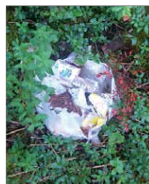
Roskat kuuluvat roskikseen, eivät luontoon.

Hyötyjätetepisteisiin voi toimittaa pienmetallia, pahvia ja kartonkia, kierrätyspaperia ja lasia. Muovi tulee laittaa sekajätteeseen. Käytetyt paristot ja akut