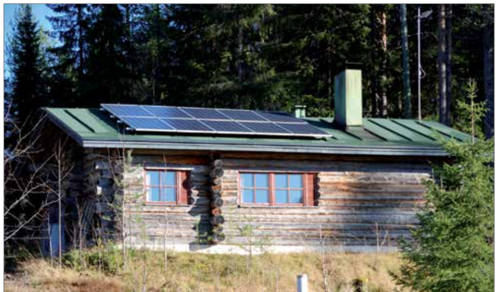
Kelosityönteeseen Kelo 24 vuokramökin katolle on asennettu 10 aurinkopaneelia. Paneelit tuottavat sähköä vielä lokakuussakin.

Paneelit ovat asennettu Oulun sähkömyynnin toimesta ja niihin Aten mökit Oy on saanut ELY-keskuksetta 25 prosentin avustuspäätöksen tämän kesän