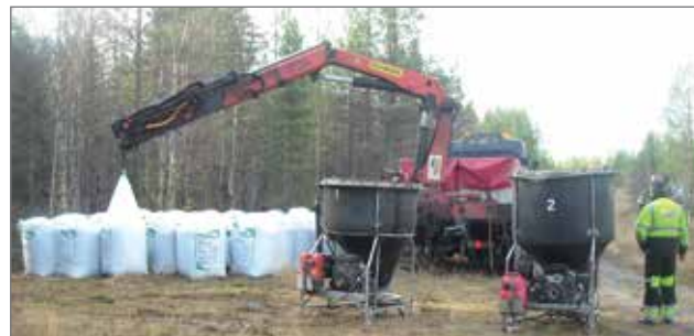
Lennon aikana siirrettiin lanta säkeistä kahteen levityssiiloon eli aina kun lentäjä tuli tyhjän siilon kanssa, oli täysi odottamassa.

Jari Kuukasjärvi, Teemu Leppänen Mhy Pudasjärvi