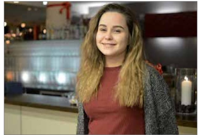
Ronja tykkää työskennellä ihmisten kanssa ja siksi hän kiinnostui alasta.

- Tämä ala sopii kaikille, jotka tykkäävät luonnossa liikkumisesta sekä asiakaspalvelutyöstä. Matkailuun on todella laaja, joten töitäkin on mitä erilaisimpia - niin kotimaassa kuin ulkomailla.