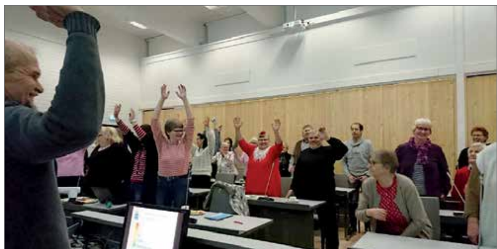
Osallistujille järjestettiin kokousliikuntaa äänestämällä: Jos olet todella paljon samaa mieltä väittämän kanssa, nouse ylös ja kurkota kädet ilmaan. Jos olet eri mieltä, mene penkissä niin kyrryyn kuin mahdollista.

Digitaaliset palvelut ovat myös koko maakuntauudistuksessa punaisena lankana. Tavoitteena onkin, että myös pitkien etäisyyksien kunnassa palveluja voidaan