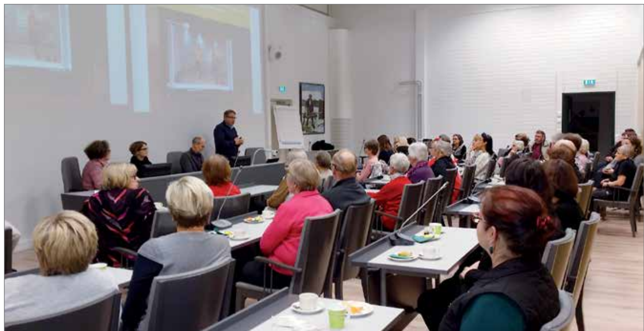
Kaupungintalon valtuustosali oli täynnä osallistujia.