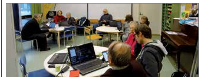
Tietsikka -infoon osallistujat syventyneinä tietotekniikan saloihin.

Hyvän mielen paikasta tilaisuuksineen on tarkoitus tehdä yhteinen kohtaamispaikka kaikille kuntalaisille riippumatta kenenkään lähtökohdista ja taustoista. Kaikkiin tilaisuuksiin voi uuden oppimisen lisäksi tulla vaikkapa vaihtamaan kuulumisia, kahvittelemaan ja tuomaan omia ideoita muiden kuultavaksi.