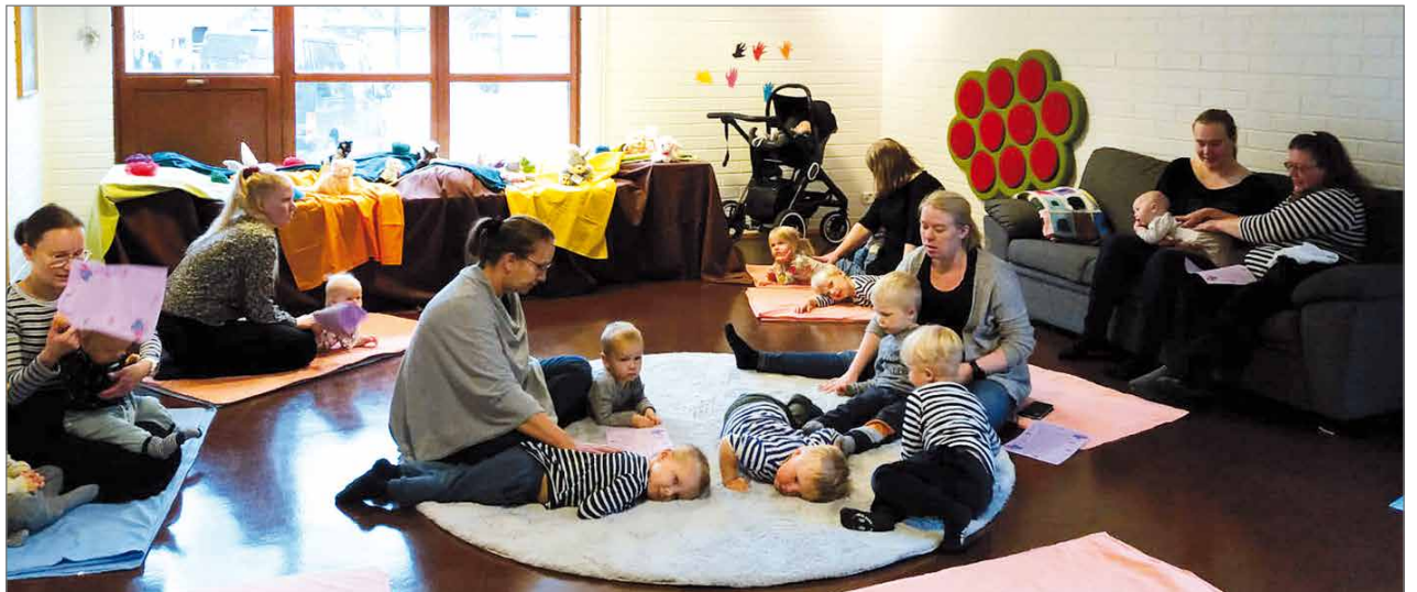
Tapahtumaan saapui parikymmentä aikuista ja lähes kolmekymmentä lasta.

Vauvan päivän ohjelmassa pienimmät oli huomioitu: aluksi oli aikaa vapaalle seurustelulle ja leikkimiselle päiväkerhon