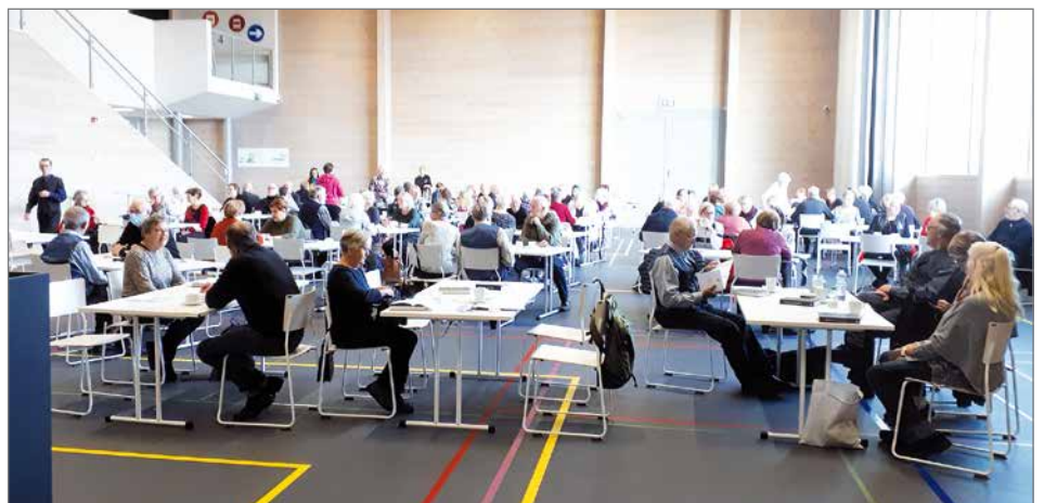
Keski-Suomen ja Pudasjärven Eläkeliiton väki kokoontui Lumiareenalla Syötteellä.