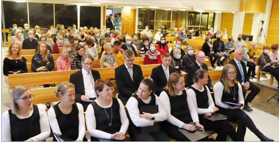
Konsertissa oli seurakuntakodin salissa noin 150 henkeä.