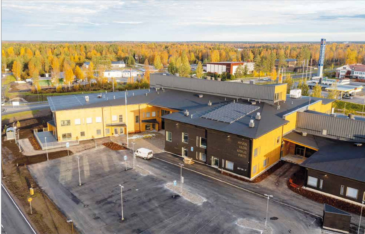
Hyvän olon keskus Pirtti ilmasta.