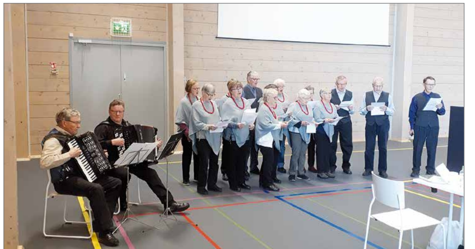
Kööri-kuoro ja säestäjät Väinö ja Leo viihdyttivät laululla ja soitolla.

Sointu Veivo.