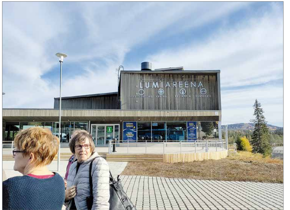
Sokkoretki suuntautui tällä kertaa Syötteelle, jossa Lumiareena palvelu kokoontumispaikkana.

Sadan henkilön täyttämällä Lumiareenalla vaihdettiin kokemuksia ja