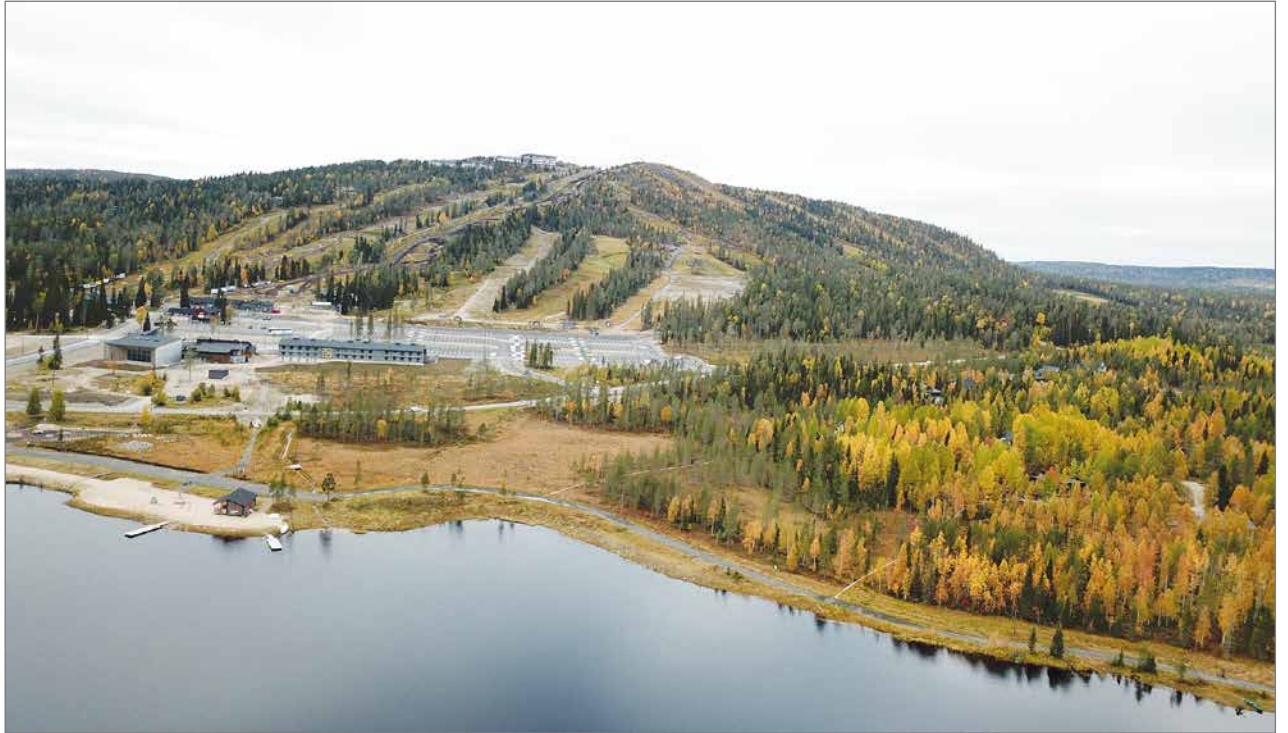
Uudet rinnekoneet mittaavat lumensyvyyden senttien tarkkuudella.

Kaikki uudet lumitykit ovat lance- eli pillitykkeitä. Myös koko aiemmin käytössä ollut puhallintykki-