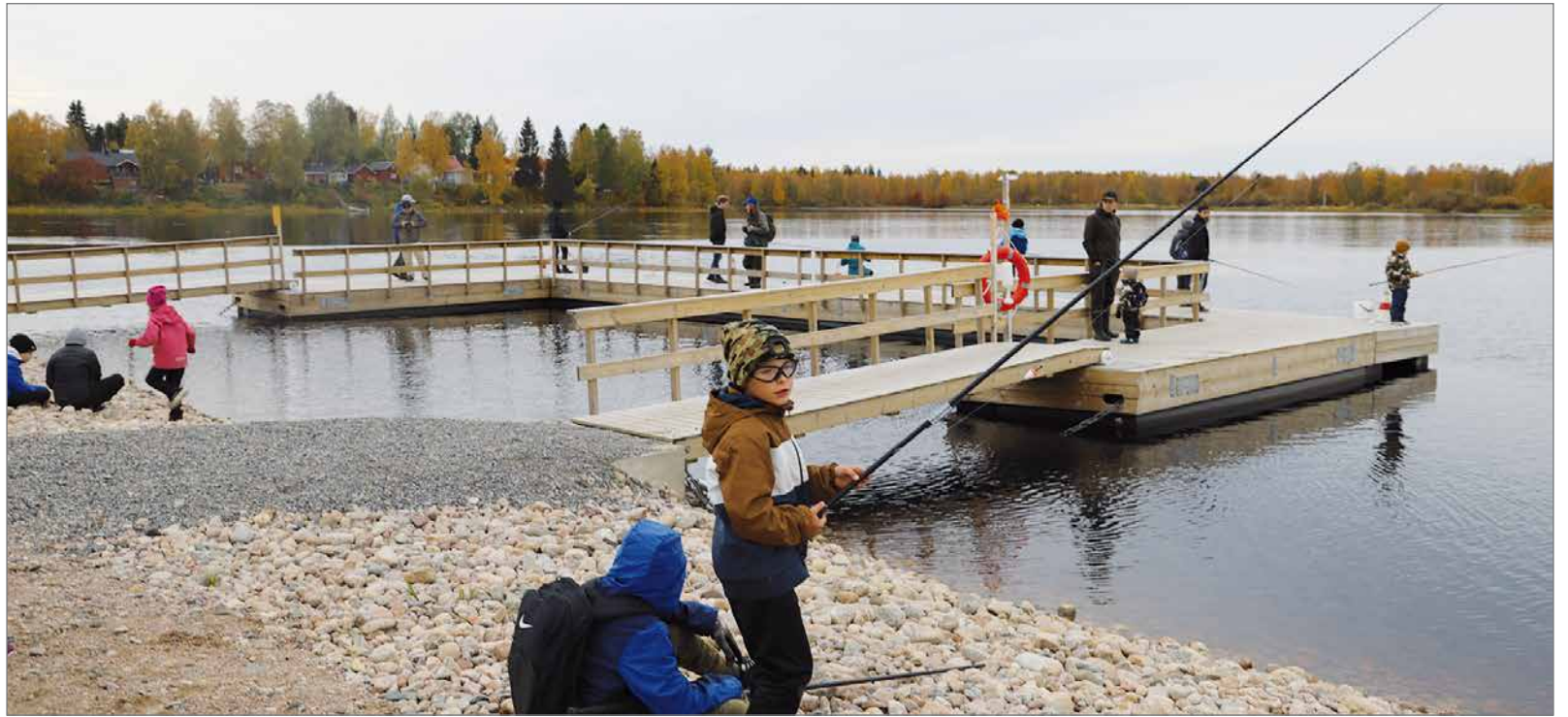
Pietarilaan lähikalastushankkeella rakennetulla kalastuslaiturilla järjestettiin Laiturionginnan sprinttikilpailu, johon osallistui kuusi kolmihenkiä joukkuetta.

Leppoisasti rannalla -lijoen virkistyskäyttö ja kalastuspaikat -hanke toteutui pääosin vuoden 2020 aikana. Hankkeessa rakennettiin mm. Rajamaan ja Pieta-