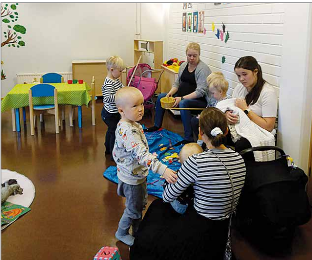
Vauvan päivää vietetään joka vuosi syyskuun viimeisenä perjantaina.

Pudasjärven seurakuntakodilla oli vilskettä perjantaina 24.9., kun seurakunnan varhaiskasvatus järjesti vauvaperheille suunnatun perhekerhon valtakunnallisen Vauvan päivän kunniaksi. Tapahtumaan saapui parikymmentä aikuista ja lähes kolmekymmentä lasta. Nuorin osallistujista oli vain muutama-