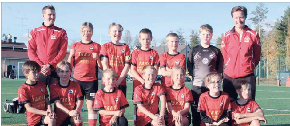
FC Kurenpoikien P11 joukkue pelasi kesällä jalkapallosarjaa piirin kakkostasolla.

Elokuussa joukkue pelasi sarjaturnauksen Limin-