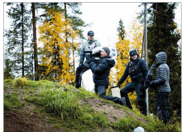
Kuvausryhmä Syötteen maisemissa, jossa kuviin saatiin mukaan luontoa, tunturimaisemia ja haluttiin havainnollistaa Suomen avaruutta ja etäisyyksiä.