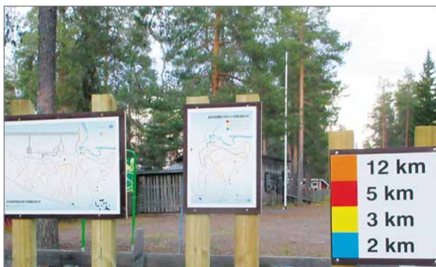
Jyrkkäkoskella on nyt uusin väritolppamerkein merkattuna kahden, kolmen, viiden ja 12 kilometrin ulkoilureitit. Reitien lähtöpaikalla huvikeskuksen vieressä myös uusi reititikartta, joita tulee myös reitin varrelle neljään eri paikkaan.

Niskanen näytti mallia, kuinka eri kalat fileroidaan.