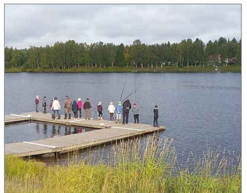
Virallisen uimakauden päätyttyä Lamarin koululaiset olivat tyytyväisiä päästessään onki- maan Rajamaan rannan uimalaiturilla.

Pertti Kuusisto/ Liikuntapalvelut, Valokuvat: Liikuntapalvelut ja Ella Viljamaa