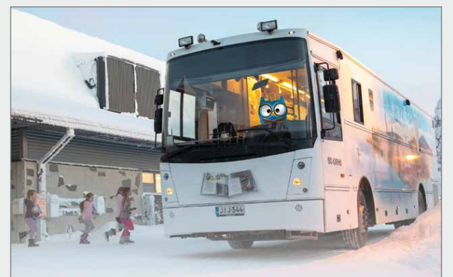
Kirjastoautossa sopivien kirjojen löytämistä helpottaa kirjojen selkämiksiin tehdyt merkinnät.

Pääkirjastossa on lasten- ja nuortenasastolla lukudiplomihylly, johon on koottu lukudiplomikirjoja. Kirjastoautossa sopivien kirjojen löytämistä helpottaa kirjojen selkämiksiin tehdyt merkinnät. Lukemista voi valita kiinnostuksen mukaan myös vinkki-