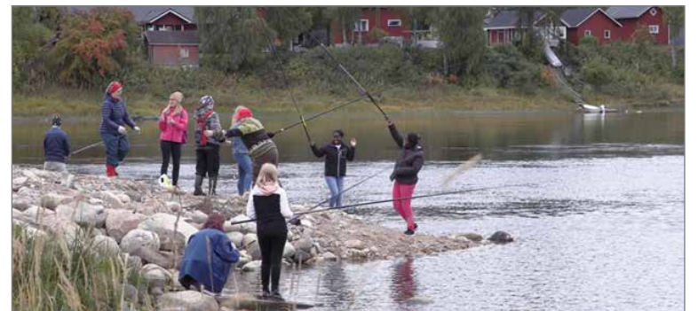
Pietarilan rannassa kiivaimmat kalan syöntihetket koettiin keskipäivän jälkeen.