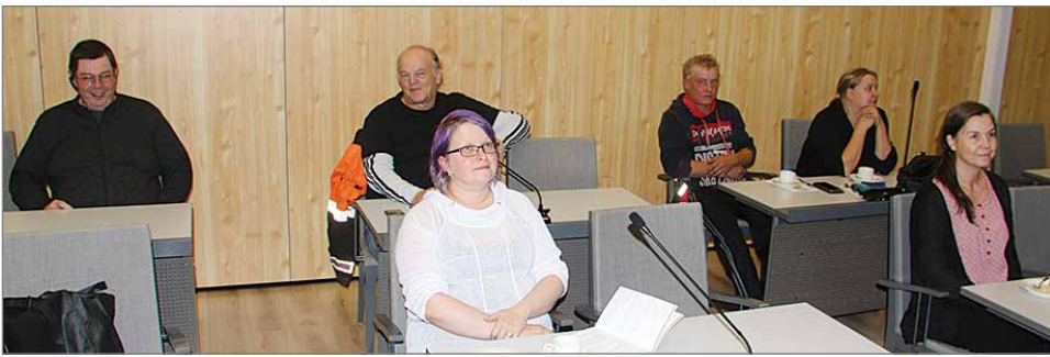
Rahoitusillassa oli kuulijoina kymmenkunta yrittäjää.