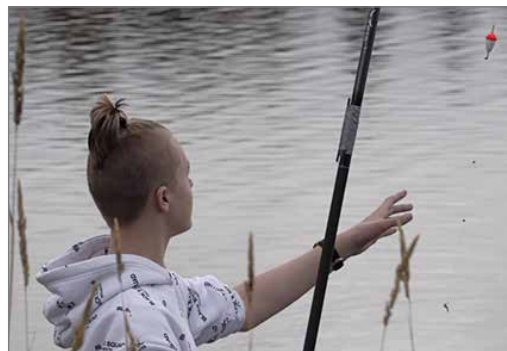
Vaikka rantaonginta on välillä tarkkaa puuhaa, siinä mieli rauhoittuu ja ylimääräiset kiireet unohtuvat.