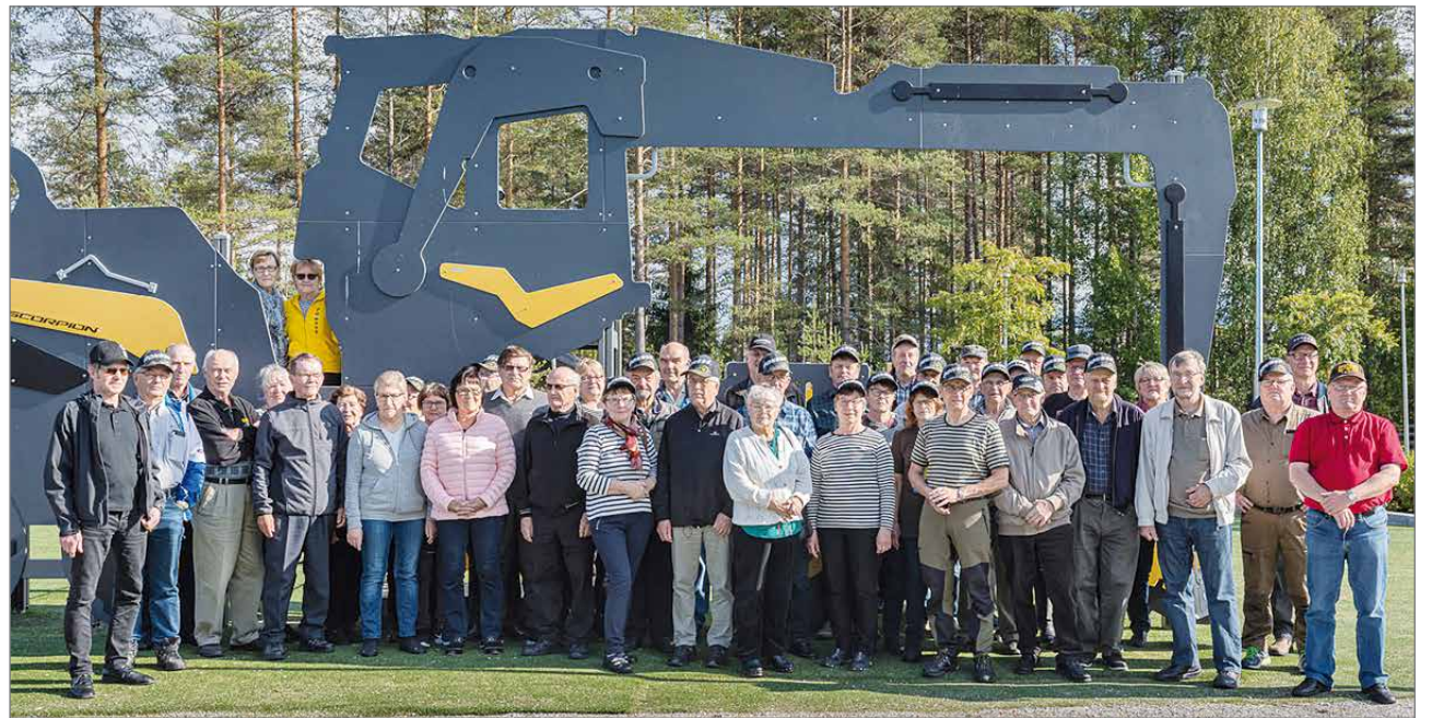
Retki Ponssen tehtaalle sai suuren suosion. Yhteiskuva otettu Einari Vidgrenin puistossa.

Seuraavana oli vuorossa tehdaskierros oppaan johdolla, jonka jälkeen joimme vielä pullakahvit ja kotimatkalte lähdettiin taas yhtä reissua