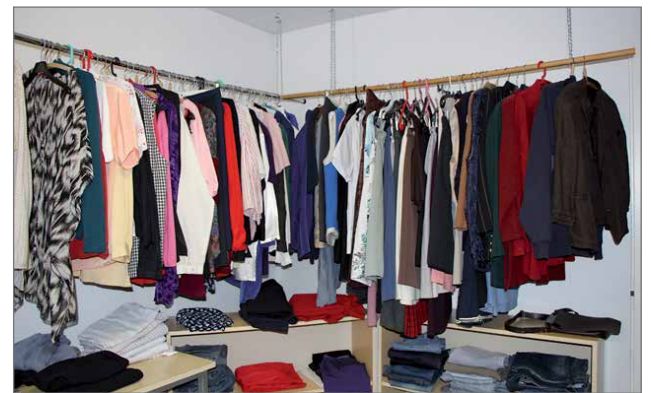
Kirpputorilta löytyy hyvää tavaraa halvalla.

Pudasjärven seurakunnassa on paljon erilaista