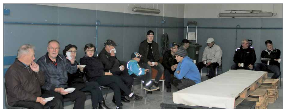
Pyttipannu ja munkkikahvit maistuivat avoimien ovien päivässä kävijöille.

Onnittelijoina kävivät muun muassa Pudasjärven kaupunki, Pudasjärven Yrittäjät ja Pudasjärven Kuorma-autoilijat sekä useita muita yhteistyökumppaneita ja eri yrittäjiä sekä yleisöä.