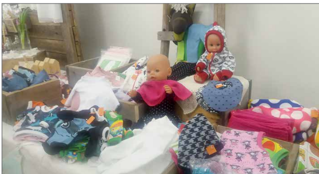
Tyrnäväläisten myyjäisistä löytyy laadukkaita nukenvaatteita ja muita käsitöitä. Kuva Minna Töllä.

Illalla kello 18 iltapalaksi tarjolla on aitoa Tyrnävän perunaa uuniperunan muodossa salaatin kera. Ohjelmassa on iltahartauden lisäksi musiikki- ja kuvaesitys, joka kertoo Tyrnävän kun-