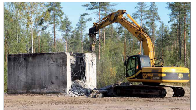
Tulipalon tuhoama Kuusamon puoleinen myymälän osa on raivattu ja siistitty. Raivauksen viimeisenä kohteena syyskuun puolessa välissä oli rakennuksen kulmassa sijainnut raudoitettu ja betoninen väestönsuoja.