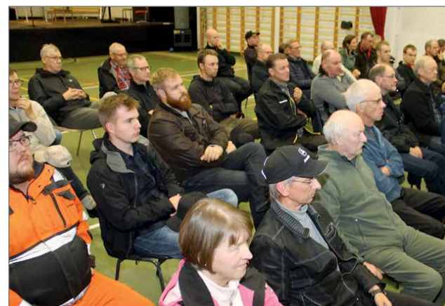
Esityksiä kuunneltiin tarkkaavaisesti.