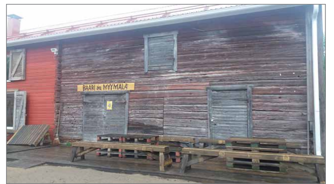
Hailuodon Panimon myymälä/baari.