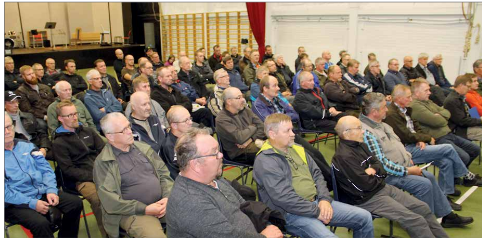
Hirvipalaveriin osallistui noin 80 metsästäjää.

Perinteinen hirvimiesten palaveri-ilta pidettiin 19.9. kansalaisopiston tiloissa. Paikalle oli saapunut noin 80 seurojen ja seurueiden luvanhakijaa ja yhdyskuntien sekä tulevia metsästyksenjohtajia.