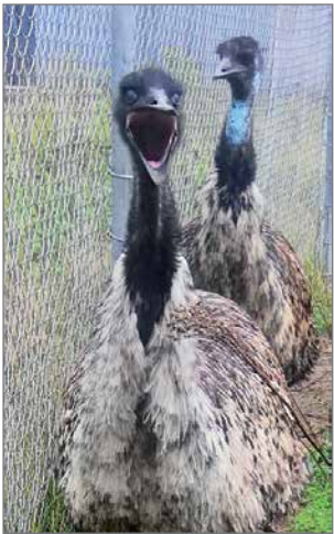
Emutkin olivat vierailusta innoissaan.

Kipinän kyläseura teki syysretken Hailuotoon 15.9. Matkalle lähdettiin kipinästä aamulla linja-auton ollessa lähes täynnä ja sään ollessa hyvin syksyinen. Olimme Oulunsalossa hyvissä ajoin ennen lautan lähtöä. Matkustajat viihtyivät linja-autosta satamassa, muutama rohkea kuitenkin uskaltanut ulos uhmaamaan tuulista säätä.