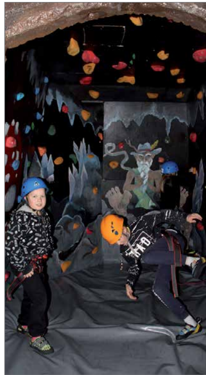
Boulderointi luolassa sai kiipeillä ylös ja sivuille.