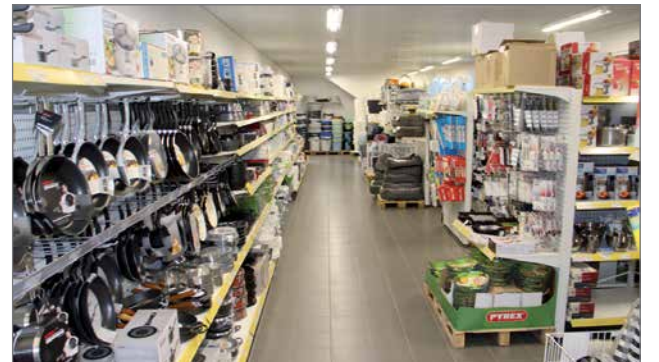
Talous- ja kausitavaroiden puoli myymälästä säilyi lähes kokonaan, mutta tavarat myydään kuitenkin tyhjennysmyynnissä puoleen hintaan.