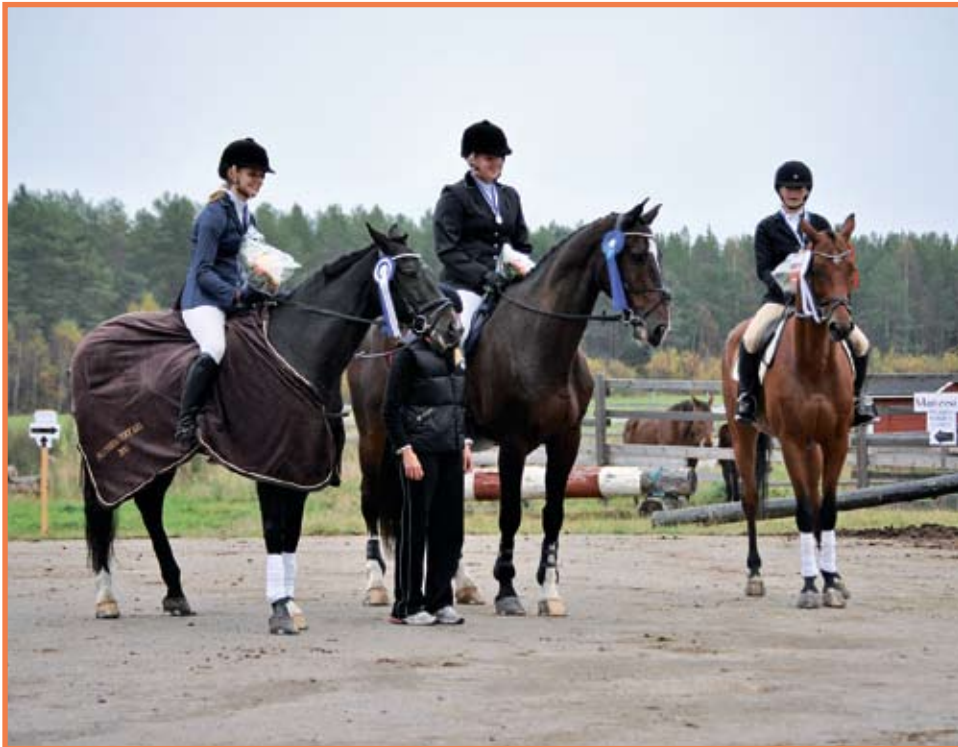
Junioreiden mestaruuskolmikko poseraa onnellisena ammattiopiston pihalla.

Pienen seuran Pudasjärven Ratsastajien ja Oulun seudun ammattiopiston paikallisen yksikön viikonloppuna 24-25.9 yhteistyönä tuotetut kenttäratsastuksen kilpailut sekä juniorien ja nuorten SM-kisat saivat kiitosta Etelä-Suomea myöten.