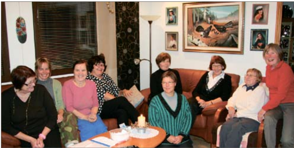
Sienikeiton ja -salaatin sekä talon emännän laittamien muiden herkkujen nauttimisen jälkeen istuttiin keskustelemaan lionspalvelutoiminnasta ja vaihdettiin muitakin ajan-kohtaisia kuulumisia.