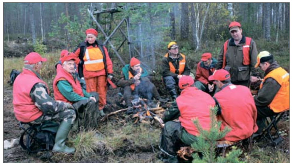
Metsästyksen ohella ennätettiin paistamaan nuotiolla grillimakkaraita.