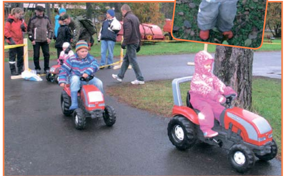
Polkutraktorit olivat kovassa käytössä koko päivän.

varten oli järjestetty talutusratsastusta, polkutraktoriajtoa, pieneläinnäyttely (4H ja yksityiset) ja esterata. Musiikkipuolellakin lapset saivat oman konsertin lastenlauluduo Mamma ja mesikämmen esittämänä.