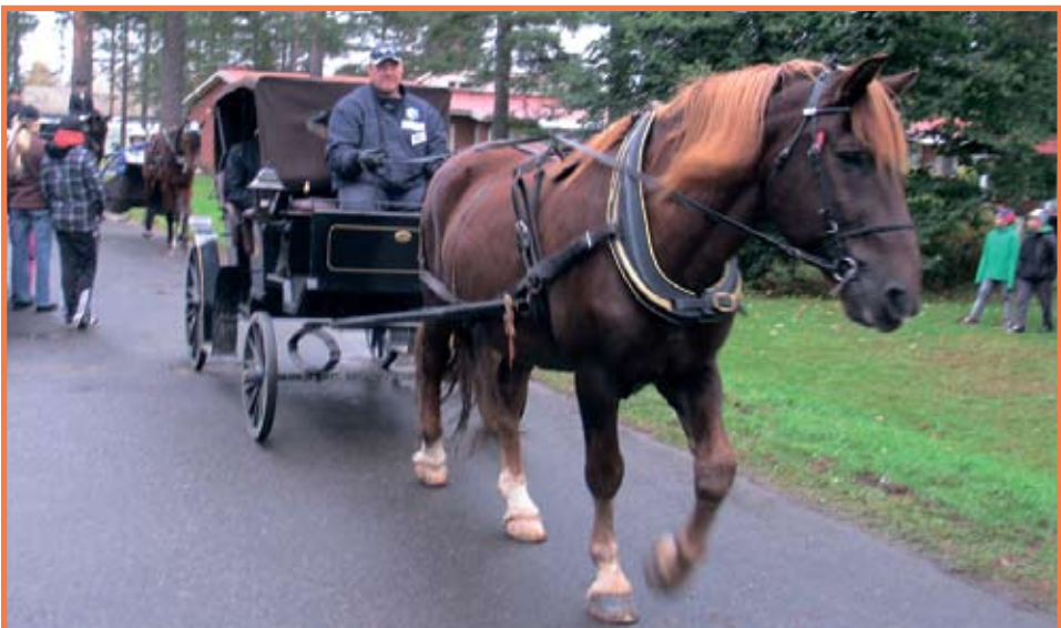
Hevososastolla oli näyttävin esiintulo. Kiesien sisällä matkustivat johtajat.