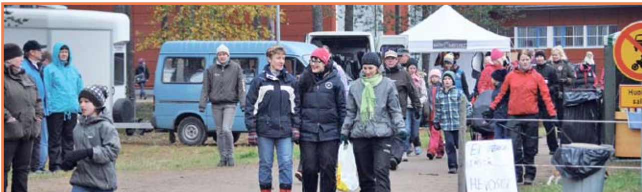
Yleisö sai nauttia sekä mukavasta syysäästä, hienosta ratsastuksesta että myyntitelttojen tarjouksista.