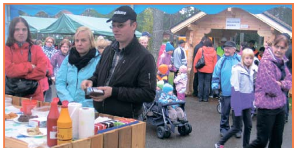
Cafe Heinämiehessä riitti asiakkaita koko päivän. Taustalla grillikota.