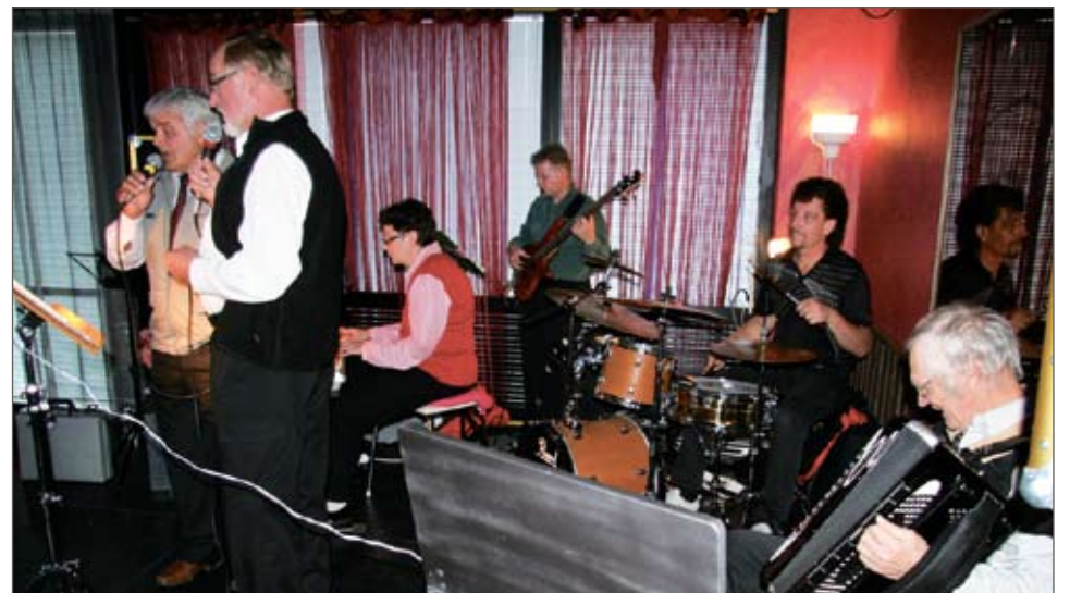
Iltapäivätansseissa soitti hyvää tanssimusiikkia pudasjärveläinen Suopunki-yhtye.