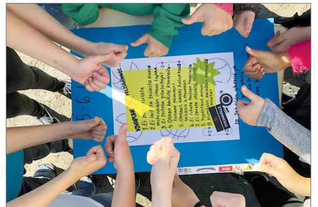
Pelisäännöt olivat esillä Hirvaskoskella vierailtaessa.

ton taustoista. Toisaalta suunnittelussa ja toteutuksessa mukana olleet tukioppilasnuoret ovat huomanneet, että tällaiset päivät ovat omiaan hälventämään myös alakouluilaiden kohdistamia ennakkoluuloja yläkoululaisia kohtaan. Yksi tukarinuorista tiivistikin tämän hyvin yhden teemapäivän päätteeksi: "Niillä (alakouluilaisilla) ei oo sitten niin pahoja ennakkoluuloja yläkoululaisia kohtaan, kun ne näkee täällä, että meidän ollaan mukavia, eikä yhtään pelottavia!" HT