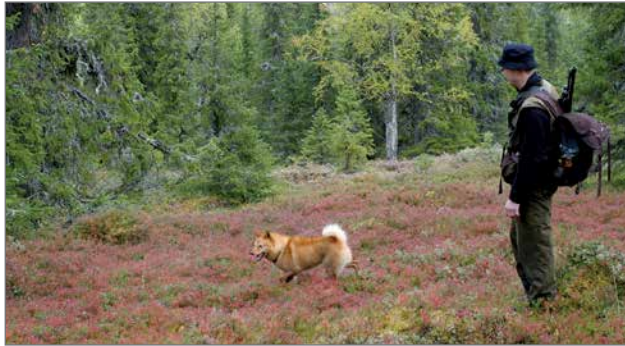
Suomenpystykorva on lähinnä puuhun lintua haukkuva koira, joka haukullaan ilmaisee, missä riista kulloinkin on.

Näitä ominaisuuksia, eli muun muassa koiran haku- ja haukkutyöskentelyä sekä linnun seuraamista, arvioidaan ja pisteytetään kaksi-