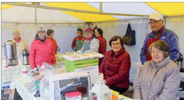
Taivalkosken eläkkeensaajilla oli markkinoilla palvelemissa aktiivinen noin 20 hengen joukko, jotka vastasivat teltan toiminnasta kahdessa vuorossa.