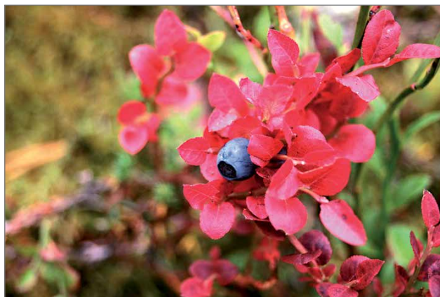
Syötteen luonnosta löytyy myös runsain mitoin antia marjastajille.

Syötteen luontokeskus sijaitsee kansallispuiston portilla, josta on helppo suunnata retkille vaarattomien monipuolisille reiteille. Luontokeskus pitää sisällään tällä hetkellä kahvila-ravintolan, auditorion ja näyttelytilan. Lisäksi retkeilijät saavat luontokeskuksesta opastusta ja infoa ja jopa retkeilyvälineitä vuokralle. Metsähallituksen luontopalvelut on viimeisen kolmen vuoden ajan vastannut koko talon