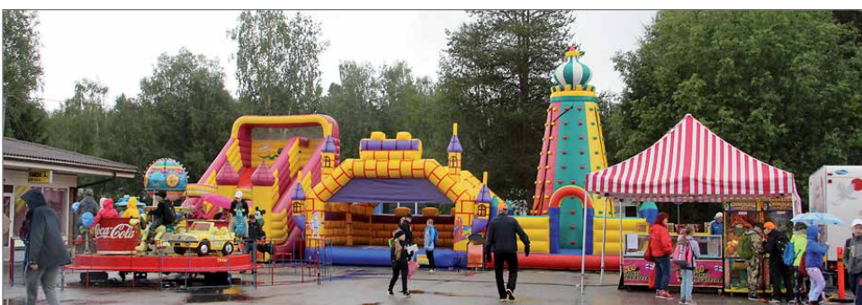
Lapsille oli ilmainen tivoli kumpanakin markkinapäivänä.