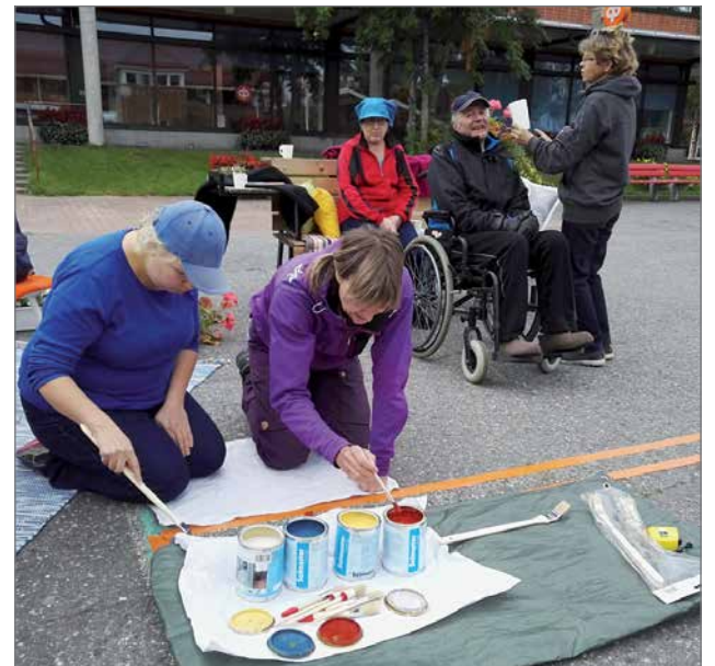
Peliruudukkojen maalaus käynnissä.