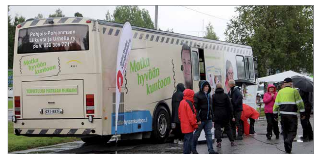
Pohjois-Pohjanmaan liikunnan bussissa oltiin valmiita keskustelemaan uusia liikeideoita, annettiin tietoa yrittäjyydestä ja apua sen kehittämiseen sekä tunnettiin huolta työkäisten hyvinvoinnista ja työkuunnosta.