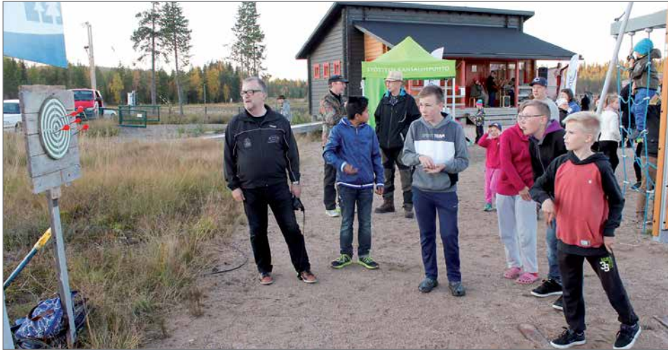
Mökkiläisyhdistys on järjestänyt Syötteen tikkakisan usean vuoden ajan.

paa-ajanasukkaiden edunvalvontaan keskittyvä yhdistys ja seuraamme ajankohtaisia uutisia herkällä korvalla. Uutinen kaivoshankkeesta on asia, jota seuraamme aktiivisesti. Samoin vireillä on maisemointiin liittyvät asiat parin vuoden takaisten kaivaustöiden jäljiltä. Tienvarret ja sähkökaapin ympäristöt eivät houkuttele matkailijoita eivätkä lisää alueen matkailu-