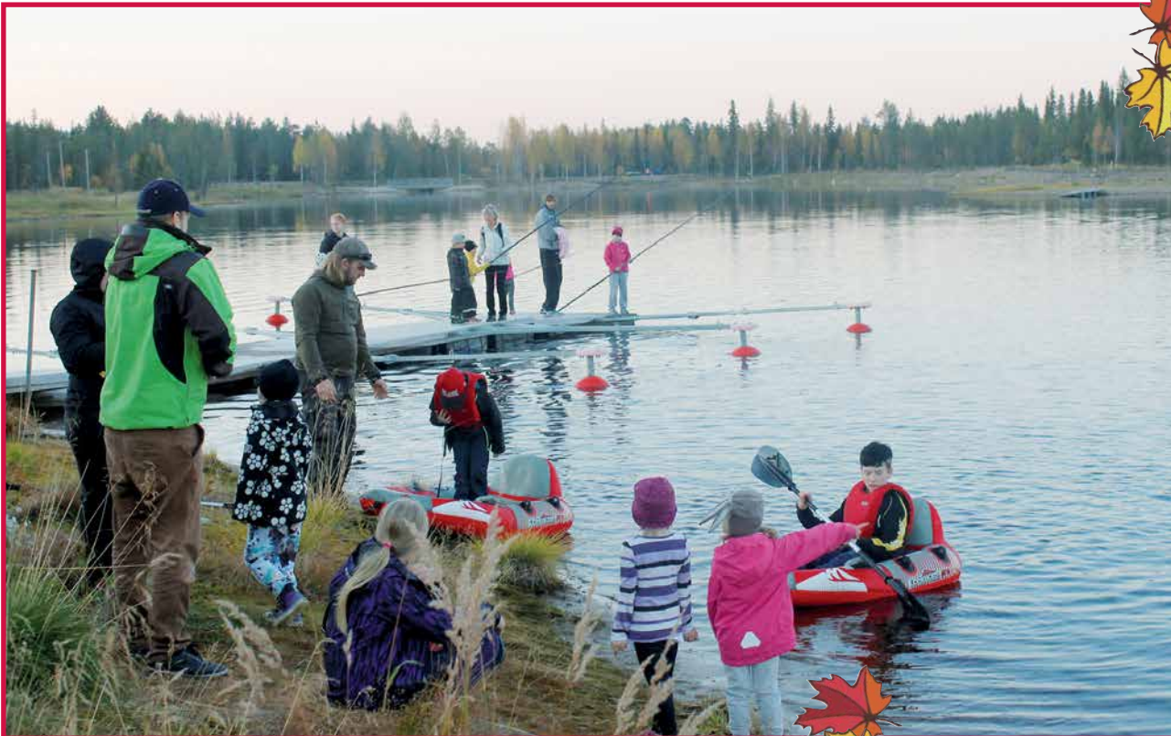
Luppovesi palaa tapahtuman ohjelmassa on huomioitu koko perhe.