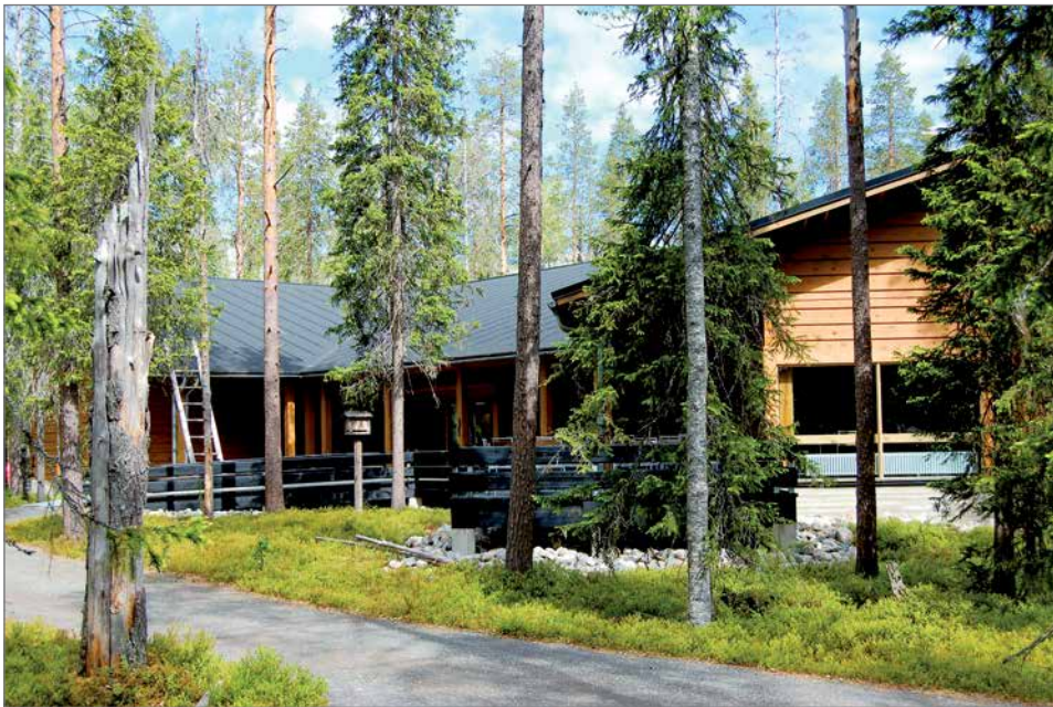
Luontokeskus kesällä.

- Haemme tiloihin yrittäjää, joka ottaa ensisijaisesti vastuulleen kahvila-ravintolan palvelujen pyörittämi-