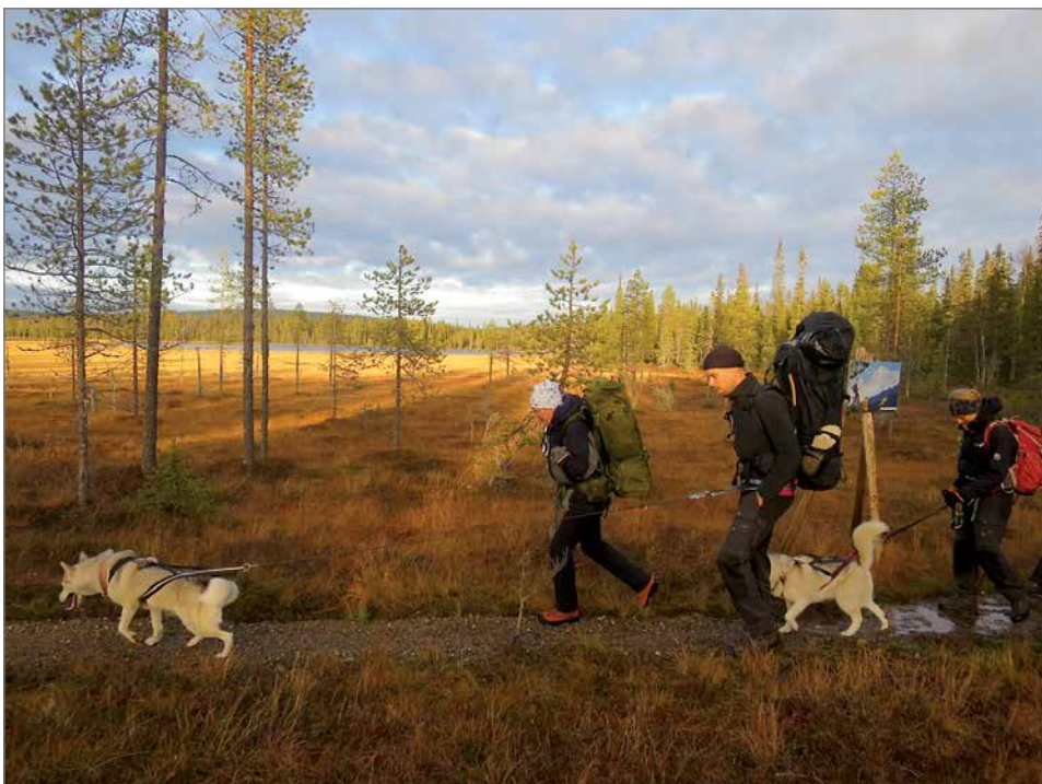
Rytivaarankierroksella patikoimassa syksyllä.

jiydestä kiinnostuneet voivat olla yhteydessä asiakaspalvelupäällikkö Irja Leppäseen. Hakemukset liiketoimintasuunnitelmineen tulee jättää 12.10.2018 mennessä. HT