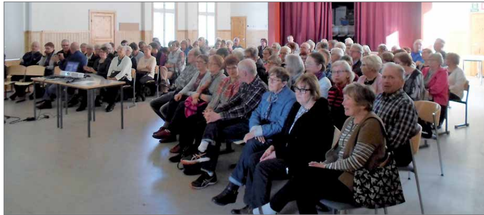
Eläkeliiton järjestämä avoverenkierronhäiriöt ja siihen liittyvien oireiden tunnistaminen -luento Suojalinnalla oli yleisömenestys, kuulijoita oli 125.

Esityksessä tuli hyvin kuvattuna se hoitokehitys, joka tulisi toteuttaa parhaimmillaan, jos avoverenkierron häiriö ilmaantuu meille ke-