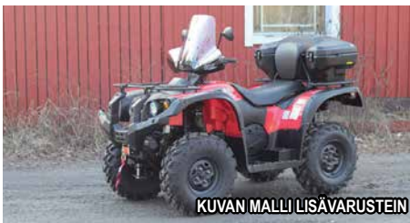
KUVAN MALLI LISÄVARUSTEIN

TRAPPER TRAKTORIMÖNKIJÄT OVAT SUORAAN TRAKTORIKSI TEHTAALLA VALMISTETTUJA.