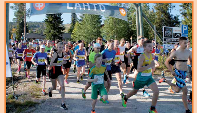
Huippukymppi juostaan yhdeksännen kerran. Juoksussa on runsaasti sarjoja ja kuntosarjoissa matkan voi kävelläkin.

tuman järjestäjän Pudasjärven Urheilijoiden piirissä on ennakoitu, että kuka tahansa selvästi alle 30 minuutin kympin juoksija pystyy tavoiteajan miehissä alittamaan.