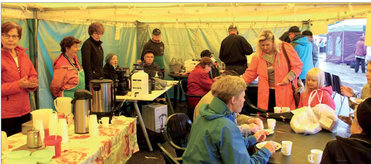
Eläkeliiton Taivalkosken yhdistyksen teltalla oli vilkasta. Muurinpojalettuja valmistui kahvin kanssa nautittavaksi, arpa- ja osallistettiin ja oli myös monipuolista myytävää.