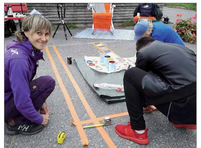
Peliruudun teko oli tarkkaa puuhaa.