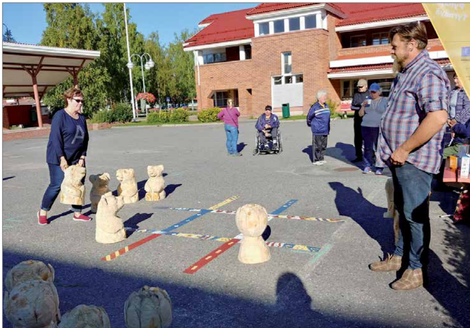
Karhut ja hillat pelinappulat oli veistetty moottorisahalla tuoreesta männystä ja ne ovat vieläkin torilla säilytyslaatikossa.