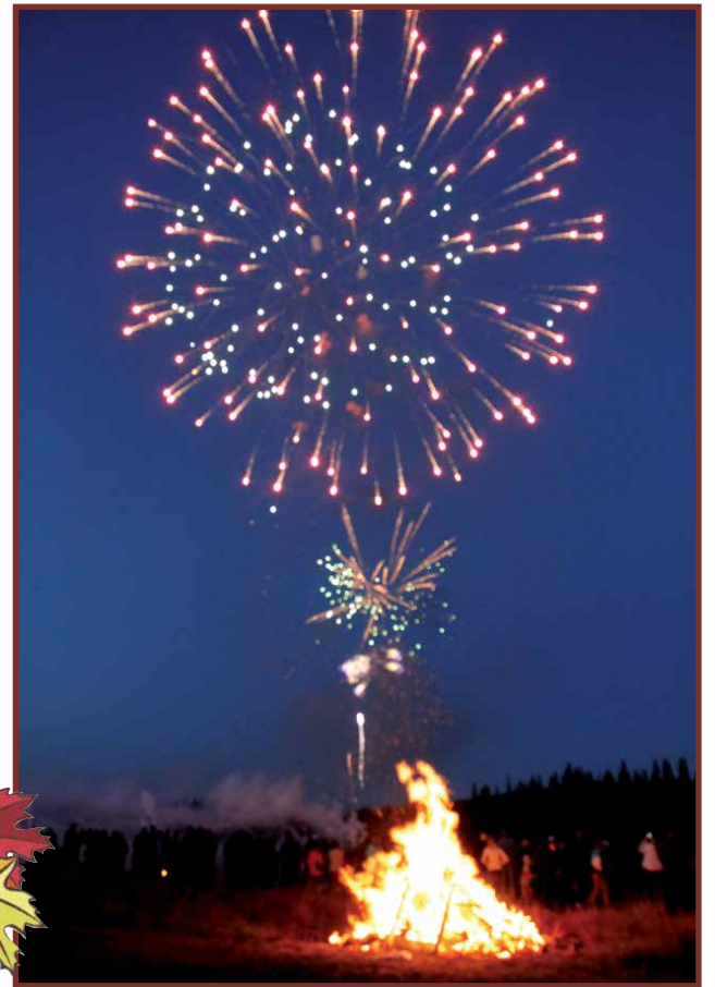
Luppoveden rannalla on luvassa runsaasti ohjelmaa mm. kokko ja iletulitus.

Tervetuloa koko perheellä nauttimaan ruskasta Syötteelle!