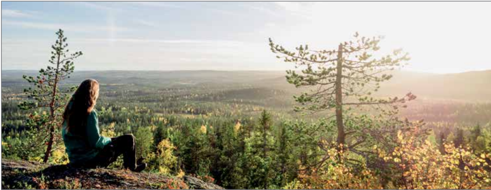
Syötteellä on juuri nyt parasta ruska-aikaa.

Vaarametsien maana tunnettu kuusikkometsäinen Syötteen kansallispuisto tarjoaa erinomaiset mahdollisuudet nautiskella ruskan väreistä sekä syysmetsän herkullisista antimista. Retkeilijöille löytyy useita eri vaihtoehtoja päiväpatikoinnista useamman yön kestoiseen vaellukseen. Vanhojen kuusikoiden kätköistä voi poimia korin täydeltä kotiin viemisiä, sillä kansallispuistossa marjojen ja ruokasienien keruu on sallittua. Vauhdikkaasta menosta pitävät löytävät erilaisilta pyöräilyreiteiltä omat huippupaikkansa ja Pärjänjoella syyssateet nostattavat vedenpintaa niin, että melojillekin riittää vauhtia. Syötteen seudulta ja kansallispuiston eri osista löytyy sopivin välimatkoin siististi pidettyjä taukopaikkoja moneen eri tarpeeseen. Metsähallituksen ylläpitä-