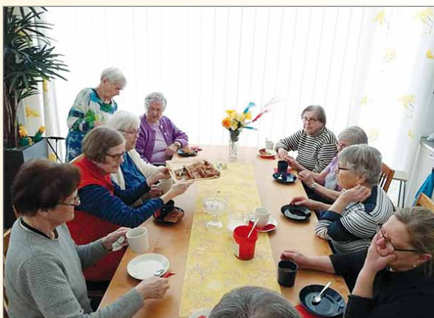
Kaupungin kartanon pääsiäisajan tilaisuudessa oli runsaasti väkeä. Osa kahvitteli toisen pöydän luona.