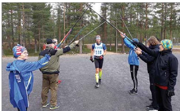
Jorma sai satasen täyteen viimeisten minuuttien aikana.