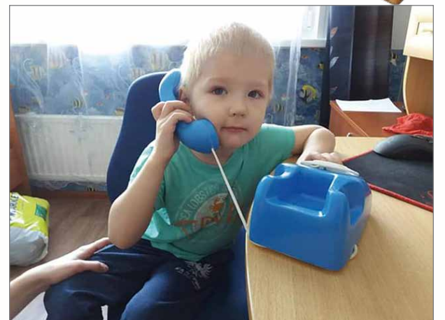
Joku mies Kesselistä toi meille sopivat talvikengät ja vielä minulle tämän puhelimen!