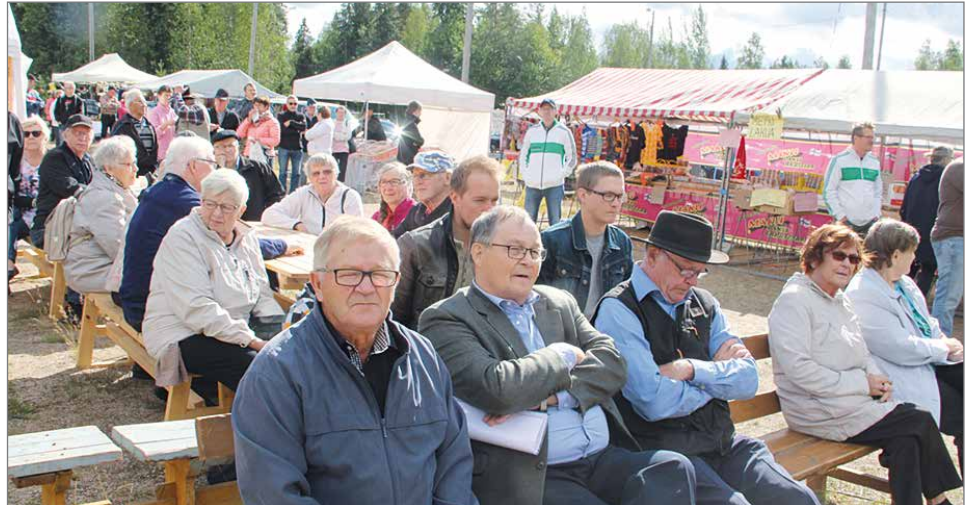
Sarakylän Vattumarkkinoilla on jo 30-vuoden historia.

SPR:n toiminnassa on mm. ensiaputoimintaa, Reddy