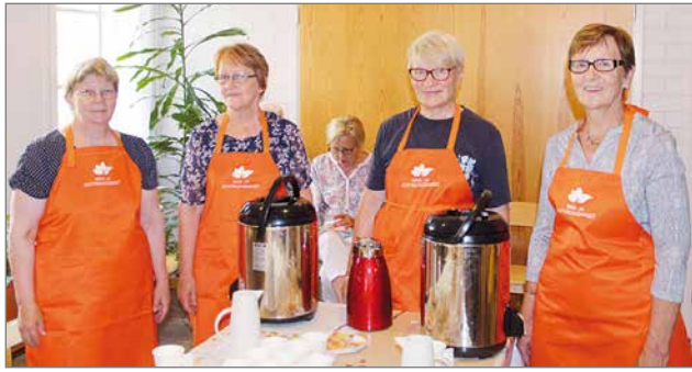
Pudasjärven Maa- ja Kotitalousnaiset ovat hoitaneet vuosikymmenten ajan Kotiseutujuhlan kahvitarjoilun.

Tieasiat ja erityisesti sora-tenien kunto puhututtaa sivukyläasukkaita. Suurin osa teistä kuuluu ELY-keskukselle. Osa tiekunnista osa on järjestäytymättä ja tähän ollaan kaupungin puolella miettimässä apukeinoja. Valmistelu on vielä vaiheessa.