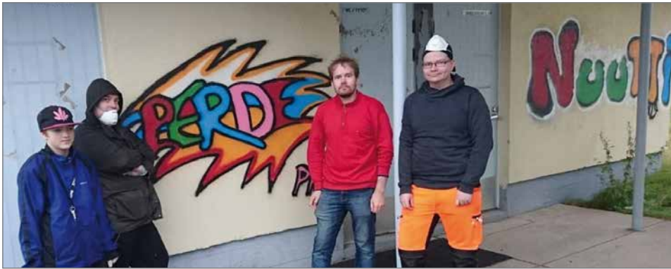
Taidetta syntyi useaan seinään.