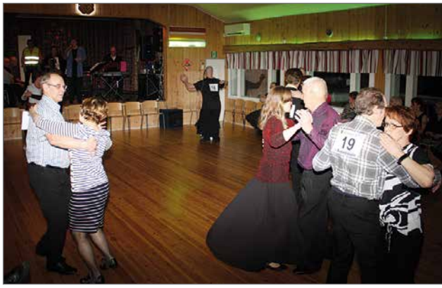
Pintamon kylätalolla on vilkas tanssitoiminta, tänä syksynä myös tanssikursseja.

Jongulla toiminta on yhtä aktiivista kuin ennenkin. Avoimet kylät -päivänä kesäkuussa pidettiin Jongun järven vetouistelukilpailu. Haukia lähti 350 kg. Kajaantilainen yritys osti saaliin. Osakaskunta ja kyläyhdistys tekevät yhteistyötä. Toimintaan kuuluu muun muassa oma kalalampi. Vesien kunnostukseen liittyen ELY on tekemässä kasvillisuus selvitystä. Metsäkeskus selvittää ojitusasioita. Suunnitteilla on Jongun ympäriajo polkupyörillä. Paukkerin vanha koulu toimii kylätalona ja tällä hetkellä on yhdeksän työllistettyä ja kuntouttavassa työtoimintaa olevaa henki-