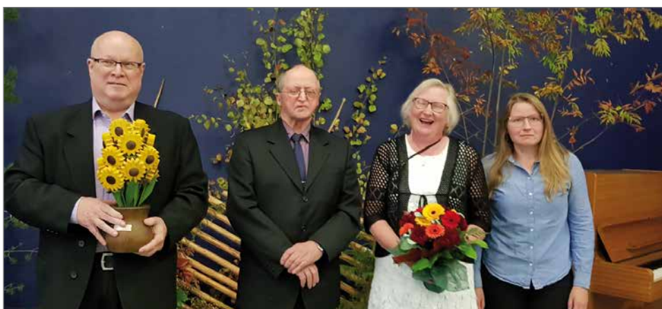
Jongun kylä palkittiin vuonna 2018 Pohjois-Pohjanmaan Vuoden Kylänä.