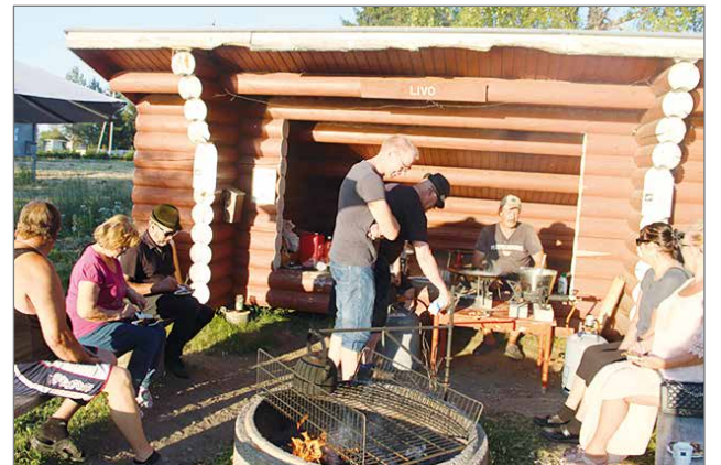
Livolla on kesäisin tullut perinteeksi Lettukestivaalit, jossa käy väkeä päivällä ja yöllä.

Vesien kunnostukseen liittyviä suunnitelmia on menossa. Panumanjärven ja Panu-