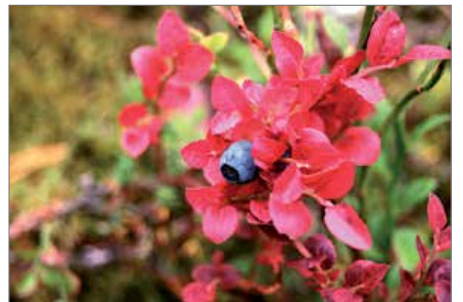
Syötteen luonnosta löytyy myös runsain mitoin antia marjastajille.

Luontokeskuksen pysy-vä näyttely Lastuja selkosilta kertoo luonnon ja kulttuurin historiasta Syötteen selko-silla. Syys-lokakuun vaihtuvana näyttelynä on met-säteknikko Pentti Väänänen ainutlaatuisista valokuvis-