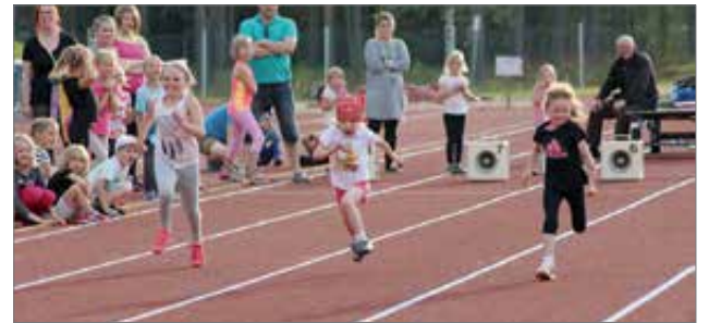
Hippo-kisoissa 08-09 -syntyneillä tytöillä kelpasi pinkoa Suojalinnan urheilukentän uusittua juoksurataa pitkin.