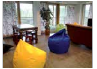
SyöteResortin nuorisotilat ovat saaneet uutta ilmettä uuden yrittäjäkaksikon uudistusten myötä.