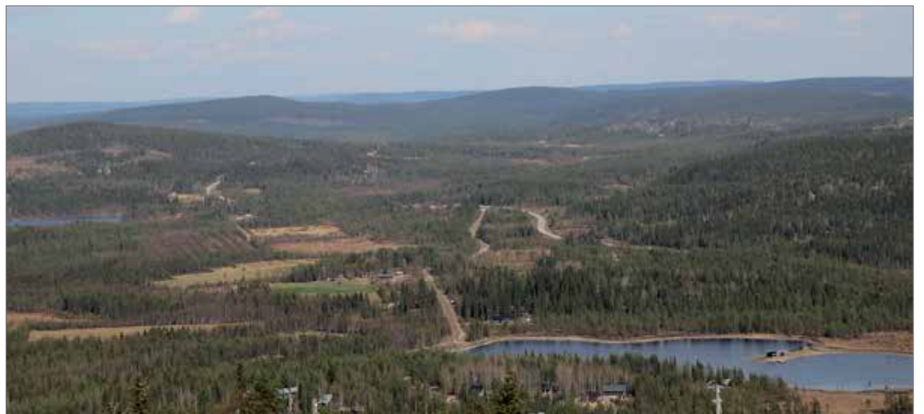
Komeat maisemat tunturin laelta Syötteen alueelle.