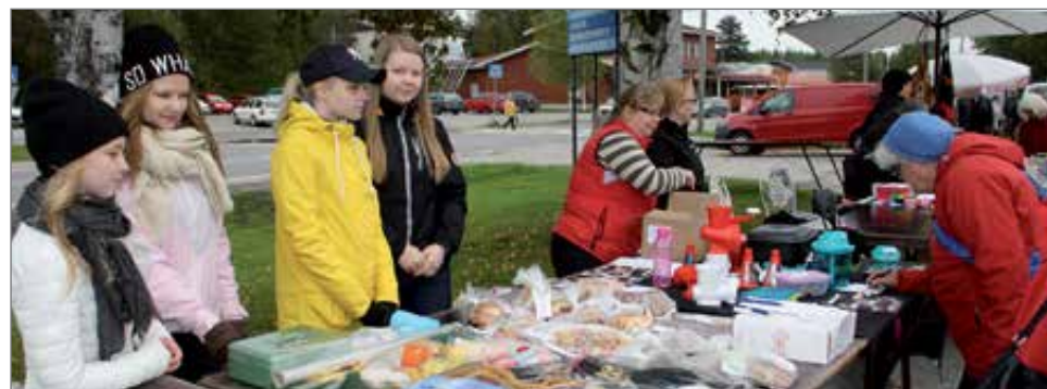
Taivalkosken lukiolaiset hankkivat matkarahaa vierailukseen saksalaisissa ystävyysluokissa.