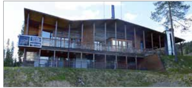
Pärjäkievari komeilee Iso-Syötteen takarinteiden alla.