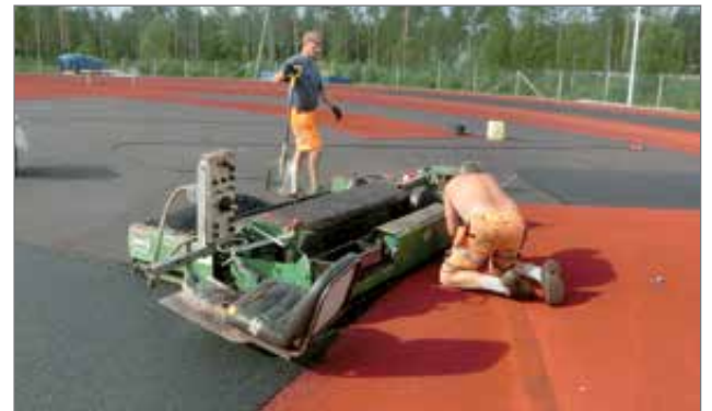
Novotan-massan levityskone puksutti hitaasti tasoittaen uutta pintaa tarkasti vanhan pinnan kanssa samalle tasolle.