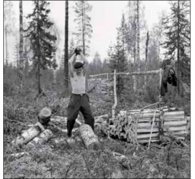
Näyttely Pentti Väänänen valokuvista on esillä Syötteen luontokeskuk-sessa lokakuun loppuun saakka.

Näyttelyn kuvat ovat Suomen Metsämuseo Lus-ton kokoelmista ja se on esillä Syötteen luontokeskuk-sessa 10.9. alkaen lokakuun loppuun saakka. Luontokeskus on avoinna syyskuussa keskiviikosta sunnuntaihin kello 10-16 ja lokakuussa