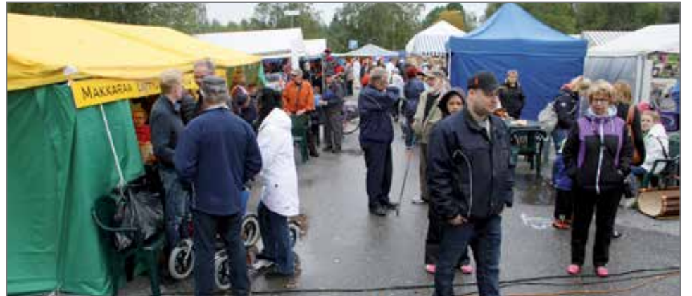
Taivalkosken Elomarkkinat järjestettiin 23. kerran ja väkeä saapui tuttuun tapaan runsaasti.