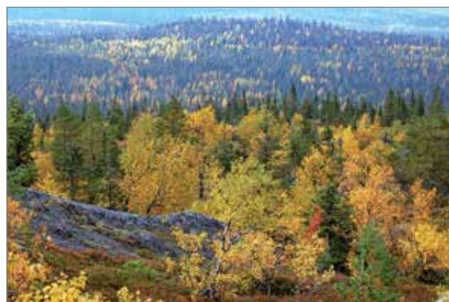
Syötteen ruskamaisemat lumoavat luonnossaliikkujat.