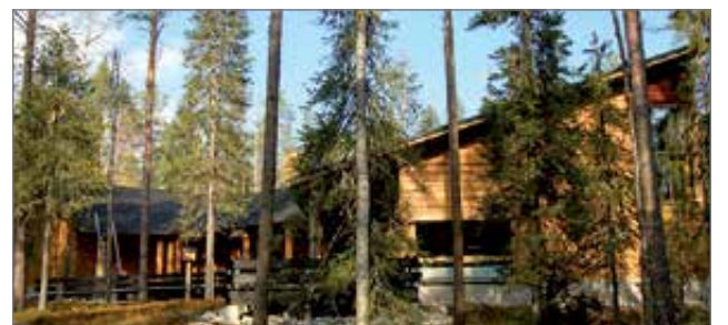
Luontokeskus ruskaluonnon ympäröimänä.

Lisätietoja: Syötteen luontokeskus p. 040 583 1608