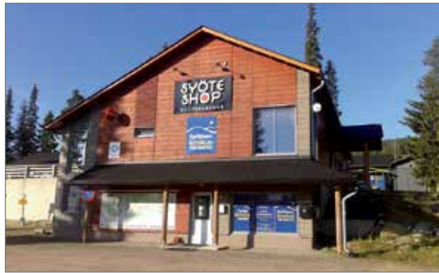
Syötteen Keskusvaraamon tilat löytyvät tuttuun tapaan SyöteShopin alakerrasta.

- Olemme jo valmistautuneet hyvissä ajoin talvikautteen, ja kaikki mökit ovat valmiita varattavaksi. Varauksiakin talvelle on jo tullut. Lisäksi koko alueen yhteistä syote.fi -sivustoa uudistetaan ja päivitämme myös omia syote.net- sivujamme mm. uusien mökkikuvien osalta. Nyt