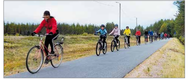
Maanantaina 6.9. järjestettiin Piispanpyöräily seurakuntatalolta kirkolle. Tapahtumaan osallistui vajaat neljäkymmentä pyöräilijää.