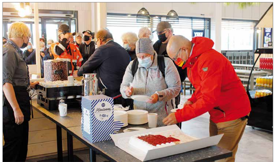
Asiakkaille oli tarjolla ilmaiset kakkukahvit avajaisten kunniaksi.

- Vaikka Koillisportista oli haikaa lähtee, olemme kaikki odottaneet innolla uutta liikennemyymälää. Uusissa, nykyaikaisissa tiloissa voimme palvella omistajia yhä paremmin ja monipuolisemmin. Omistajien toiveita on kuunneltu tarkalla korvalla ja esimerkiksi ravintolastamme saa nyt paljon toivottua pitsaa. Pudasjärveläisten luottamus Arinaan ja sen palveluihin mahdollistivat investoinnin tähän uuteen liikennemyymälään ja me arinalaiset puolestamme haluamme tarjota omistajillemme parasta mahdollista palve-