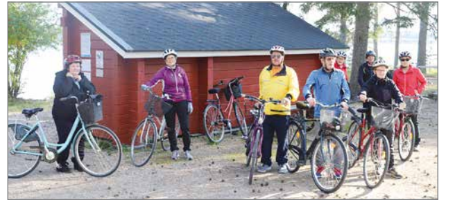
Pudasjärvellä osallistuttiin Valtakunnalliseen pyöräilyviikkoon kunto- ja urheilu- jaoston järjesti pyöräilytapahtuman sunnuntaina 5.9.

Eivät pyöräilytempaukset yhteen kertaan jääneet. Kuluvan viikon maanantai-iltana seurakunnan aktiiviset työntekijät järjestivät Piis-