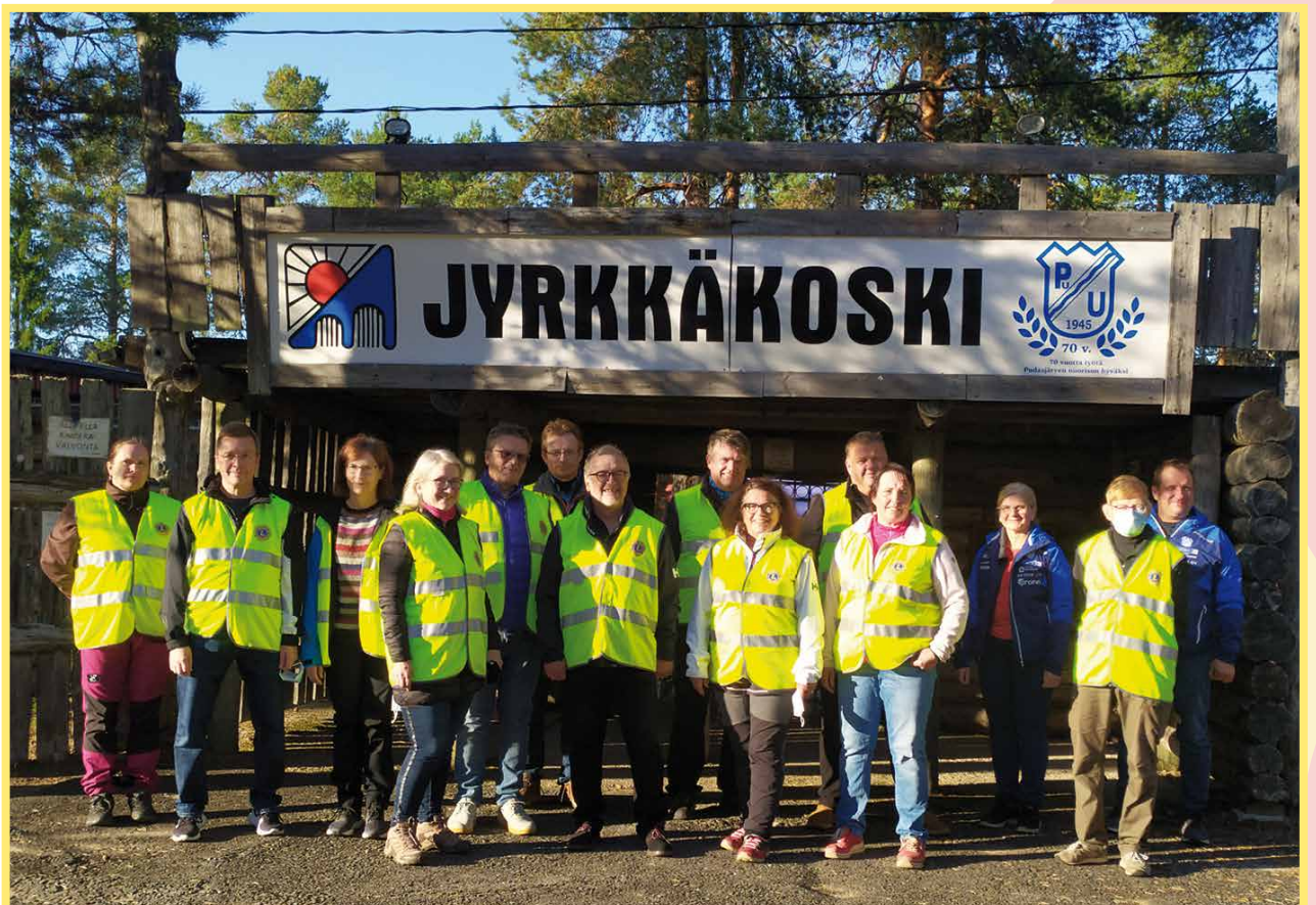
Illan talkootyöhön osallistuneet leijonat kokoontuivat illan aluksi Pudasjärvi-viirin nostamiseen salkoon.