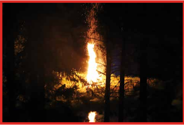
Venetsialaiskoko roihusi komeana Jyrkkäkosken rannassa.