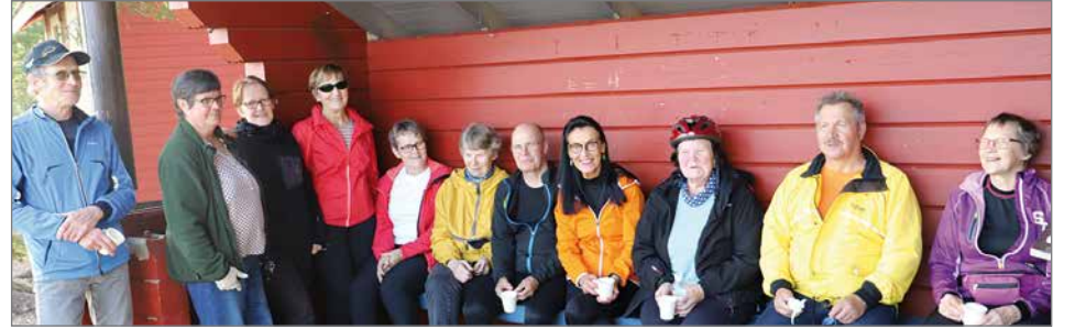
Pudasjärven rannan laavulla oli virkistys- ja lepotauko. Samalla maistuivat kuntourheilu- jaoston tarjoamat nuotiopannukahvit ja grillimakkarat.