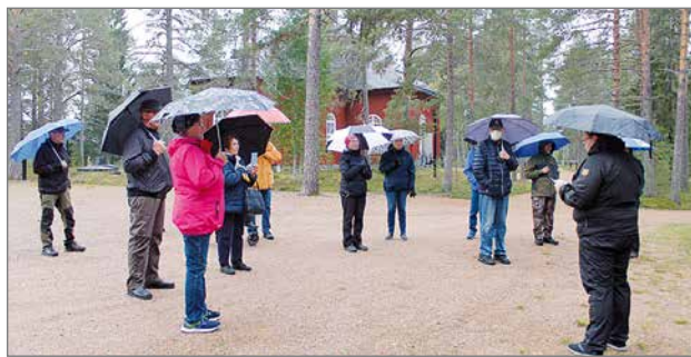
Sateisesta syysilmasta huolimatta Inkeroinen esittelyä saapui kuulemaan mukavasti porukkaa, jotka myös omilla muisteloillaan täydensivät kertomuksia - tapahtuman hengen mukaisesti.

Sunnuntaina 12.9. messu kirkossa klo 10, messun jälkeen päivä kirkolla -tapahtuma klo 13.30 saakka. Messun järjestelyissä huomioidaan myös lapsiperheet. Lapsille on suunniteltu