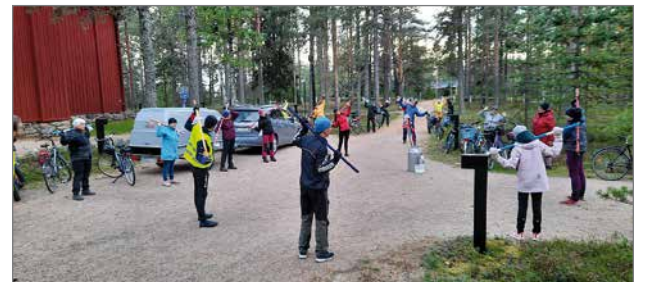
Piispanpyöräilyn yhteydessä Kirkon pihalla oli muun muassa keppijumppaa.

panpyöräilyn seurakuntatalolta kirkolle. Vajaat neljäkymmentä pyöräilijää lähti pyöräillen toteuttamaan piispa Jukka Keskitalon ideoimaa seurakunnille suunnattua haastetapahtumaa.