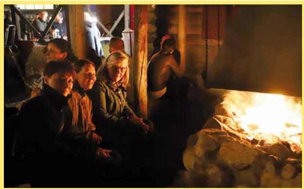
Alueella oli kaksi nuotiopaikkaa, joissa saattoi istuskella ja viettää iltaa tunnelmallisessa valossa.