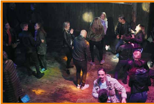
Revontulidiskossa riitti bilettäjiä yömyöhään asti.