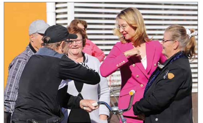
Tervehtimisessä käytettiin "käsipäivää" sijasta poikkeusajana suosituksi tullutta kyynärpäällä koskettamista.

Merkillepantavaa on, että maaseudun kehittämisrahoituksemme nousee käyvin