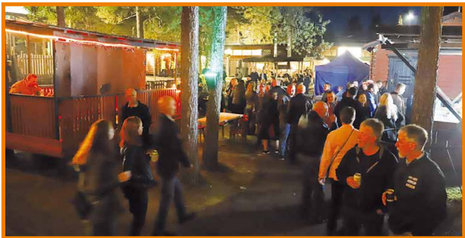
Venetsialaisten hieman vajaan 500 hengen venetsialaisyleisö viihtyi ulkona pihalla juhla-valaistuksessa, tanssisalissa sekä revontulidiscossa.

Tilaisuuteen saapui ulkopaikkakunnilta porukkaa, joista osa sellaisia, jotka eivät olleet ennen Jyrkkäkoskella käyneet ja halusivat tutustua alueeseen ja samalla viettää iltaa Venetsialaisten merkeissä.