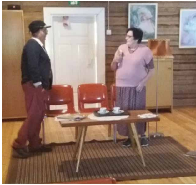
Kylän kuulumisia olisi hyvä saada kuulla.