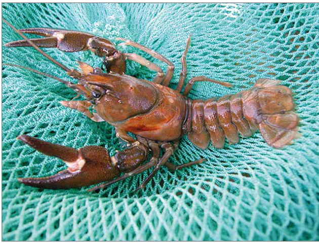
Täpläravun lajimerkinä on vaalea täplä saksen hangassa.

Tarkoituksena on nyt aluksi kartoittaa, kuinka