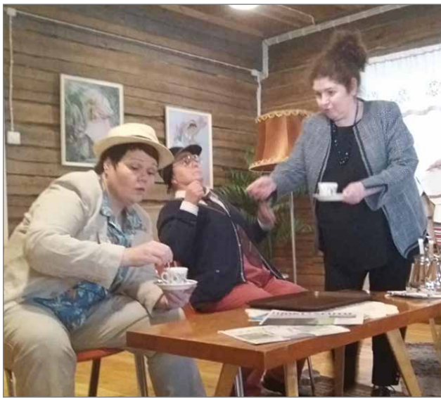
Kaffella kannattaa käydä ennen kuin käskyt harvonee.