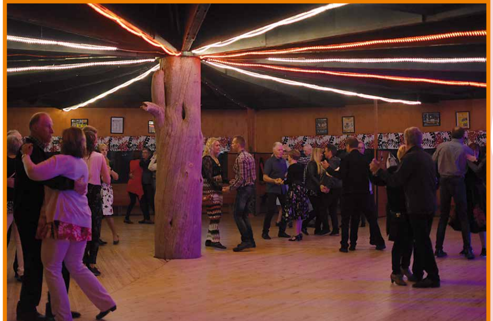
Jyrkkäkosken peruskunnostettu tanssilattia sai kehuja hyvästä kunnostaan ja liukastetta sai kenkiin useista eri kohdista.