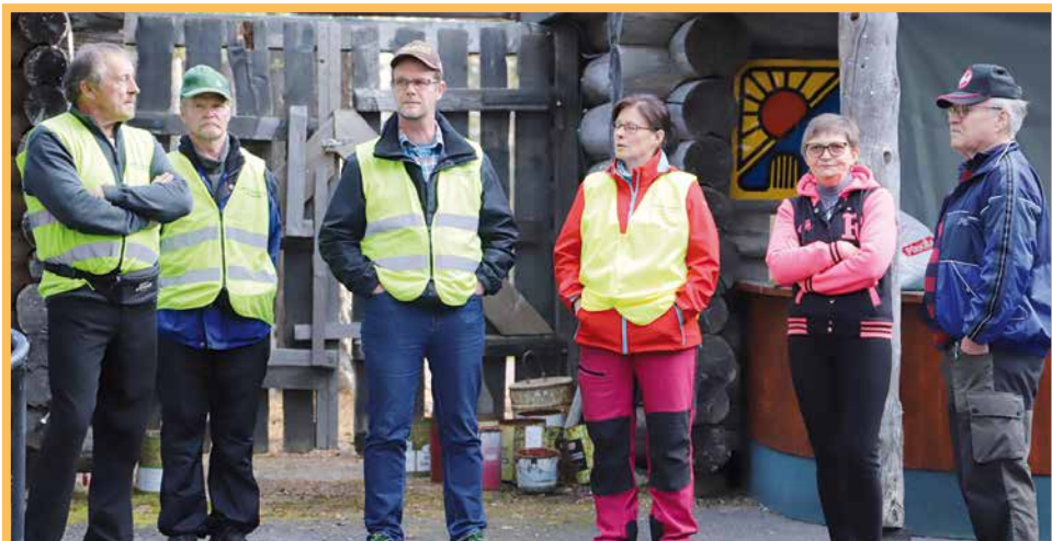
Pudasjärven urheilijoilla ja Pintamon kyläseuralla on järjestysvalvojayhteistyötä. Näin Pintamolta tuli kuusi henkeä auttamaan järjestysvalvojan tehtävissä.