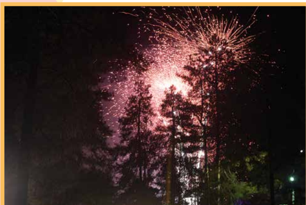
Näyttävä iletulitus oli juuri ennen puolta yötä.