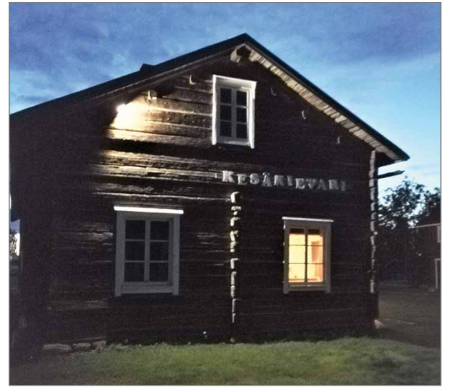
Kesäkievari sammuttaa valot talvikaudeksi ja sytyttää ne jälleen kesäksi 2021.