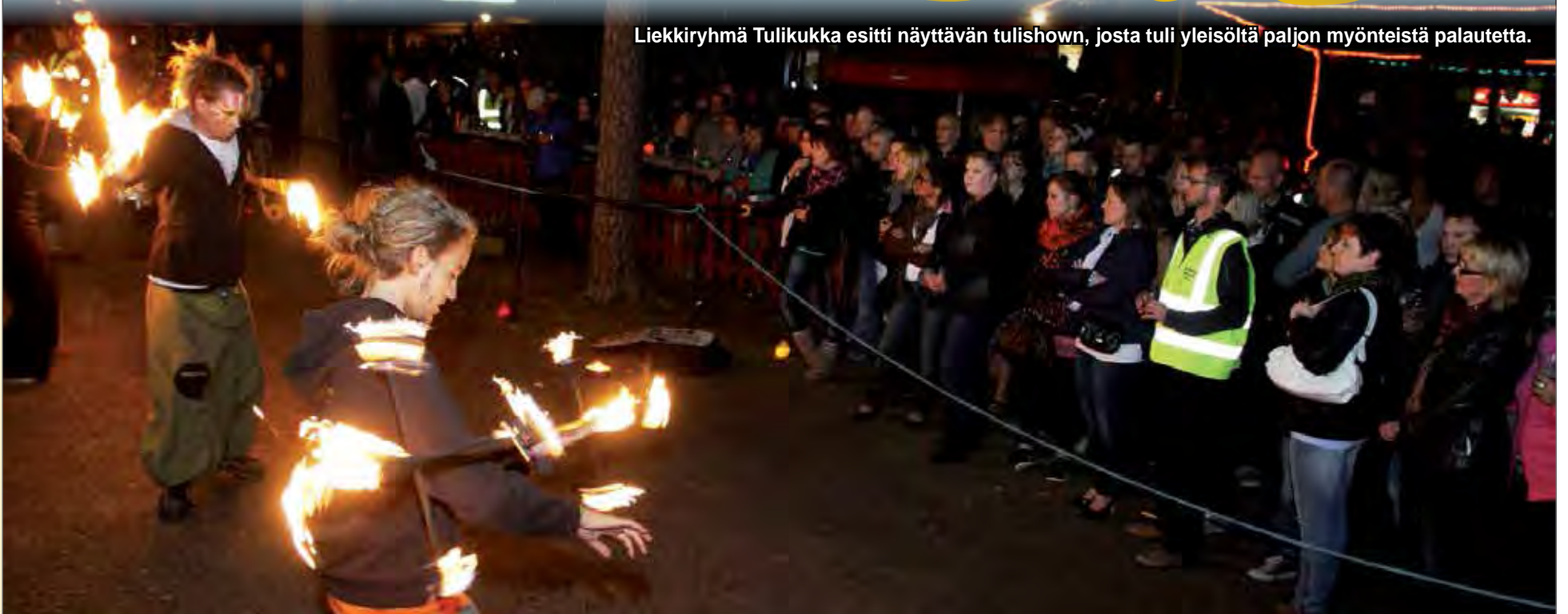
Liekkiryhmä Tulikukka esitti näyttävän tulishown, josta tuli yleisöltä paljon myönteistä palautetta.