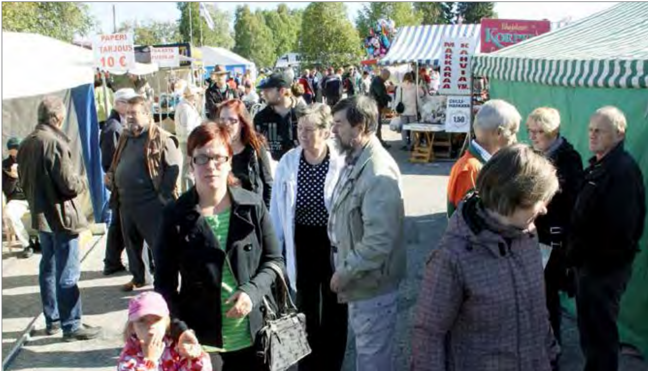
Markkinayleisöä heli aurinkoinen sää.