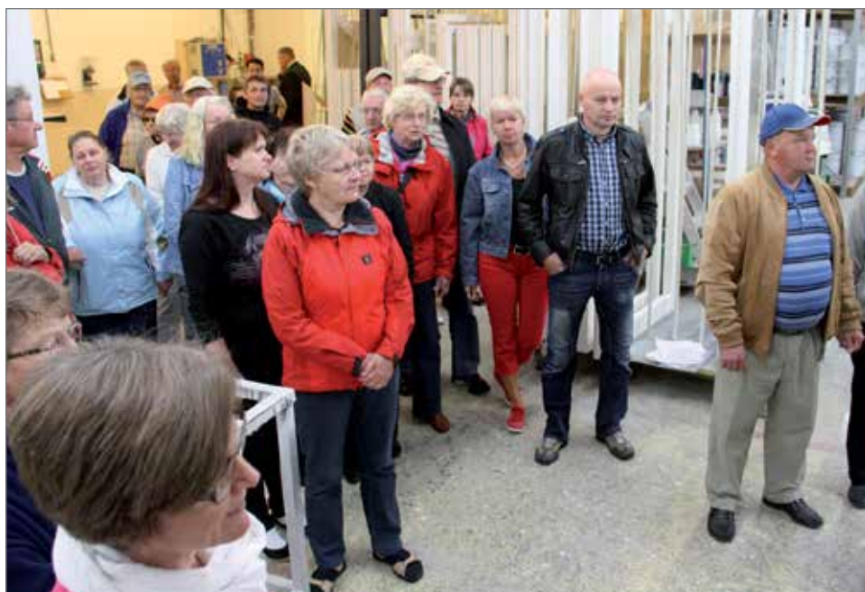
Tehtaan esittelykierrokseen riitti kiinnostuneita koko päivän ajan.