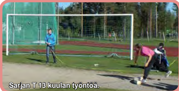
Sarjan T 13 kuulan työntöä.