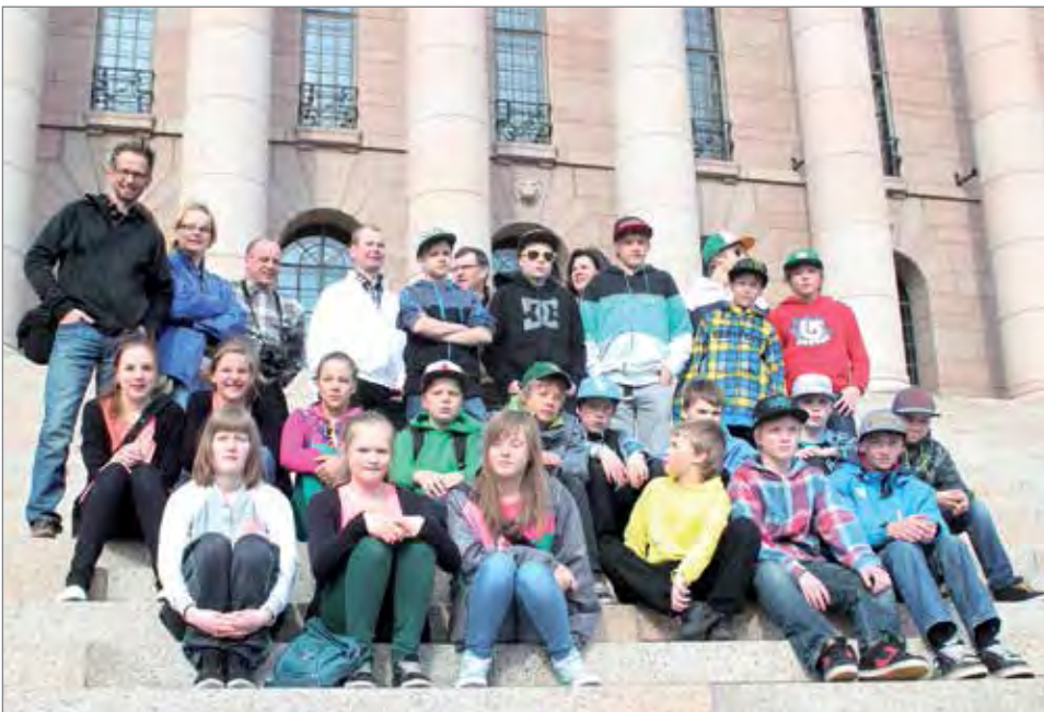
Eduskuntatalon portailla ryhmäkuva