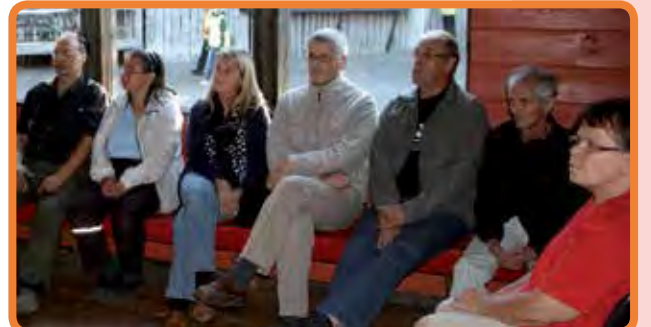
Pudasjärven kaupungin ja Yrittäjien yhteisesti kutsuun mökkiläisiltan kutsua noudatti noin 30 henkeä.