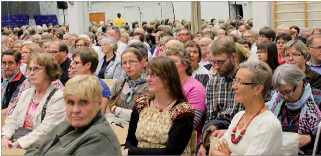
Taivalkosken lähetysjuhlan päättilaisuus keräsi noin 600-henkisen yleisön!

Oulun hiippakunnan lähetysjuhlit järjestettiin Taivalkoskella 24.-25.8. Teemana oli Samaa tietä. Juhlille osallistui kokonaisuudessaan noin 1400 henkilöä. Monipuolisissa ohjelmanumeroissa oli mukana taidetta ja musiikkia, sekä hiljentymistä evankeliumin ilosanoman äärelle.