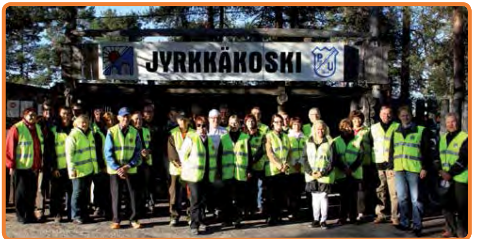
Lionsklubin talkoolaiset nostivat illan aluksi lipun salkoon, lauloivat leijonalaulun ja kokoontuivat yhteiseen kuvaan. Illan mittaan työtä riitti monissa eri tehtävissä. Myös Pudasjärven urheilijoilla oli suuri talkoolaisien joukko huolehtimassa illan onnistumisesta.