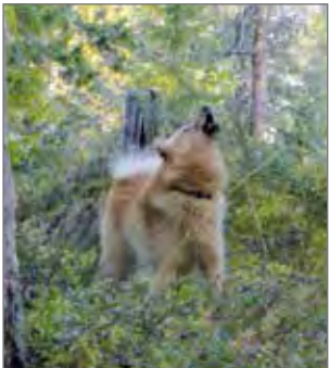
Källillä metsähoukku käynnissä.

Metsästys on Pudasjärvellä suosittu harrastus. Paikkakuntalaisten ja yksityisiin metsästykseseuroihin kuuluvien metsästäjien ohella Pu-