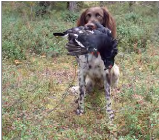
8-vuotias pitkäkarvainen saksanseisoja Taikasuo Yvette on noutanut urosteeren.

Pudasjärven alueen noin 5867 neliökilometrin kokonaispinta-alasta noin kolmasosa on valtion omistamia alueita. Pienriistanmetsästyksen soveltuvia valtion omistamia maa-alueita Pudasjärvellä on noin 244 100 hehtaaria, jonne myytiin kaudella 2012 metsästyslupia 1588 kpl. Metsähallituksen kanalintuluvalla voi metsästää kaikkea pienriistaa valtion omistamilla alueil-