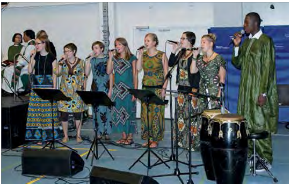
Lähetysjuhlilla useaan otteeseen kansainvälisiä rytmejä esitteli Amani-kirkkokuoro.