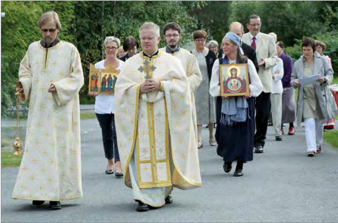
Kirkkokansa siirtyi ristisaatossa vedenpyhitykseen lijoelle Rajamaan rantaan.