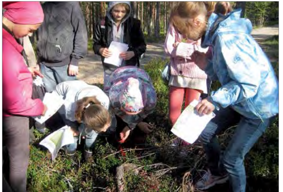
Aittojärven koululaiset tutkivat metsäretkellä männyn kannon vuosirenkaita.