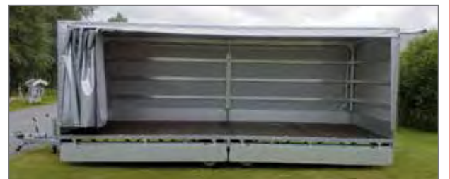
Kaappi- ja levypalvelu Raution uusi vuokrattavissa oleva pressukärry voi toimia vaikkapa esiintymislavana tilaisuuksissa.

Yrityksen vuokrausvalikoimasta löytyy nyt koppikärry, jonka takaseinä