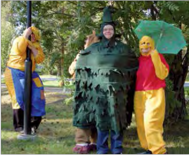
Auringossa monta on ihmeellistä kulkijaa.