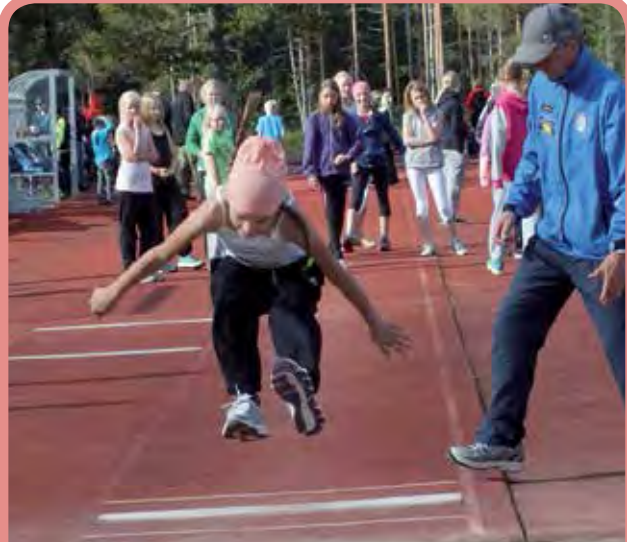
Sarjan T 11 pituushyppyä.