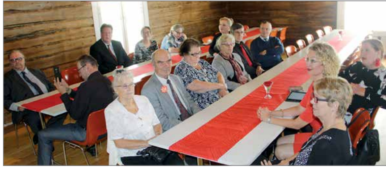
Koskenhovilla vietettiin lämminhenkistä 80-vuotisjuhlaa puheiden, musiikin, hyvän ruoan ja kakkukahvien merkeissä, keskusteluakaan unohtamatta.