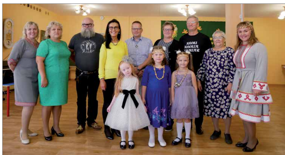
Lasten päiväkodissa vierailu.