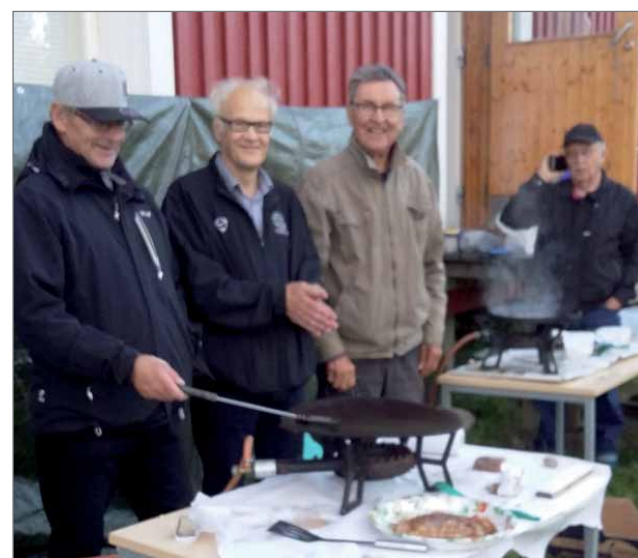
Lettuja paistajat työssään.