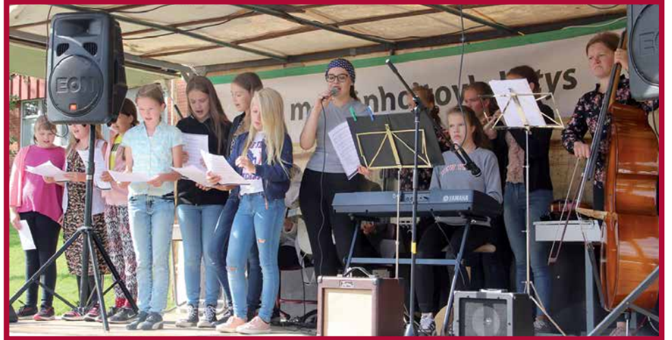
Sarakylän musiikkia harrastavat nuorten ryhmä esitti musiikkia ja säästi kouluista lauluesityksiä.

Hän kertoi kaupungin kuulumisia uuden valtuuston ensimmäisen vuoden ajalta. Kesäkuussa kaupun-