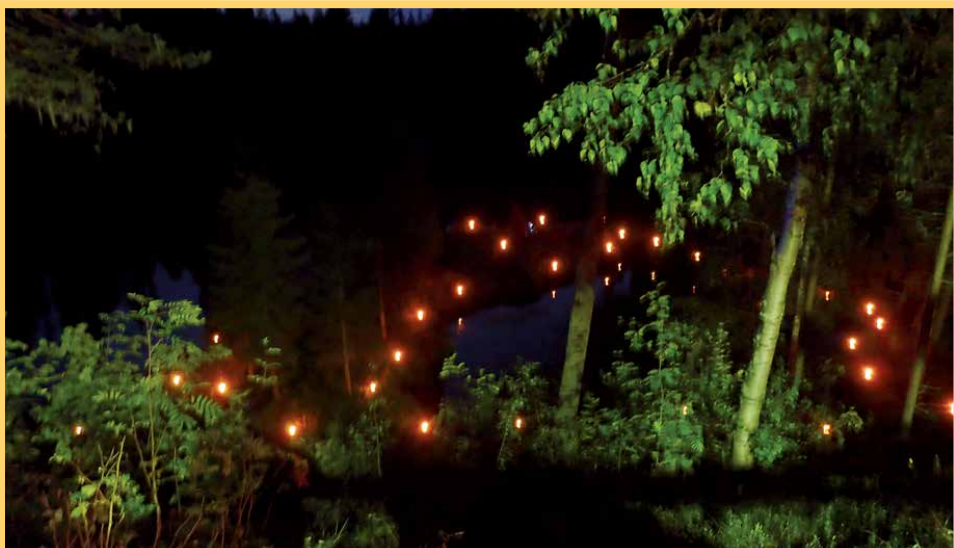
Jyrkkäkosken vesialuekin oli juhlavalaisu.