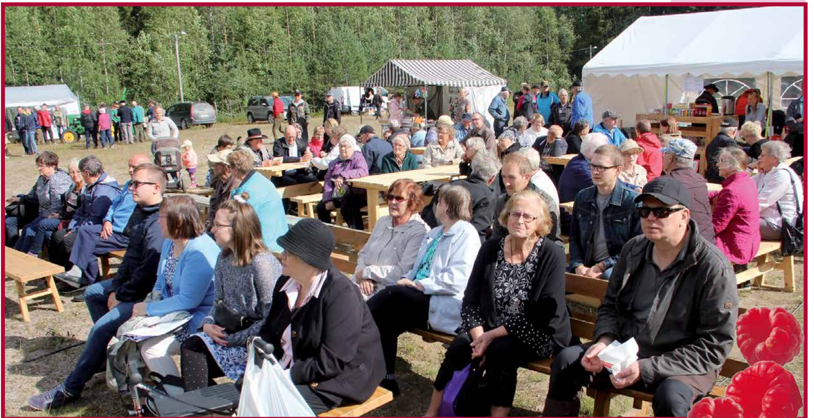
Sarakylän Vattumarkkinoilla on jo 29-vuotinen perinne. Kuva sunnuntain päiväjuhlasta markkinatorilla.