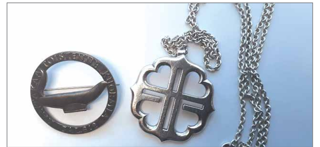
Diakonin merkki ja diakoniaripus.