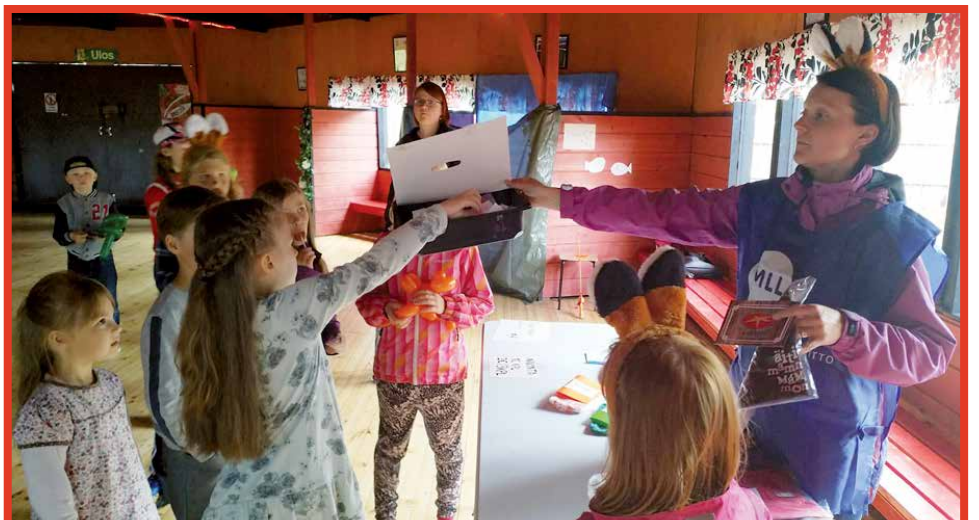
Tapahtuman lopuksi oli arpajaisten arvonnat.