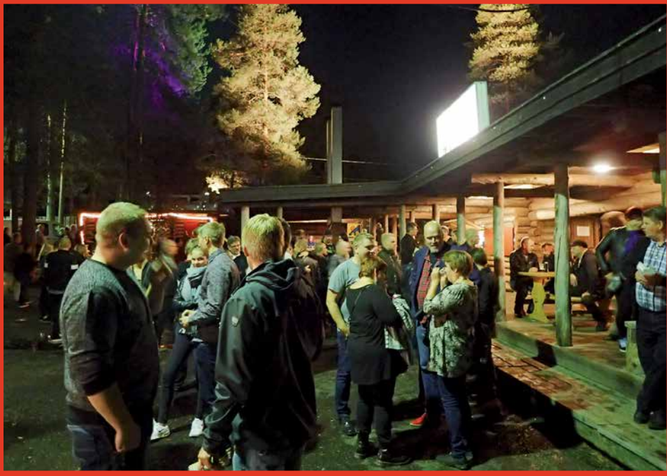
Juhlavaloin valaistu Jyrkkäkosken huvialueen piha täyttyi illan kuluessa Venetsialaisvierraista.