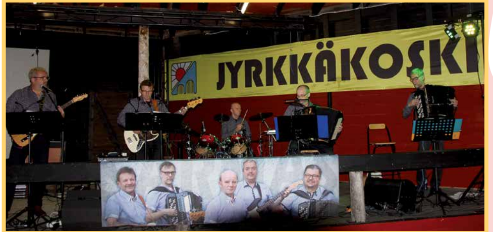
Tanssimusiikista vastasi monipuolinen ja suosittu Sarmas-yhtye.

-Juomalippuja ostetaan edelleen hyvin vähän, vaika