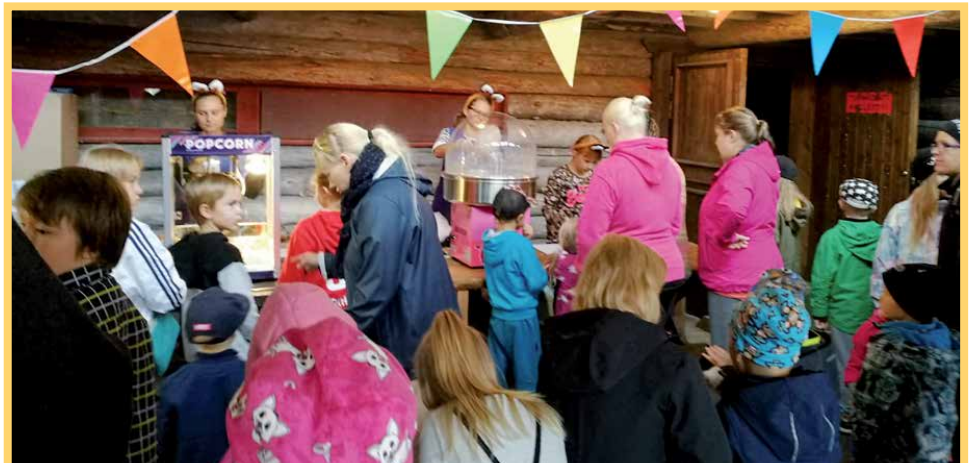
Hattarat ja popcornit maistuivat kävijöille. Lisäksi kauppansa tekivät myös makkara ja lätyt.

pizzaan. Kiitos yrityksille lahjakorteista! H F-M