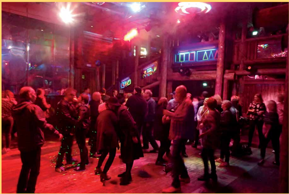
Revontuli-discossa levyjä soitteli Dj Winski. Discolla on myös omat facebook-sivut, jonne halukkaat olivat voineet jättää omat levytoiveensa.