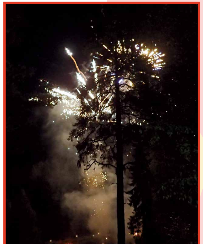
Talkoilla tehty kokko sytytettiin noin kello 23 ja ilotulitus oli ennen puoltayötä.