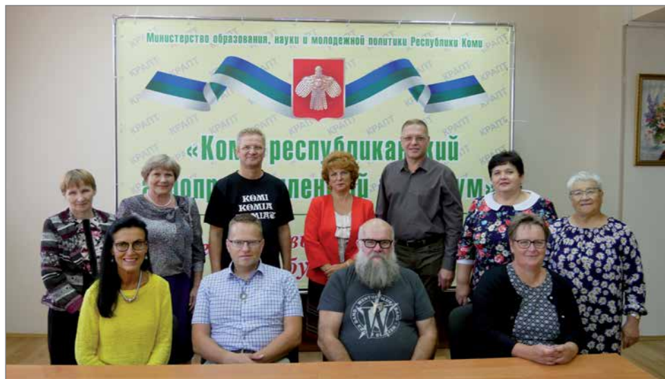
Pudasjärven väki (eturivissä) ammattioppilaitoksen vieraana.