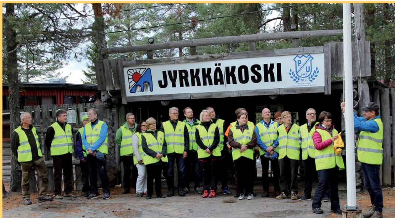
Illan talkootyöhön osallistuneet leijonat kokoontuivat illan aluksi Pudasjärvi-viirin nostamiseen salkoon.