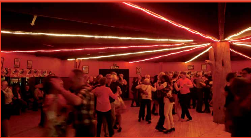
Jyrkkäkosken peruskunnostettu tanssilattia sai kehuja hyvästä kunnostaan.