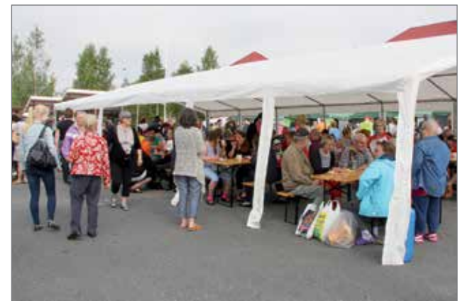
Paikalle saapui runsaasti makutuomaristoa.