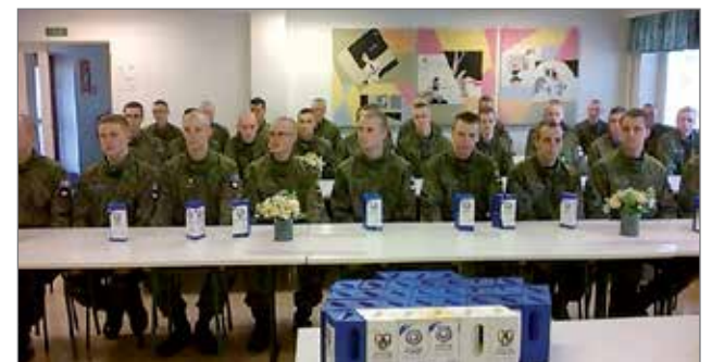
Varusmiehet kertoivat palautteensa saaneensa kerääjinä erittäin hyvän vastaanoton pudasjärveläisiltä.

-Pudasjärvi onkin perinteisesti ollut keräystuloksessa maan kärkitasoa niin asukasta kohden kuin kokonaiskeräystuloksessa. Keräyksellä on ollut suuri merkitys sotaveteraaneille ja -invalidille. Tämänkin keräyksen varat menevät täysimääräisesti heidän kotona-asumisen tukemiseen, totesi