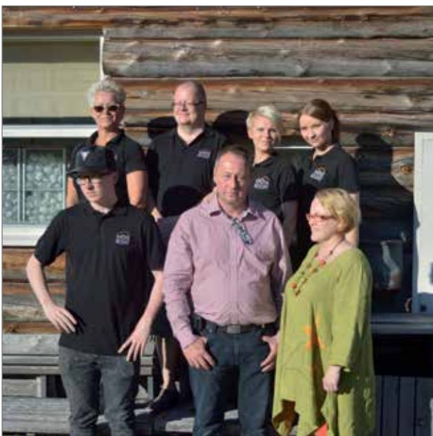
SyöteResortin uutta henkilökuntaa koolla starttikaffeilla 22.8.