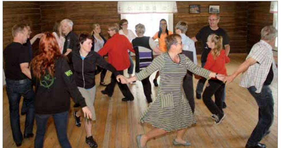
Yhteistanssin harjoituksessa on menoa ja meininkiä.