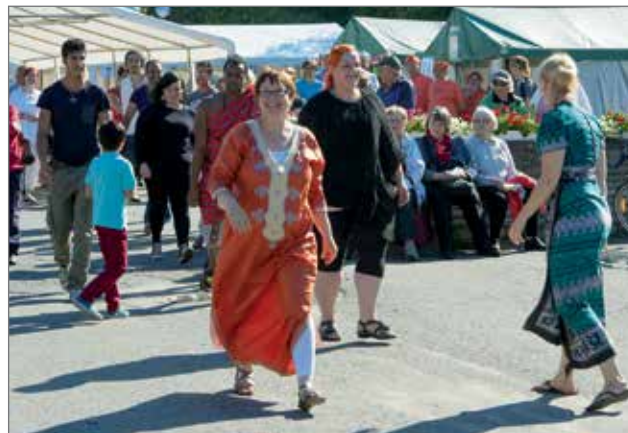
Toiseksi sijoittuivat Kameleontti ry:n aurinkoiset kisaajat.

myös arvoniemellä Vuoden Kylinääri. Voittaja sai myös 150 euron stipendin kyläseuran toiminnan kehittämiseen. Toiseksi äänestyksessä tuli Kameleontti Ry ja kolmanneksi Kuren maa- ja kotitalousnaiset. JK/Pudasjärven Kaupunki