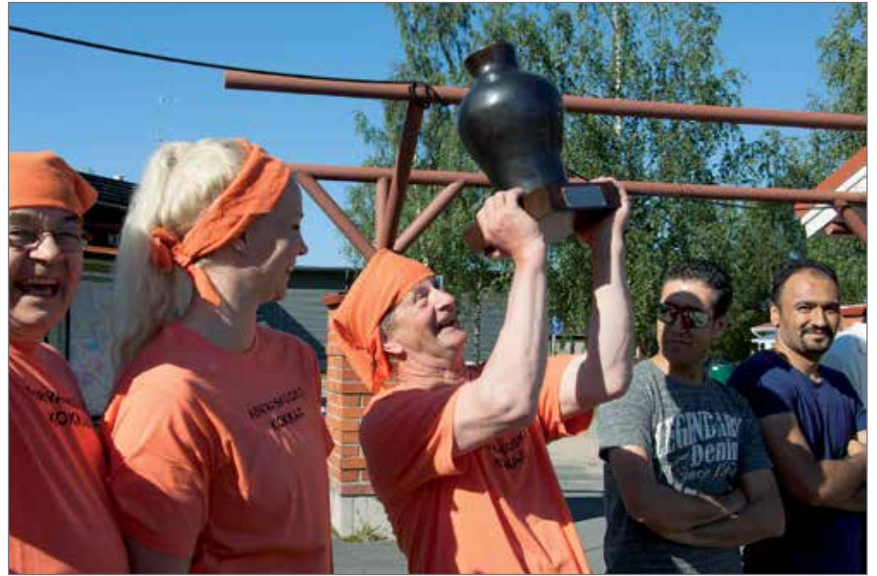
Hirvaskoskelaiset tuulettivat Vuoden Kylinääri -arvoniemen voittoa.

Kylä kokkaamaan 2015 -kisassa joukkueita oli kisamassa tällä kertaa kahdeksan. Kyliä olivat edustamassa Jonku, Hirvaskoski, Kurki ja Panuma. Muita joukkuei-