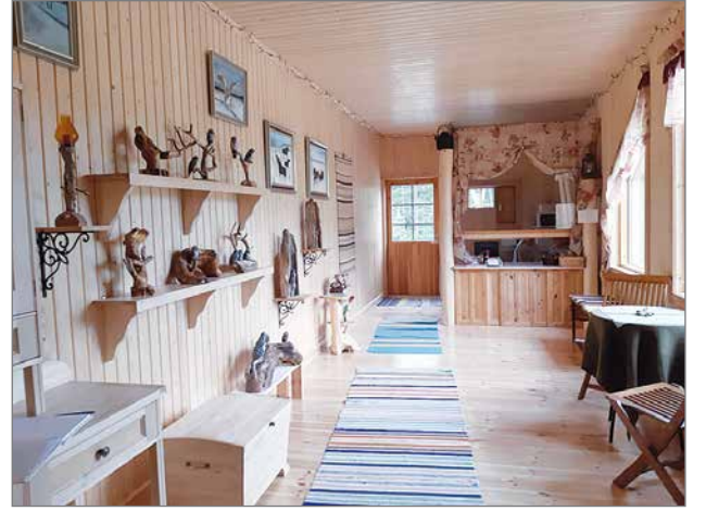
Pähtilän taidekahvilassa ihailimme puukolla ja moottorisahalla veistettyjä teoksia.

Näen kirkkaan Taivaan ja vihreän maan Tänne muutan mä asumaan. Elintasoni, täällä on päätä huimaava ilmaa valoa vettä