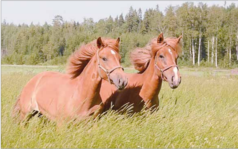
Talli Kahden Kimppa on yksivuotiaiden suomenhevostammojen Äkkilähtö ja Manun Mayan muodostama hevostam, josta löytyy lisää tietoa tallin Facebook-sivulta.

- Yleensä kimppaomistuksessa tullaan osakkaiksi yhden hevosen omistajiksi,