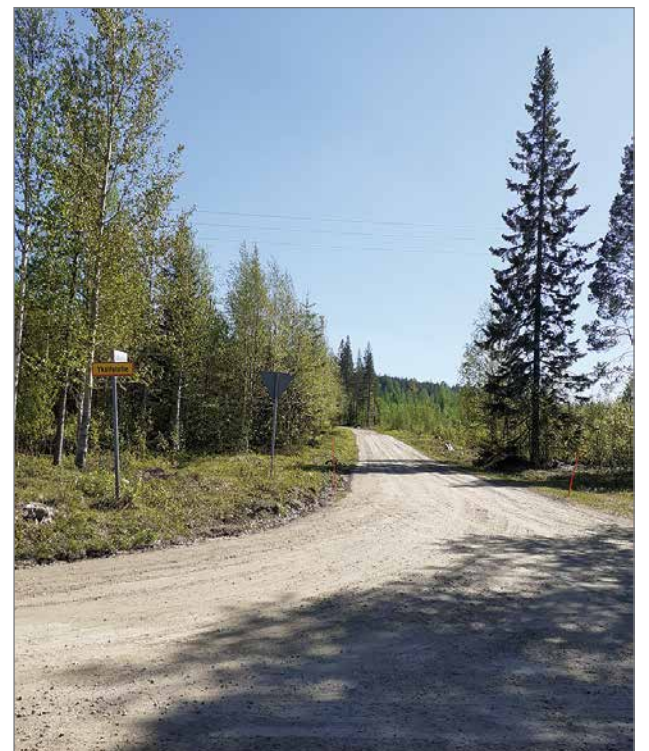
Pudasjärvellä on tällä hetkellä paljon alueurakan piirissä olevia yksityisteiden tiekuntia, joiden tiedot eivät ole ajan tasalla yksityistierekisterissä ja tie- ja katuverkon tietojärjestelmässä (Digiroad), eivätkä tiekunnat ole pitäneet kokouksia yksityistielain mukaisesti.

Yritys on pudasjärveläinen kolmihenkinen perheyritys. Kotipaikka on Pudasjärvi, mutta toimintamme