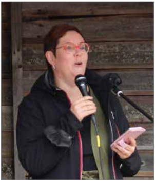
Kansanedustaja Merja Kyllönen paneutui markkinapuheessaan tie- ja tietoverkoston tarpeellisuuteen kuin sotien tuomiin muutoksiin palveluissa.

Sarakylän XXXI Vattumarkkinat pidettiin hieman koleahkossa ja väliin vettä tihuttavassakin säässä. Kelistä huolimatta väkeä kertyi läheltä ja kaukaa ihan mukavasti tuttuja tapaamaan ja kuulumisia vaihtamaan.