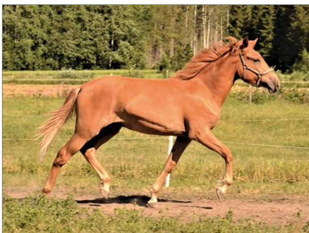
Suomenhevostamma Manun Maya.