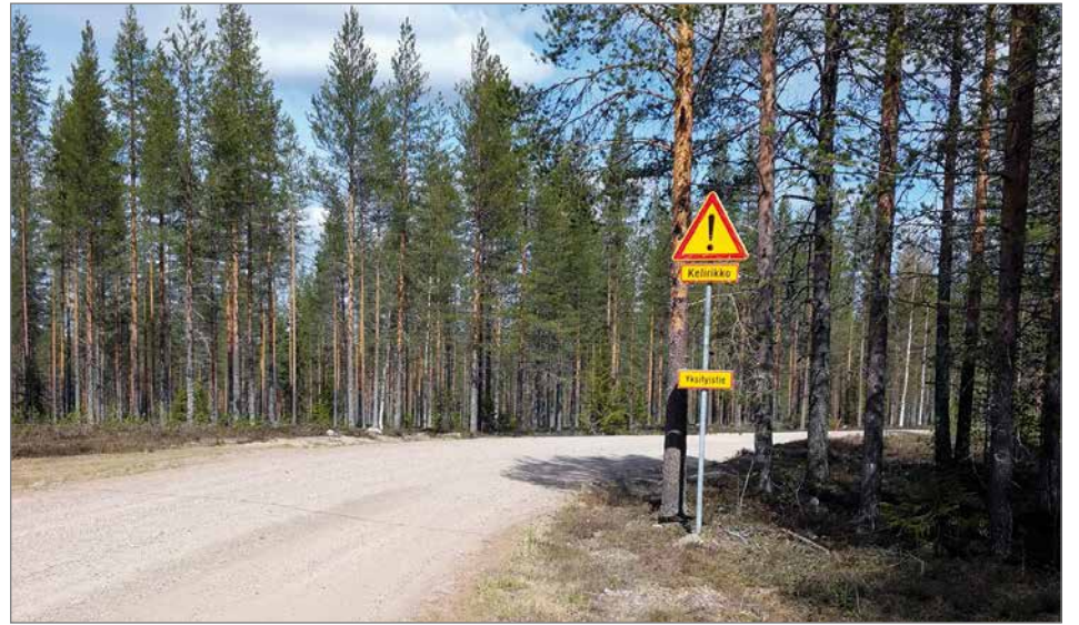
RT-Infrapalvelut Oy voi tarvittaessa avustaa tiekuntaa yksityistien perustamishankkeiden hankkimisessa, valtion ja kaupungin avustuksen hakemisessa ja urakan kilpailuttamisessa.

Pohjois-Pohjanmaalla on runsaasti käytettävissä määrärahoja ELY-keskuksen toiminta-alueen yksityisteiden perustamishankkeisiin. Pohjois-Suomessa on käynnissä ja vireillä hankkeita, jotka lisäävät tarpeita liikennöidä yksityisteillä mm. puun kuljetuksen merkeissä. Siksi olisi niin teiden käyttäjien kuin erityisesti metsäteollisuuden kuljetusten kannalta tärkeää, että tiekunnat aktivoituisivat