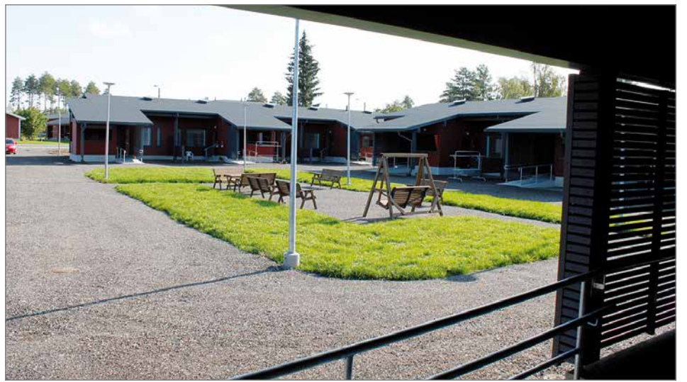
Suuri rivitalourakka on lähes valmis, valtaosassa asunnoista on jo uudet asukkaat ja ensi kesään mennessä valmistuu loput rivitalot sekä kerhotilarakennus.