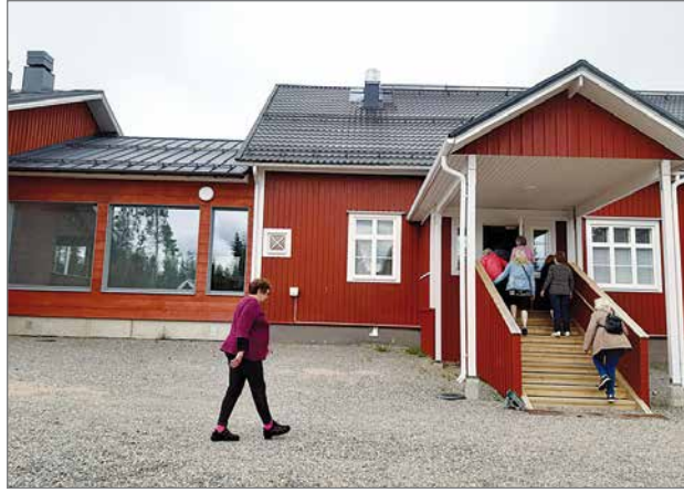
Vierailimme 120-vuotiaalla Kipinän koululla.