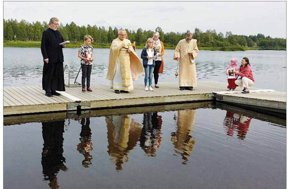
Vedenpyhitys suoritettiin Rajamaan rannassa.

Toinen pyhäksi nimetty on Tverissä syntynyt, Valamon ja Petsamon luostareiden kautta Uuteen Valamoon Heinävedelle päätyneet skeemaigumeni Johannes. Heinävedellä hänestä kasvoi merkittävä ohjaajavanhus, joka kävi laajaa kirjeenvaihtoa ja jonka luo-