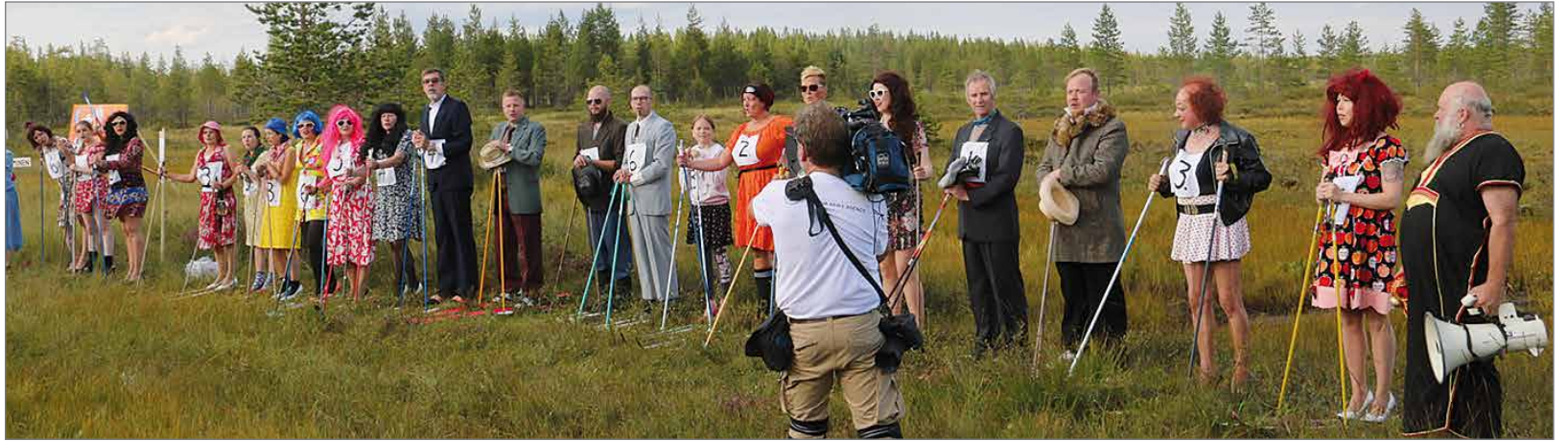
Suohiitotapahtuma alkoi perinteisesti yhteisesti laulettuna Maamme -laululla.