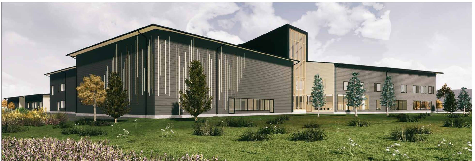
Hyvän Olon Keskus on näyttävä maamerkki Oulu-Kuusamo -valtatie varrella.