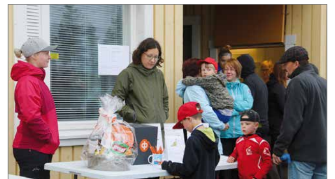
Herkkukorin arvontalippuja täytettiin ahkerasti.