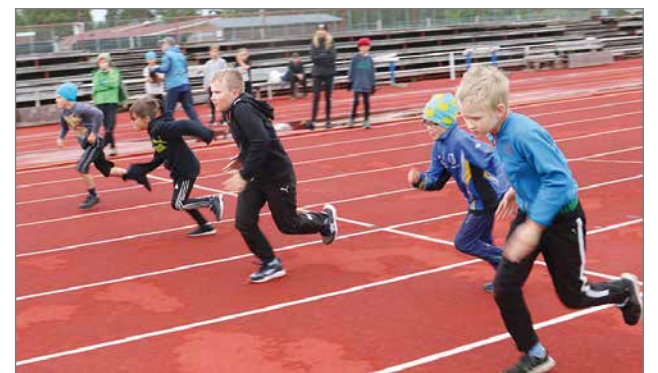
9-vuotiaat pojat kirmasivat 40 metriä.

Kisojen järjestäjä Osuuspankki lausuu kiitokset kilpailijoille, vanhemmille, Pudasjärven Urheilijoille ja yleisölle! HT