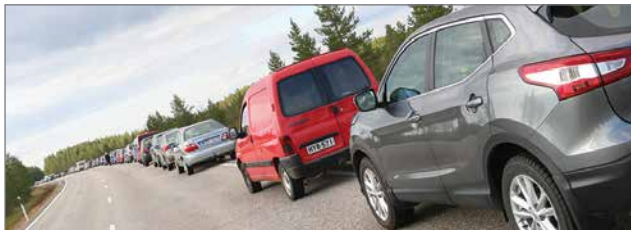
Ranuantien varressa Kapustasuon kohdalla oli katsojien muodostama noin kilometrin pituinen autojono.