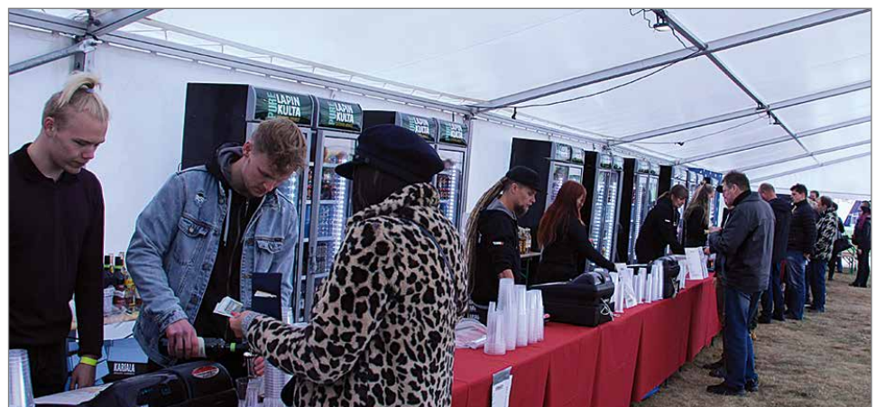
Ravintolatelalla riitti janoisia asiakkaita koko illan ajan.