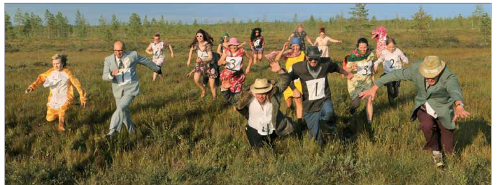
Vauhdikasta menoa, kun takaa-ajokisassa naiset juoksivat miehiä kiinni.

per. Hän oli myös kilttimekkoon pukeutuneena paikalla. Oli luvannut tulla myös ensi vuonna. Lisäksi palkintoina oli Tykkyläisten poronsarvi-luusta taiteilemia koruja ja kukkamekkopokaalit.