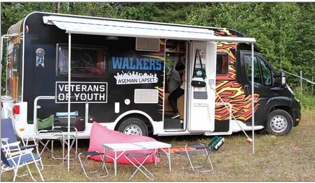
Missä on nuoria – siellä on tämä näkyvä Wauto!