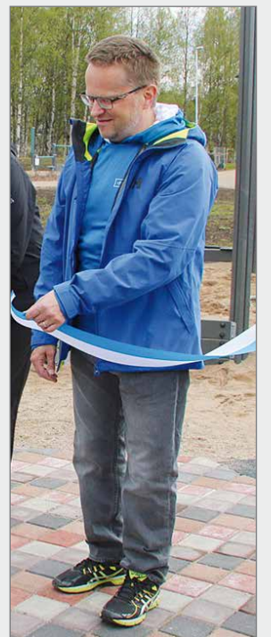
Kaupunginjohtaja Tomi Timonen alkukesällä Pietarilan lähiliikuntapuiston vihkiäisissä.

Kiitokset Heimolle, Eilalle ja muille Pudasjärvi-lehden tekemiseen osallistuneille näistä vuosista ja parhaimmat onnen toivotukset myös Pudasjärven kaupungin puolesta!