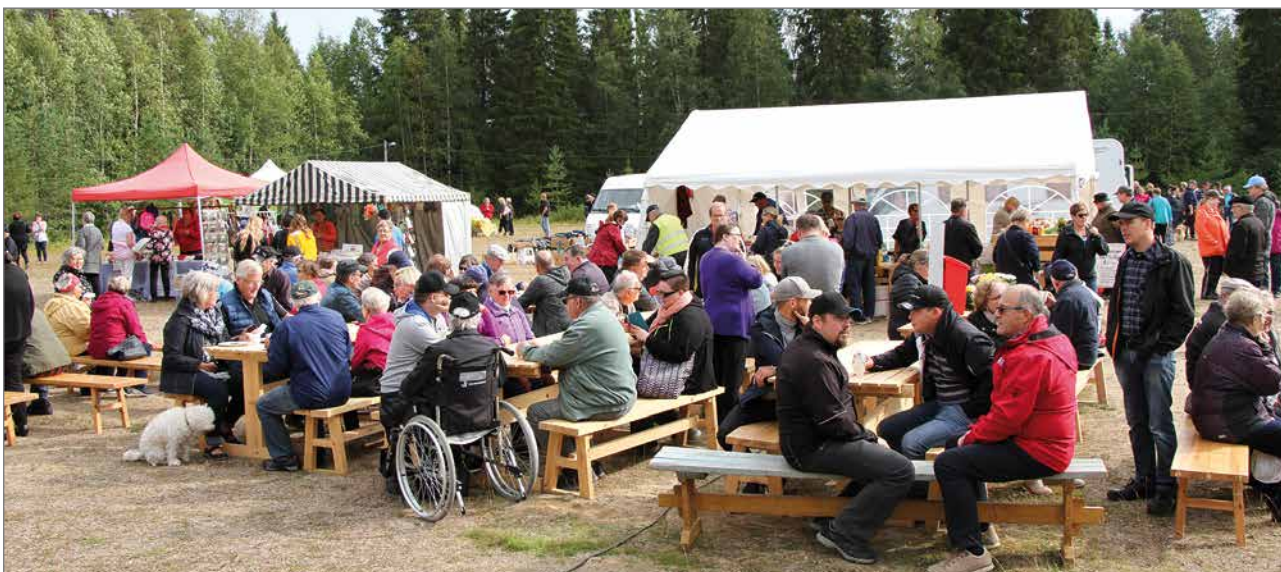
Markkinaväki nautti lettukahvitarjoilusta.