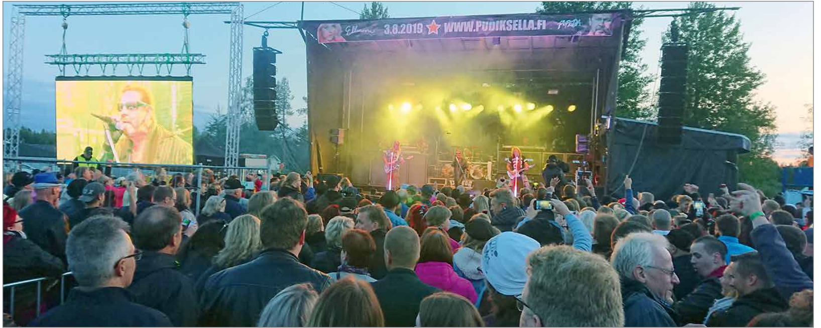
PopedaPudiksella tapahtuma kokosi yli 2000 hengen yleisön Rajamaanrantaan, joka todettiin erittäin hyväksi festaripaikaksi.