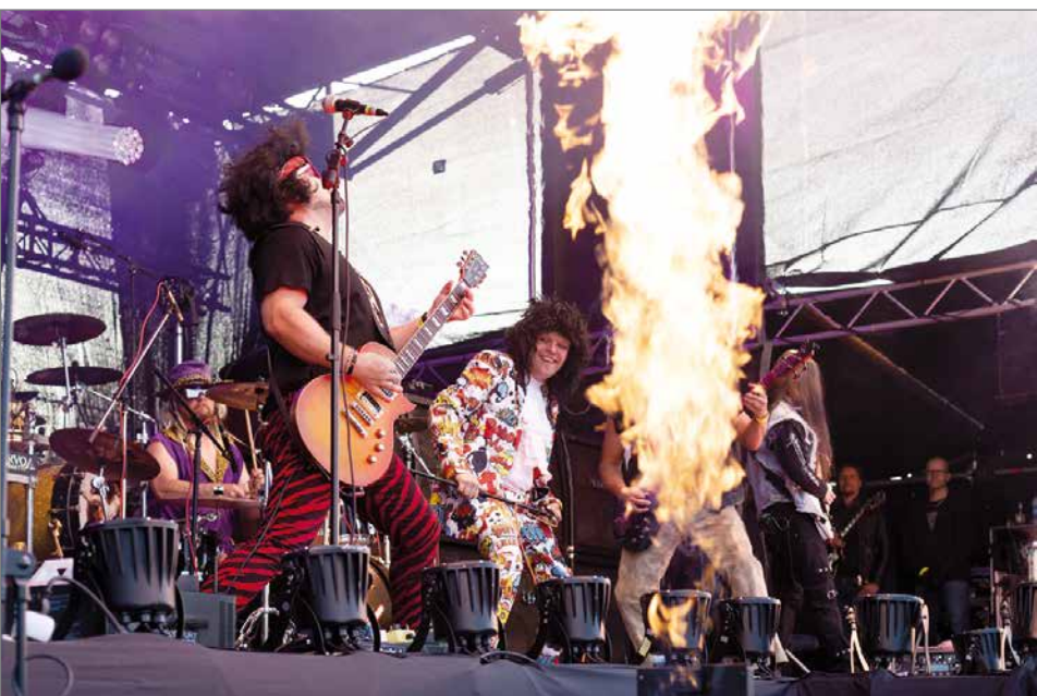
Woyzeckin esiintymiseen antoi lisäpontta näyttävä byroshow.

Ellinooran poppoo jatkoi Kuopioon Pudasjärveltä sy- dämellisestä vastaanotosta hyvillä mielin.