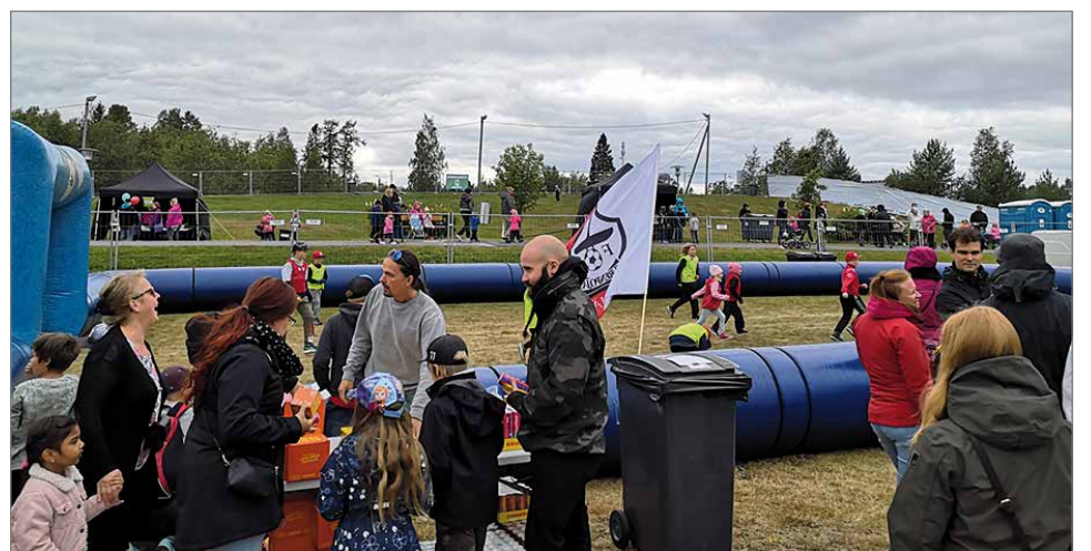
FC Kurenpoikien ilmatäytteisellä arenalla pelattiin jalkapalloa. 600 välipala-annosta menivät kaikki käyttöön.

FC Kurenpoikien pisteessä pelattiin jalkapalloa ilmatäytteisellä arenalla ja pelit jatkuivat Hevisauruskonsernin aikana. Peli oli niin suosittua, että välillä pelaajat joutuivat odottamaan pelivuoroja. Pisteellä jaettiin myös Nomnomin hedelmävälipaloja ja juomia. Suurta, noin 800 hengen osallistujamäärää