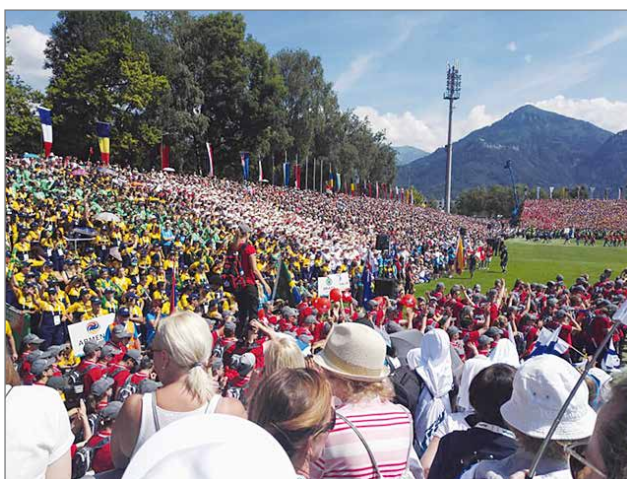
Itävallan World Gymnaestradaan osallistui yli 18 000 voimistelijaa ennätyksellisesti 69 eri maasta. Kuva avajaisista.