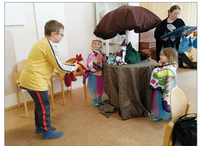
Vihma-satunäytelmässä repo jahtaa jänistä.