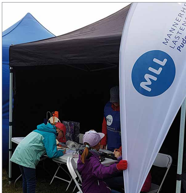
MLL:n pisteessä oli onnenpyörä, josta saattoi saada karkkia ja kasvomaalauksen sekä esittää ideoita yhdistyksen toimintaan.

tumien toiminnoksi ja milaista toimintaa yhdistykseltä toivotaan. HT