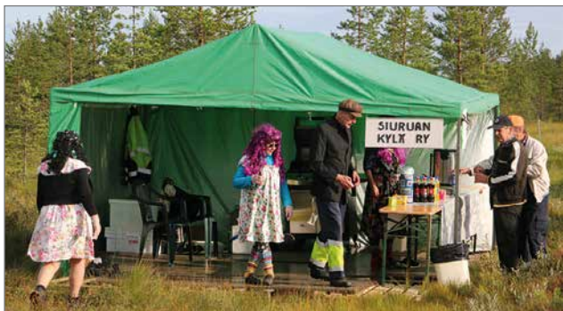
Siuruan kyläyhdistys oli pystyttänyt kahvioteltan, josta sai kahvia, juomia ja grillimakkaraa.