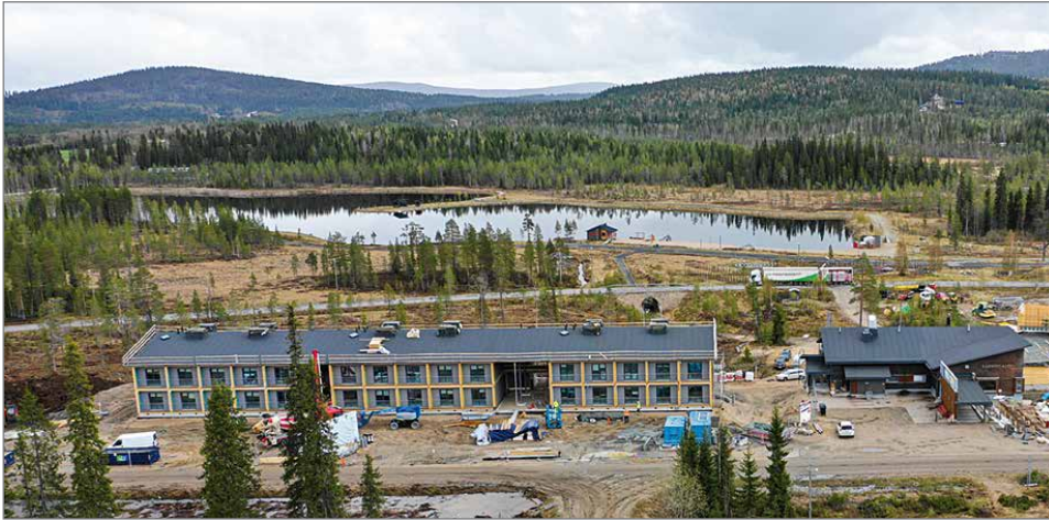
Terentjeffin perheen omistama Iso-Syötteen laskettelukeskus on kasvava matkailukeskittymä luonnonkauniin Syötteen kansallispuiston ympäröimänä. 60-huoneinen Hotelli Kide avaa ovensa marraskuussa Iso-Syötteen parhaalla paikalla, aivan laskettelurinteiden juuressa.

- Olemme nyt rakentamassa täysin uutta asiakaskokemusta, jossa perinteisesti etäiseksi koetut digitaaliset palvelut yhdistyvät sujuvasti korkeaan asiakaspalvelukokemukseen ja toimivaan matkailuelämyk-