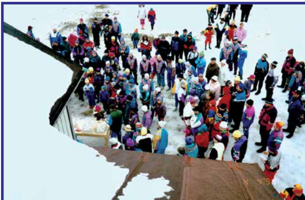
PK-hiihdot 4.4.1994 yleisöä.