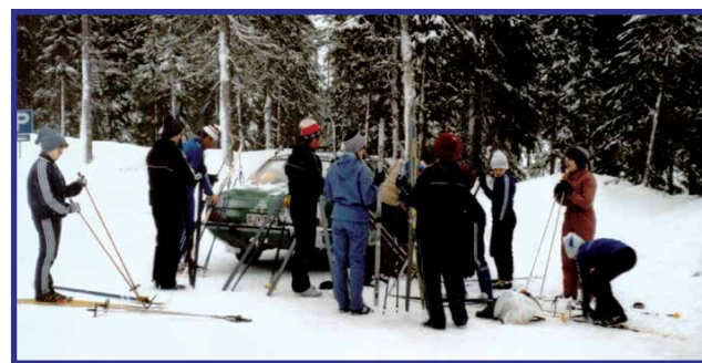
Ensimmäinen Syötehihti 1983.