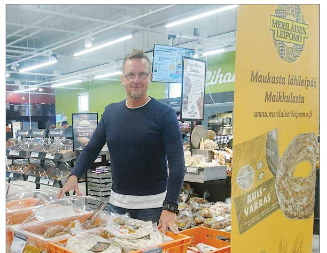
Meriläisen leipomolla Oulun Maikkulasta oli runsas valikoima lähileipomien tuotteita.