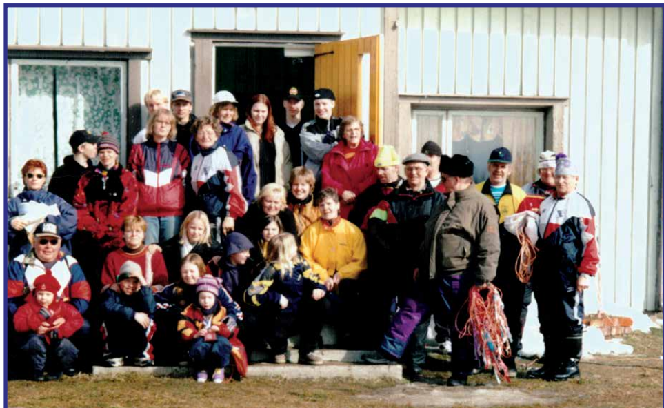
Viimeiset kisat Mantyniemessä 9.4.1999.