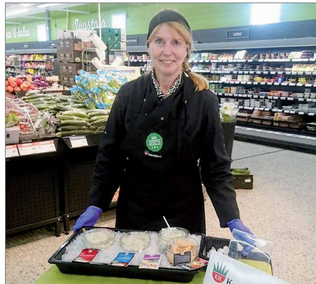
Oululainen perheyrittys Kasvishovi maistatti raikkaita salaatteja ja majoneesituotteita.

K-Supermarketissa vietettiin viime perjantaina 17.8. Paikallista sinulle -lähiruokataapahtumaa. Teemapäivänä asiakkaat pääsivät keskustelemaan paikalla olleiden lähiruuan tuottajien kanssa ja tutustumaan heidän tuotteisiinsa. Mukavien maistiaisten myötä lukuisat erilaiset ruokatuotteet solahdivat asiakkaiden ostoskärriyihin.