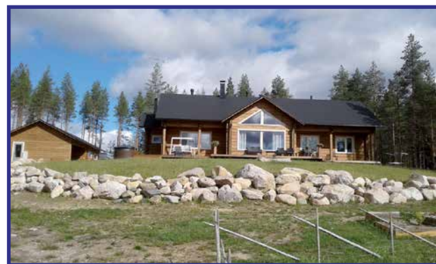
Marikaisjärven rannalle on kohonnut Murasten rakentama Kontion hirsitalo ja vieressä on autotallirakennus.