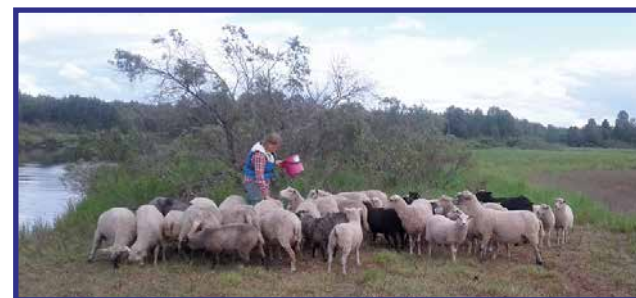
Kesäisin lampaat laiduntavat Vääräsaarella ja tekevät samalla maisemanhoitotyötä.