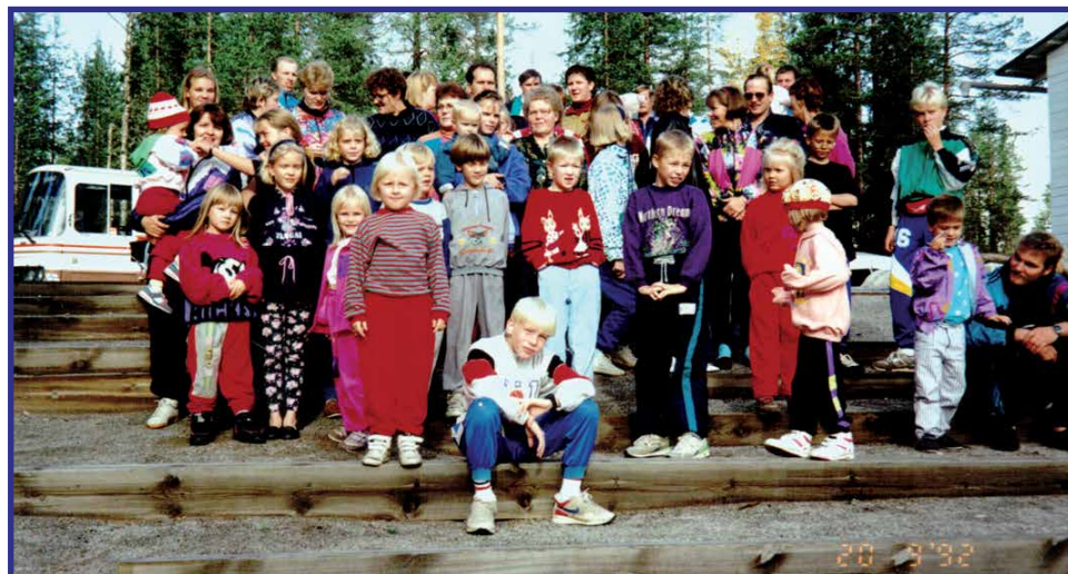
Posion Kirikeskus 20.9.1992.