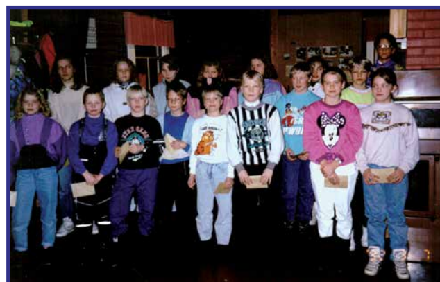
1992 vuosikokouksessa palkitut jalkapallojuni- orit.