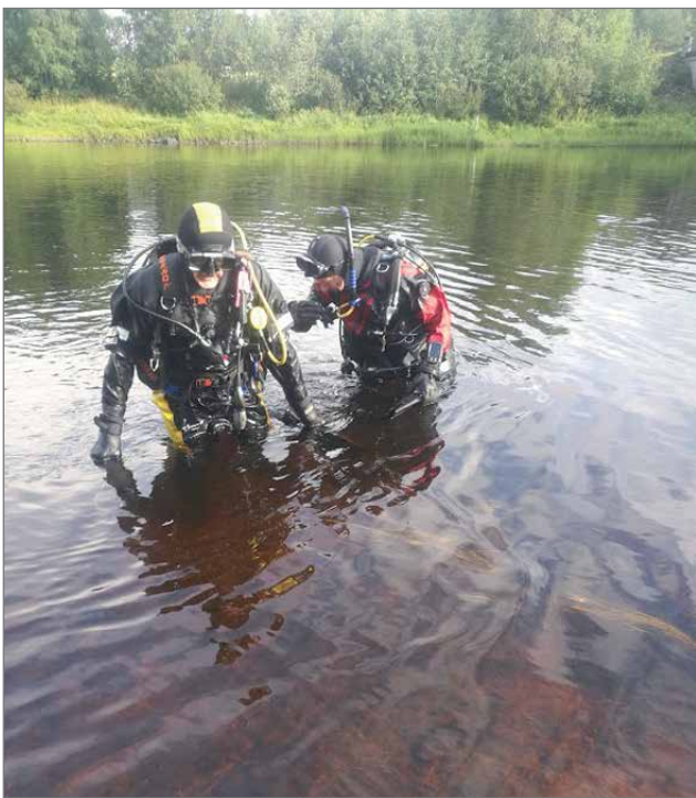
Kaksi putkea tarkastettiin joista toinen kuvattiin, kolmas on kosken alapuolella mutakerroksen suojassa.