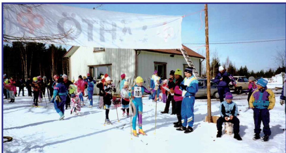
PK-hiihdot 1992 lähtö.