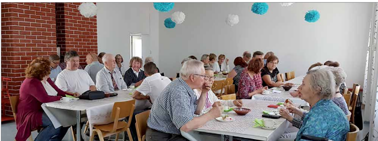
Juhlaväki nauttimassa pöydän antimista