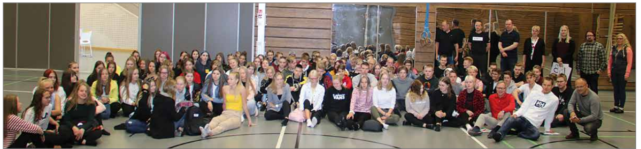
Lukion oppilaat ja opettajat kokoontuivat pihatilaisuuden jälkeen vielä yhdessä liikuntasaliin.

tään ei kiusata ja toisiin suhtaudutaan myönteisesti. Oppilaiden ja opiskelijoiden kohtaamista yksilöinä ja kehittyvinä ihmisinä halutaan lisätä, jolloin osaltaan hyvinvointi, kouluviihtyvyys ja motivaatio paranevat. Tällöin voidaan toivoa myös oppimistuloksien kehittymistä, kun työnteko (oppiminen) koetaan mielekkäänä.