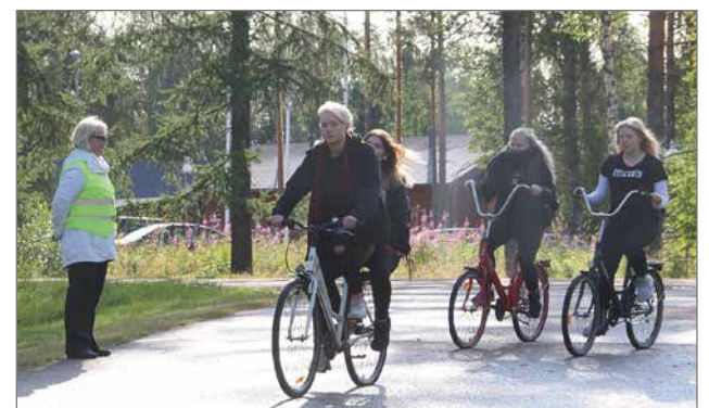
Hirsikampuksen ensimmäisenä kouluamuna opettajat olivat seuraamassa ja opastamassa niin koulun pihalla kuin läheisillä kevyenliikenteen väylillä liikennettä.