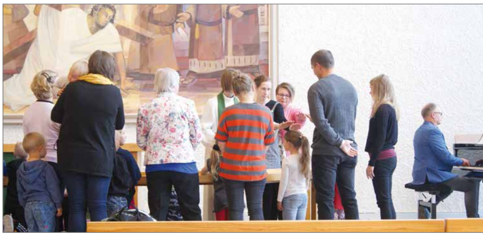
Lapset siunattiin alttarilla yksitellen heidän nimensä lausumalla ja vanhemmat saivat seurata toimitusta vierestä.