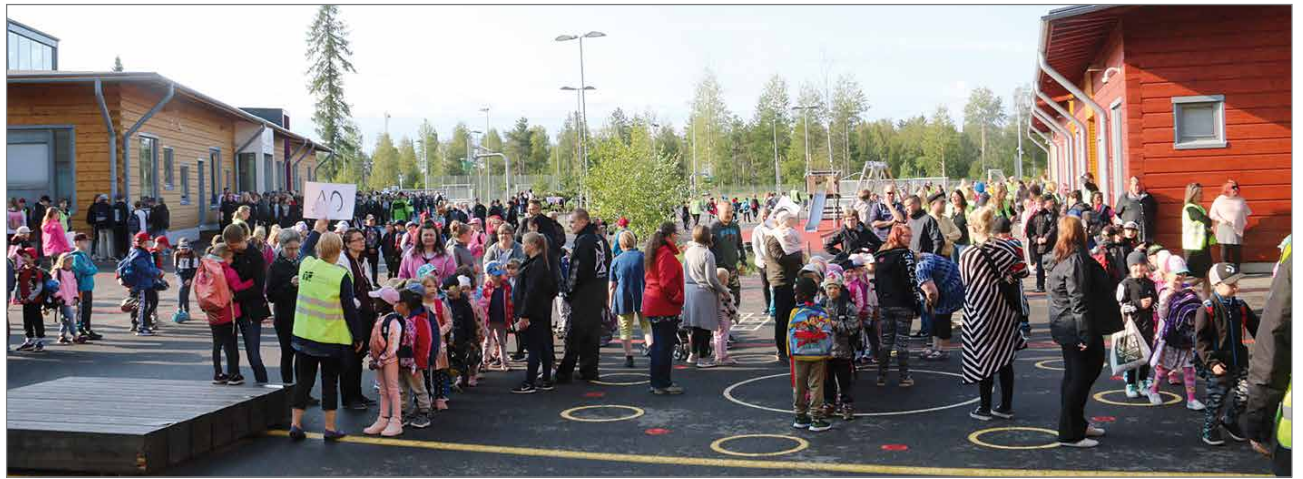
Hirsikampuksella koulu aloitettiin yhteisellä kokoontumisella koulun pihalla, josta siirryttiin omiin luokkiin opettajien johdolla.

Koulutien alkaessa Hirsikampuksella niin yhtenäiskoulussa kuin lukiossa kiinnitetään huomiota siihen, että kukaan ei jää yksin, ke-