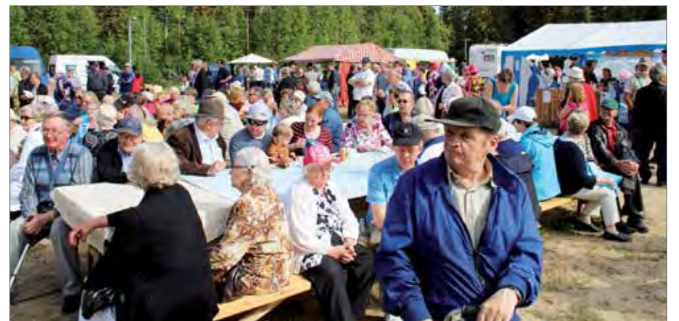
Puhujalavan edusta täyttyi kuulijoista ja penkit oli muutenkin kovassa käytössä. Kun harvoin tavataan ja kuulumisia vaihdetaan niin siinä hetki heilahtaa.