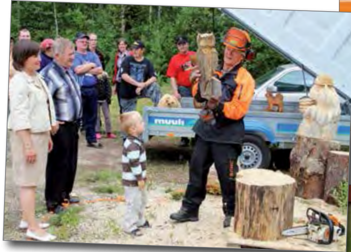
Keskiaho luovutti Kansanedustajalle pöllön markkinamuistoksi.

Koska huolto puuttui lähes täysin ja saksalaisten lennättämä huoltoavustus tipahteli usein venäläisten puolelle. Alkoivat amukset ja ruoka loppumaan motissa huolestuttavaa vauhtia ja venäläinen kiristi rengasta vahvoilla hyökkäyksillään päivä päivältä. Haavoittuneet kärsivät hoidon puutteesta ja kuolleita ei saatu enää haudattua, vaan heitä peiteltiin risuilla jsp:n viereen. Lopulta motti saatiin purettua pitkin soita kulkevaa reittiä myöten suunnatomin vaivoin. Haavoittuneet kuljetettiin purilas- ja paarikyydillä motista, terveet sai kävellä koko matkan miten jakoivat. Raskas aseistus, mitä ei saatu kuljetetuksi, tehtiin toimintakyvyttömäksi ja osa upotettiin suon rimpeihin paluumatkalla. 3600 miestä käsittävä pataljoona oli kulutettu käytännöllisesti loppuun. 1000 miestä oli kaatunut ja liki kaikki loput olivat jollain lailla haavoittuneet tai olivat muuten heikossa kunnossa punataudista tai muista sairauksista johtuen. Näin ei koko pataljoonassa ollut juurikaan taistelueloista miestä. (er)