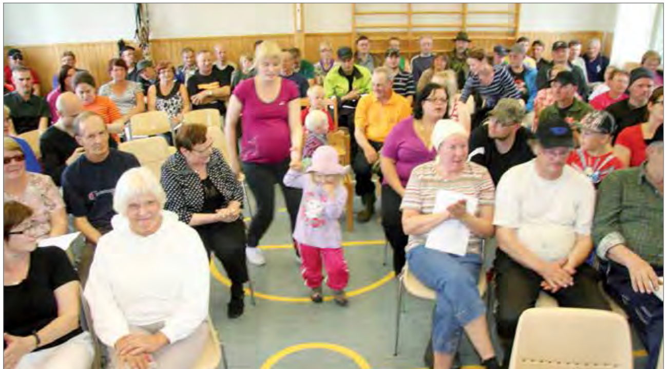
Palkintojen jakotilaisuuteen kokoontui kyläläisiä ja mökkiläisiä salin täydeltä väkeä.