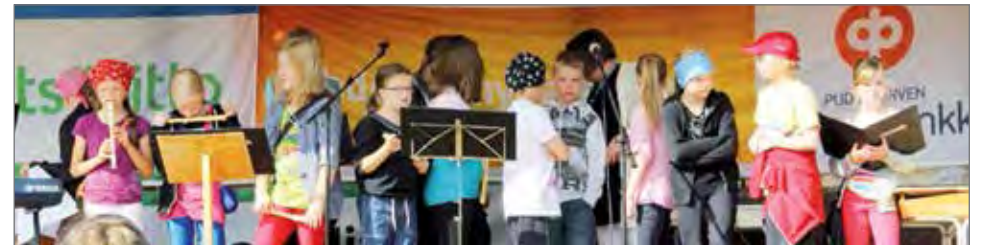
Sarakylän koululaisten musiikkiesitys oli monipuolinen