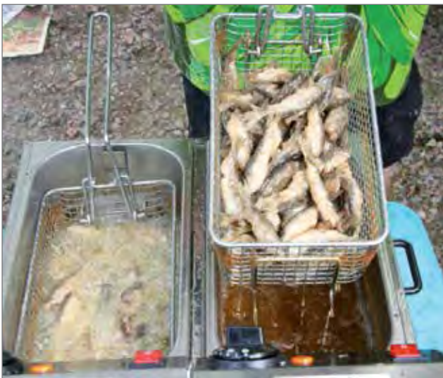
Nuotalla yhteisesti pyydytetyt muikkuja paistettiin kolmella rasvakeittimellä ja kaikki menivät makoisina suihin.