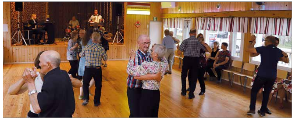
Tanssit alkoivat "Ilta Skanssissa" -valssilla.

Orkesterin juuret ulottuvat jo 90-luvun alkupuolelta yhtyeen perustamiskaupunkiin Tampereelle, josta miehistönvaihdosten jälkeen kotipaikka on siirtynyt Pohjanmaalle. Orkesteri on uusiutunut siinä määrin, että alkuperäisiä jäseniä ei ole enää mukana. Uusin jäsen on solisti ja kosketinsoittaja