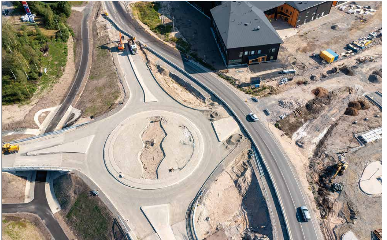
Ilmakuvaa Valtatien 20 uudesta kiertoliittymästä heinäkuun lopulta.