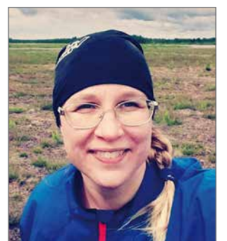
Vanhuksilta saa paljon elämänviisautta myös itselleen, vanhusten kanssa työskentely ei ole luopumista vaan elämistä tässä ja nyt.

Kun hoitoalan opiskelija tulee harjoitteluun vanhuspuolelle, muistammehan rohkaista opiskelijaa kohtaamaan ikäihmisen aidosti arvostaen. Ne kädentaidot tulevat kyllä siinä työn mukana. Meillä on vanhuspuolella eri kulttuureista tulevia hoitajia, ja he tuovat myös uudenlaista näkökulmaa ja osaamista hoitotyöhön.