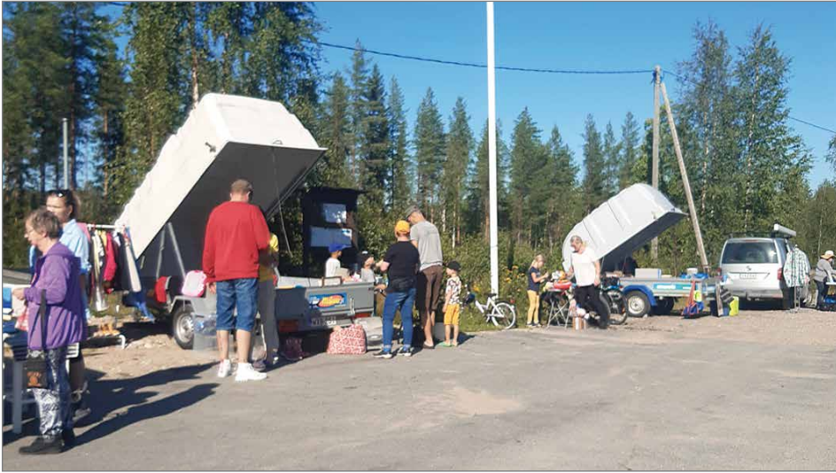
Ervastin tämän kesän peräkärrikirppikseen saapui yhdeksän myyjää.