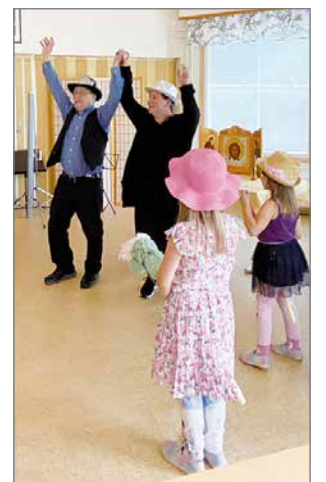
Arhippaisen perheen laulelkeittä vienankarjalaksi.

listujien määrään, mutta siitä huolimatta meillä oli hyvä pruasniekka parinkymmenen ihmisen voimin. Oli oikein mukavaa kokoontua kahden vuoden tauon jäl-