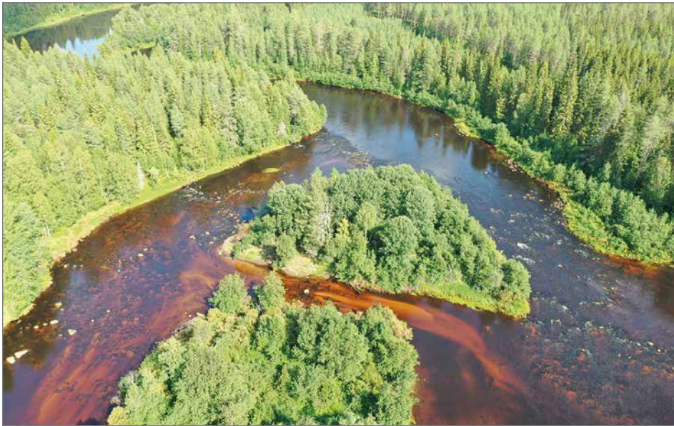
Peurakoskeen ajetaan kutusoraa sekä lisäksi alueelle rakennetaan kivikkoa poikasille ja parannetaan valuma-alueita.

Kunnostuskohteet inventoitiin sukeltaen etukäteen raakkujen esiintymisen varalta, mutta esiintymiä ei löytynyt kunnostettavilta alueilta tai niiden välittömästä läheisyydestä. Raakkuinventoinneista vastasi Alleco Oy. Kunnostus-