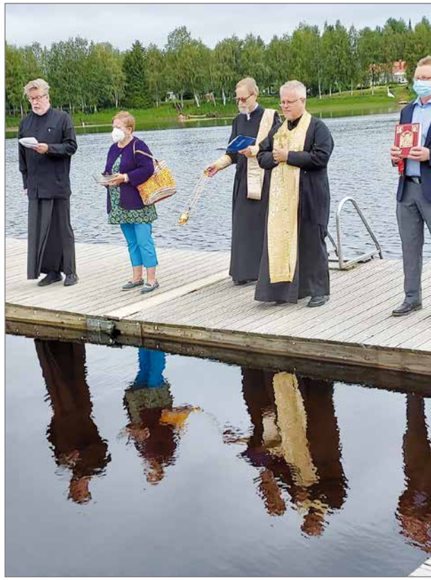
Vedenpyhitys tapahtui Rajamaan rannassa.