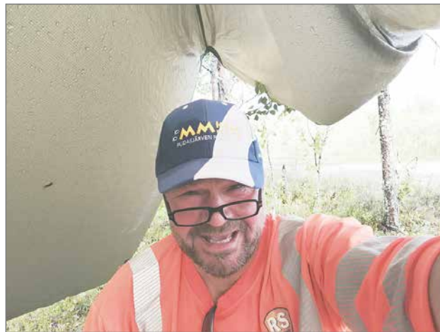
Pudasjärvi-Puolanka -matkalla oli joka päivä sateista ja kostea oli teltassa yöpymisessäkin.

- Menin hissillä ylös ja kävelin alas viisi kerrosta. Puoli tuntia minulla kesti tulla alas, kun jouduin sivuttain tulemaan rappu