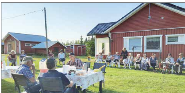
Petäjäkankaan nuotioillassa aurinko hehkutti tunnelmaa entistä lämpimämmäksi.

Heinäkuun viimeisellä viikolla nuotioitloja pidettiin Kuussa, Petäjäkankaalla, Kipinässä ja Sarakylässä. Kuren vanha koulu nykyinen kylätalo tarjoaa idyllisen paikan illanvietolle. Petäjäkankaan nuotioillassa aurinko hehkutti tunnelmaa entistä lämpimämmäksi. Kipinän kalastuskeskuksen laavun äärellä avautuu hieno näkymä joelle. Sarakylän nuotioillan erityispiirteisiin kuuluu kesäkahvila. Tänä vuonna Sarakylä oli kesän