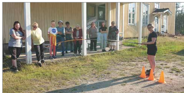
Kuren vanha koulu nykyinen kylätalo tarjosi idyllisen paikan illanvietolle.

Seurakunta järjesti yhteistyössä kylien kanssa nuotioitloja käytännössä koko heinäkuun ajan. Tänä vuonna nuotioitloja pidettiin kolmellatoista eri kylällä. Nuotioitlaväkeä kävi paikalla yhteensä lähes kolmesataa, mikä on normaalimäärä edellisvuosiin verrattuna. Nuotioillan ohjelmassa oli joka kylällä yhteislauluja, leikkimielisiä kisailuita, yhdessä oloa, makkaransyöntiä ja hartaushetki.