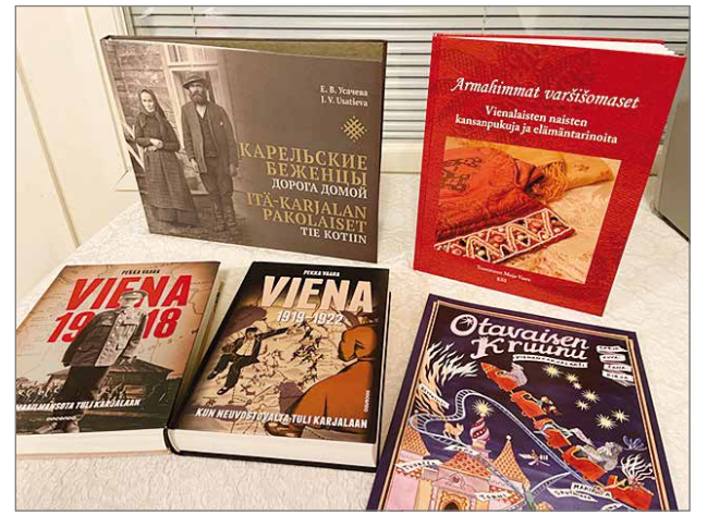
Tilaisuudessa oli esillä Vienan Karjalaan liittyvää kirjallisuutta.