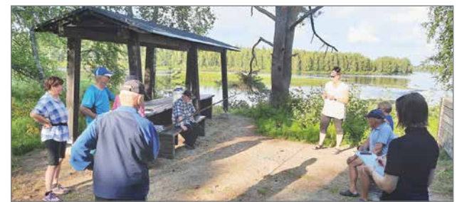
Kipinän kalastuskeskuksen laavun äärellä avautuu hieno näkymä joelle.