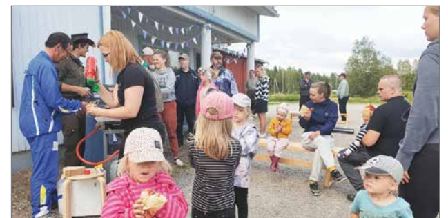
Sarakylän nuotioillan erityispiirteisiin kuuluu kesäkahvila.

Kiitos vielä kerran kaikille nuotioillassa käyneille. Kiitos vieraanvaraisuudesta ja lämpimistä vastaanotoista eri puolella laajaa pitäjää. Oli erittäin mukava käydä pitä-