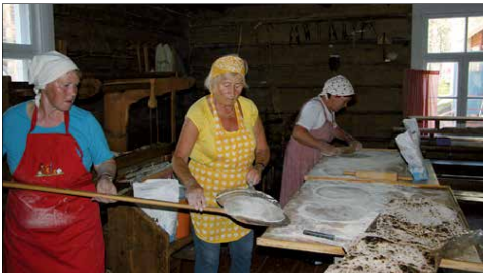
Taipaleenharjun kyläseura on järjestänyt monena vuonna leivontänäytöksiä kotiseutumuseolla.