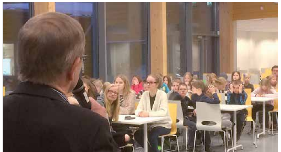
Oppilaat olivat valmistelleet kansanedustajalle hyviä ja näpäkkeitä kysymyksiä.

ta koulussa niin, että pojatkin innostuisivat enemmän opiskelusta. Toinen juttu onkin, että millä konstilla. Yleisöstä kuului toteamus: -Tabletit tunneille! Niiden avulla voidaan opiskella, vaikka matematiikkaa.