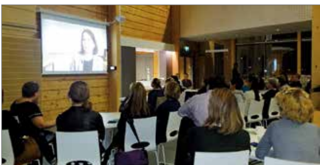
Videon välityksellä kuultiin opetus- ja kulttuuriministeri Sanni Grahn-Laasonen ajatuksia muun muassa koulun tar-koituksesta.

Suomen Vanhempainliitto ry, Opetusalan Ammattijärjestö ry, Opetushallitus, Suomen Kuntaliitto ry ja HundRED.