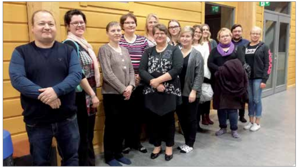
Hirsikampukselle perustettiin vanhempaintoimikunta, kuva perustamiskokouksesta.

Vanhempaintoimikunnan tehtävänä on toimia matalan kynnyksen yhteistyöelimenä koulun ja kotien välillä. Käytännössä se ilmenee yhteistyönä, kasvatuskumppanuutena ja yhteisinä tavoitteina mahdollisimman monipuolisin toteuttamistavoin. Konkreettisesti esimerkiksi edistetään koulun toiminnan periaatteita, osallistutaan tapahtumien, tempauksien ja tilaisuuksien järjestämiseen sekä kehitetään muita kouluarkeen liittyviä käytäntöjä.